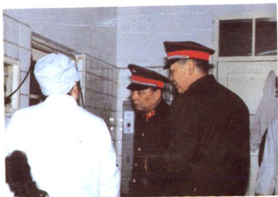
△ 1987年总后勤部赵南起部长(中)来医院视察