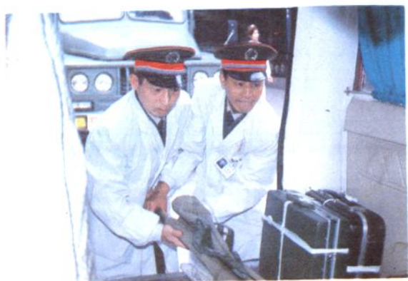
△ 1992年医院由总后确定为全军野战应急机动医院,医院开展了应急救护训练。图为医务人员将战救器材紧急装车