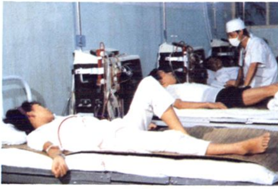
△ 医院先后从瑞典、美国、德国引进人工肾机 15 台,大型水处理装置 2 套,图为医院血液透析中心