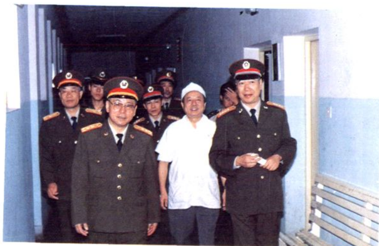
▷ (前排左一) 来医院视察 一九九二年总后勤部李伦副部长