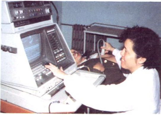
△ 1988 年引进的心脏彩色多普勒