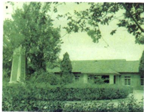
△ 医院六十年代院容一角