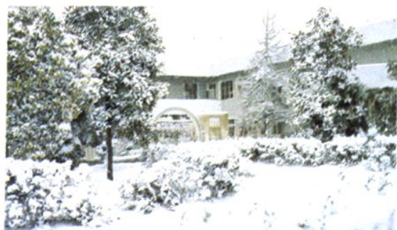
△ 1988年建成投入使用的传染科新病房外景