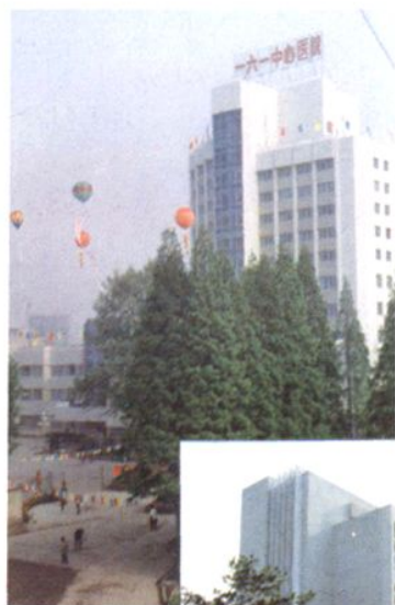
◁ 投资一千多万元于1994年 建成的门诊大楼