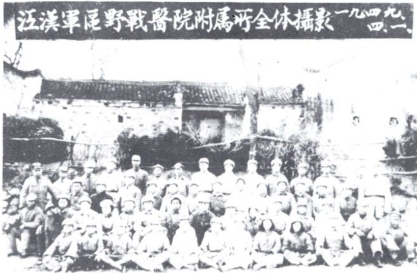
△ 1949 年 4 月 1 日医院前身江汉军区野战医院附属所全体人员在湖北省安陆县境内合影