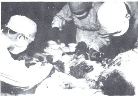
△ 1963 年 5 月 22 日总参三部六局幼儿园锅炉发生爆炸, 烫伤多名儿童, 医院全力组织抢救, 成功地救活了 3 名重度烫伤儿童。医务人员正为患儿进行植皮术