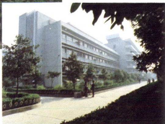
◁ 1986年建成的集临床、科研、 教学为一体的综合大楼