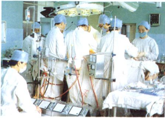
△ 医院从 1986 年起开展了体外循环心内直视手术