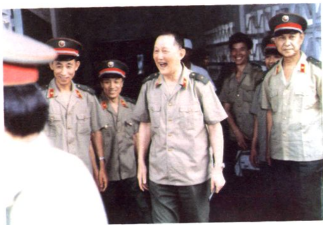
◁ 1985年总后勤部洪学智部长(中)在基地指挥部张书坤司令员(右一)陪同下来医院视察