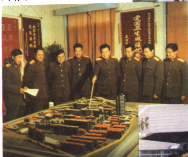
◁ 医院领导正在研究医院 建设未来发展规划