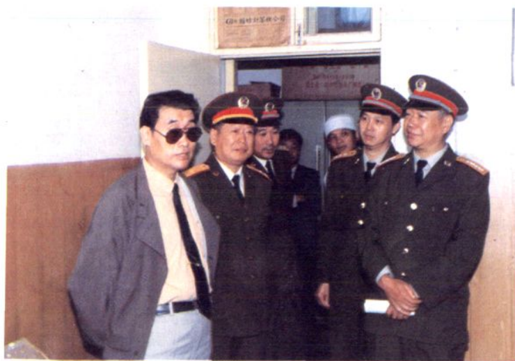
△ 1991年总后卫生部张立平部长 (左一)来医院视察指导工作