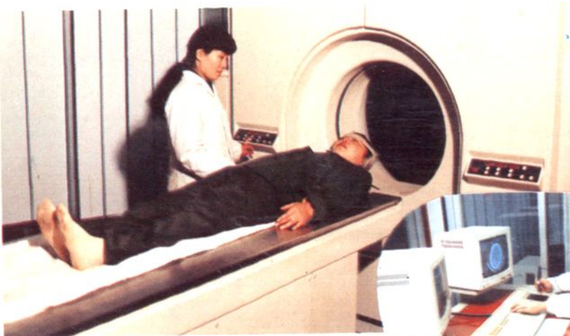
1992年引进的全身CT设备