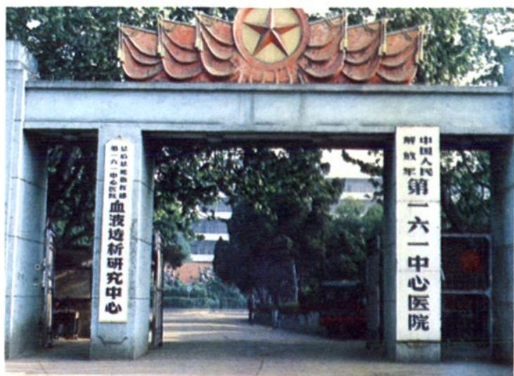
▷ 八十年代医院大门全景