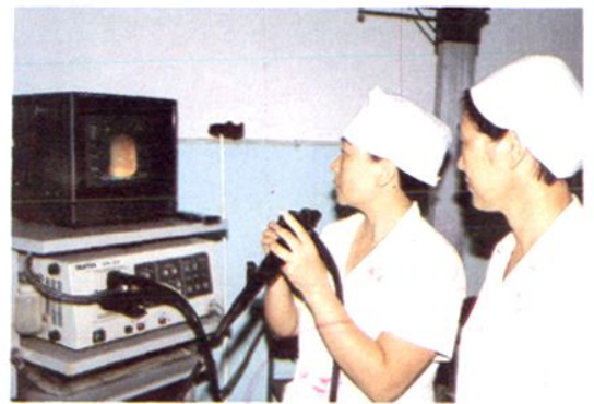
△ 1990 年购买的电子胃镜