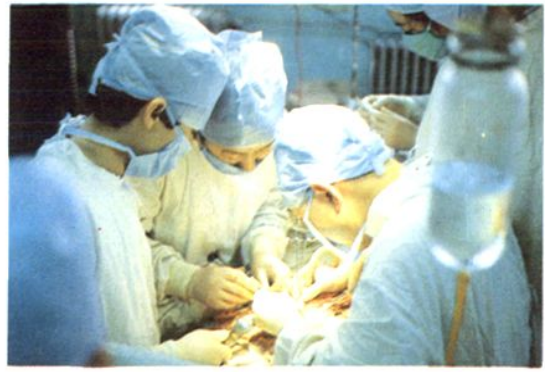
△ 1992 年起开展了同种异体肾脏移植手术