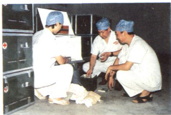
△ 医务人员清点手术器材准备出发