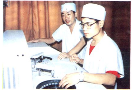
△ 1989 年引进的全自动生化分析仪