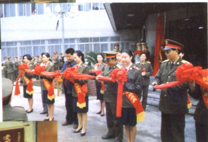
▷ 1994年4月25日武汉后方基地 司令员江杰生(右一)、原总后武汉办 事处主任杜克安(右三)、武汉市副市 长殷增涛(右五)为医院新门诊大楼 开诊剪彩