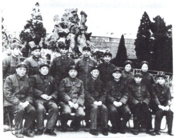
△ 1983年总后勤部副部长张汝光(前排左四)来医院视察