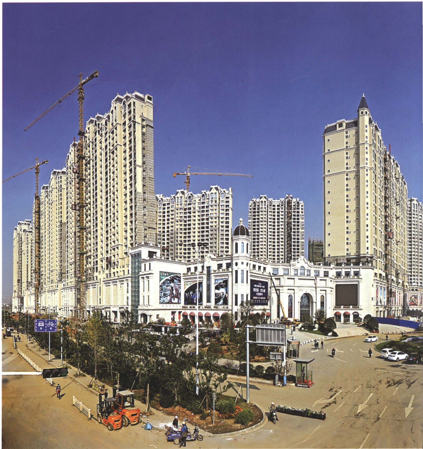
碧桂园城市综合体