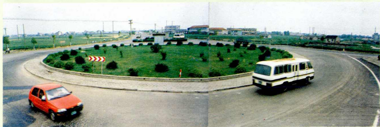
金山县交通枢纽之一——亭新乡交通设施