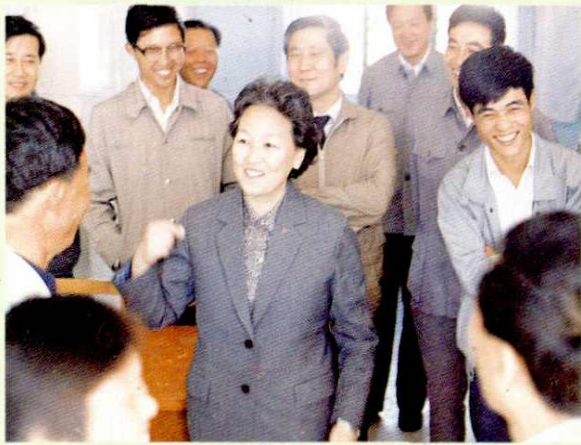
谢丽娟副市长视察亭新乡卫生工作