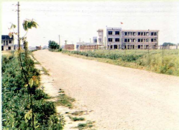
村校——新联小学外貌