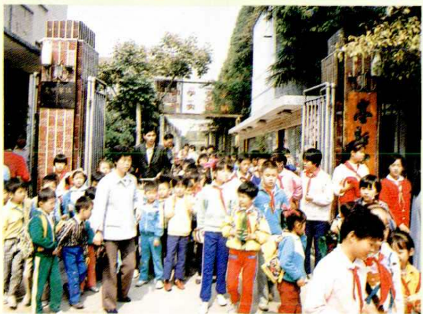
亭新中心小学校门