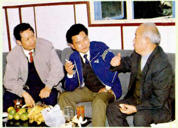
市司法局长薛明仁(右一)来亭新视察工作