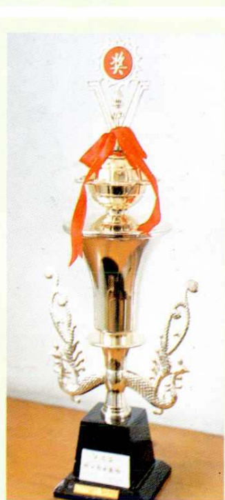
亭新中学勤工俭学