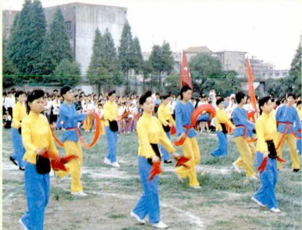
亭新中学文娱活动