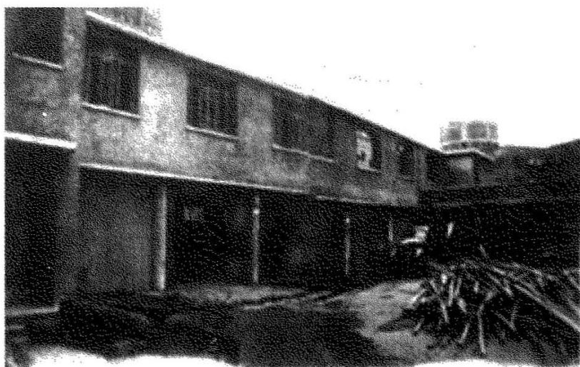
国际旅行社上海分社汽车队车库。1957年建造，1959年拆除，改建为锦江饭店小礼堂。

办公地址搬入锦江饭店内东侧车库（现锦江小礼堂原址），曾参与印度尼西亚总统苏加诺、苏联国家主席伏罗希洛夫、朝鲜首相金日成等的重大接待任务。