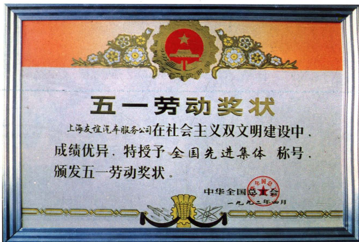
全国五一劳动奖状