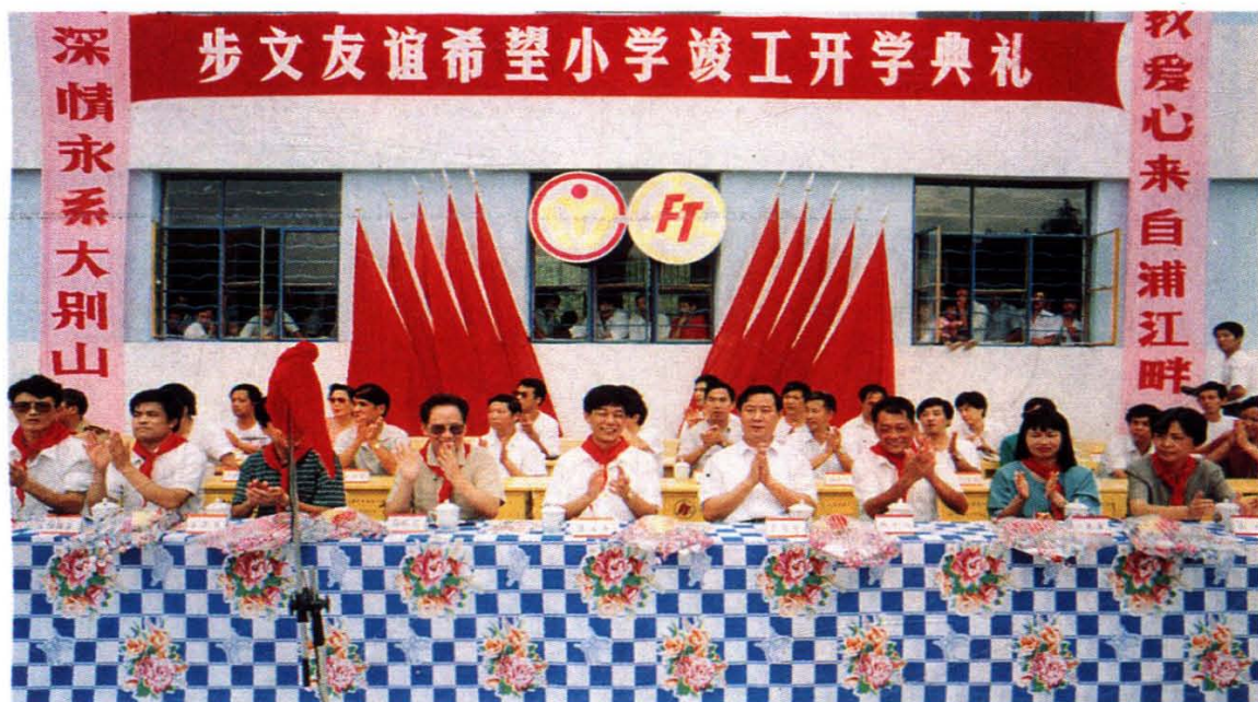
公司捐助的安徽“步文友谊希望小学”竣工开学典礼