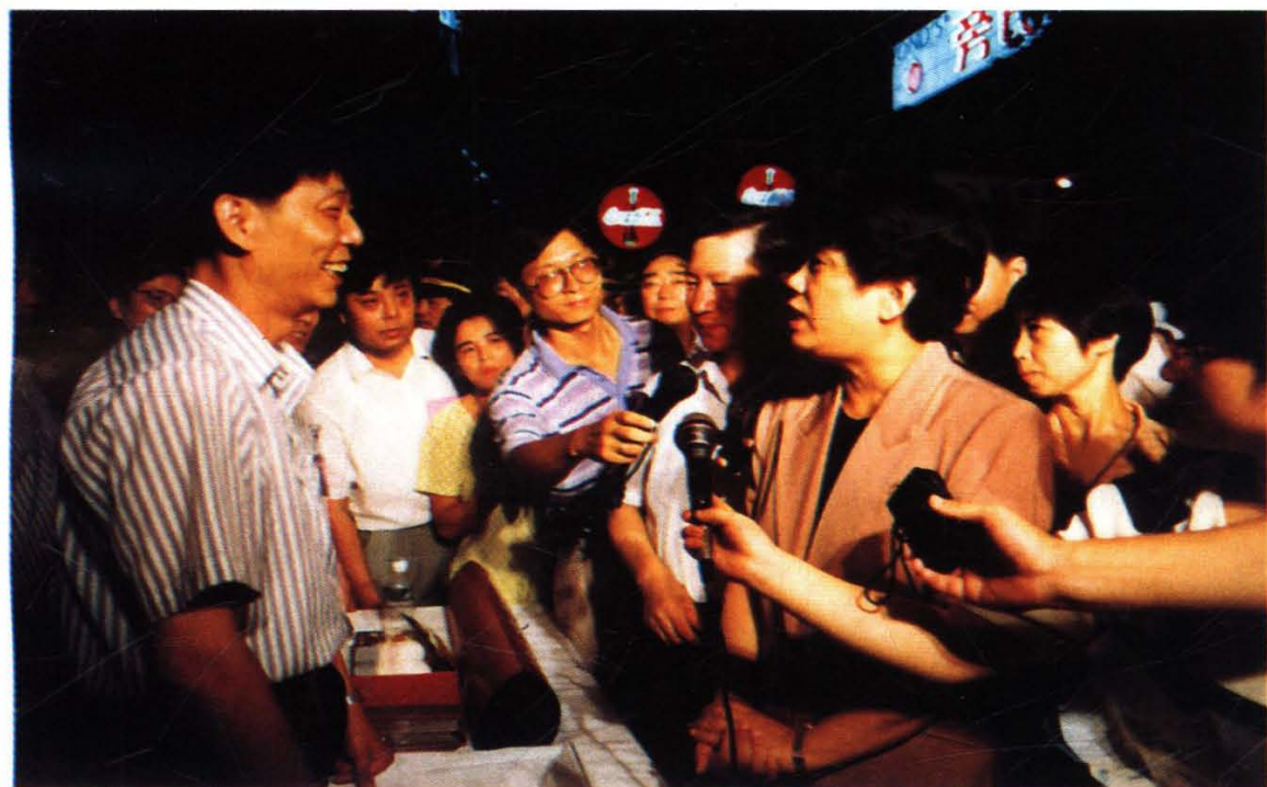
在96年市“九大窗口行业规范服务达标”咨询活动中， 市委副书记陈至立、宣传部长金炳华称赞友谊的一流服务。