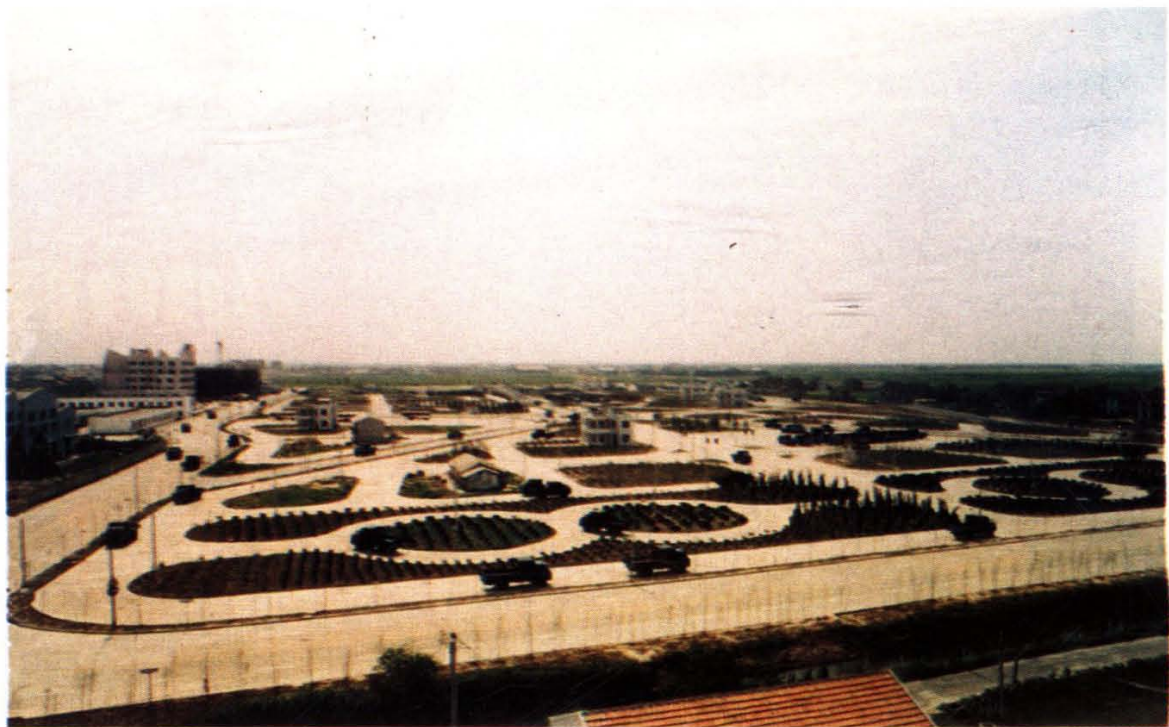
万国机动车驾驶员培训中心教练场地全景