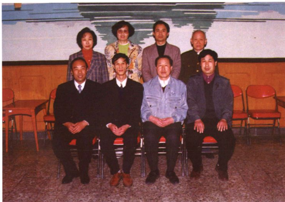
编辑委员会全体成员