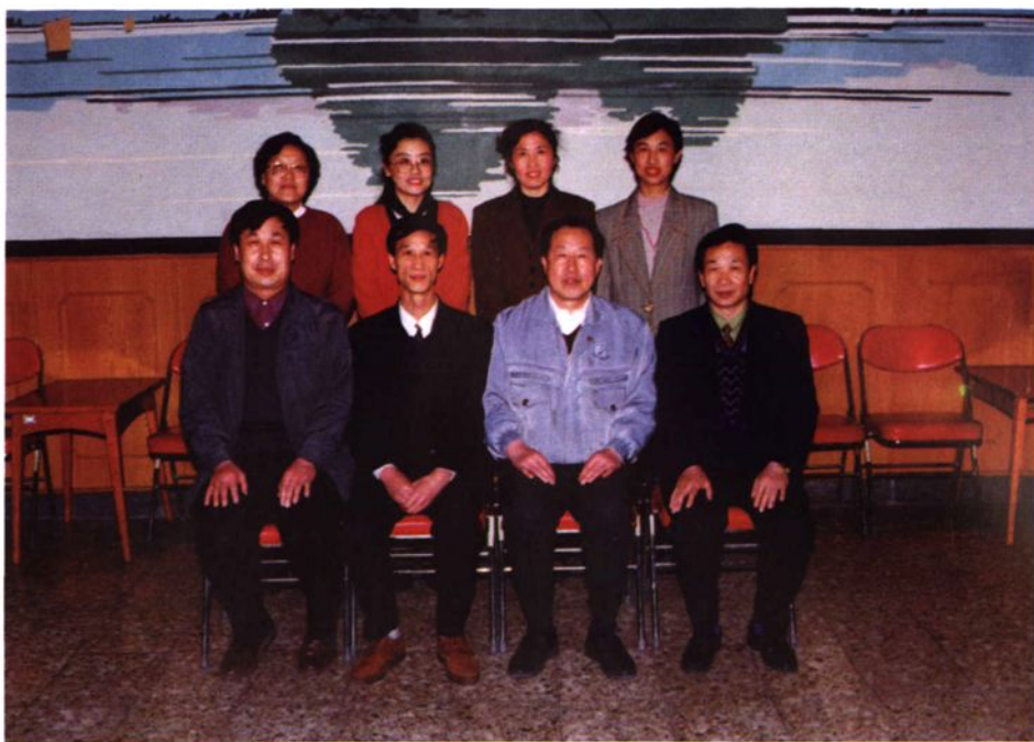
二龙路街道工委委员