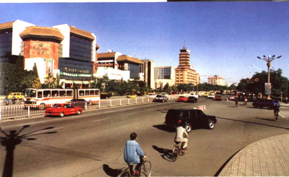
中国工艺美术馆 百盛购物中心