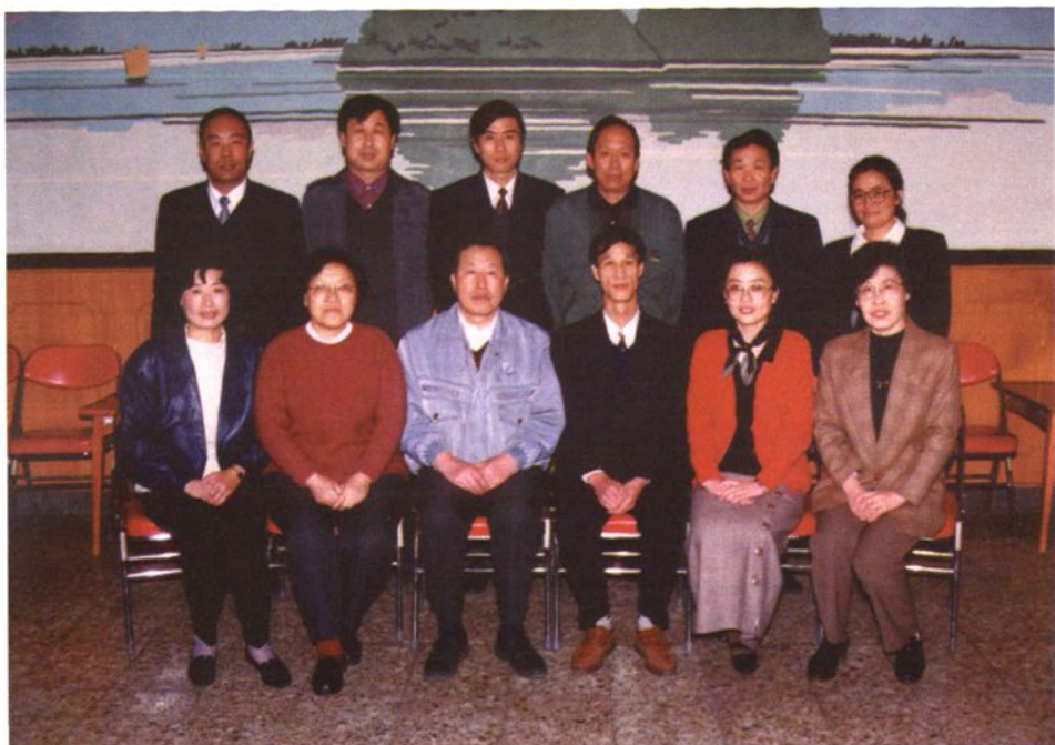
工委、办事处全体领导