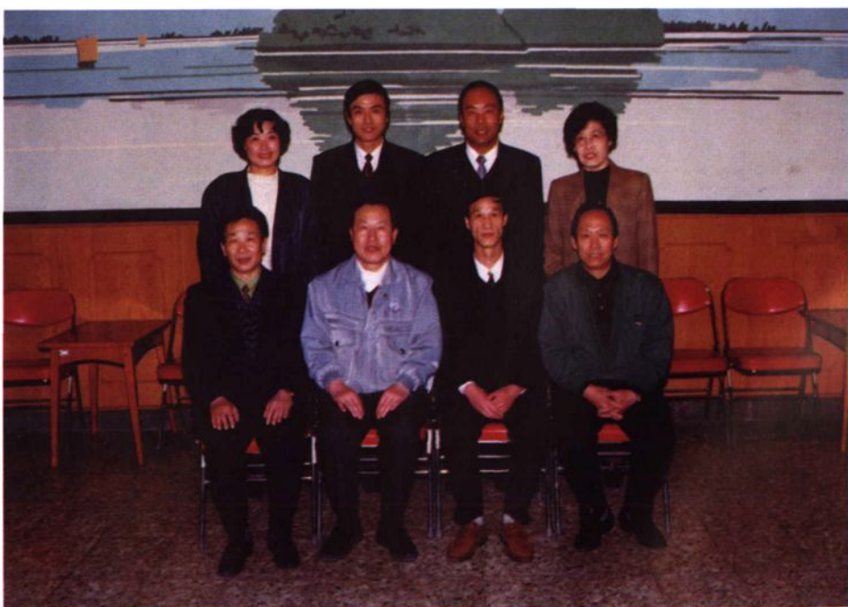
工委书记、办事处正、付主任