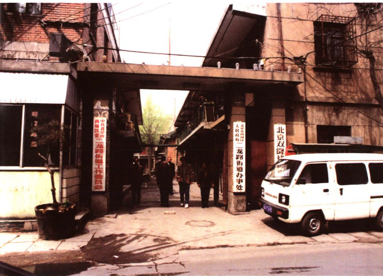
二龙路街道办事处