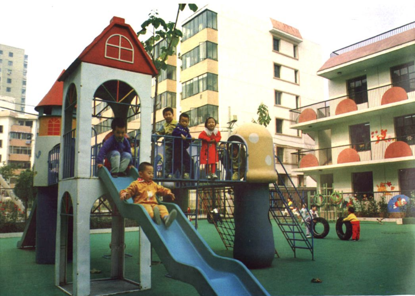
新京畿道实验幼儿园