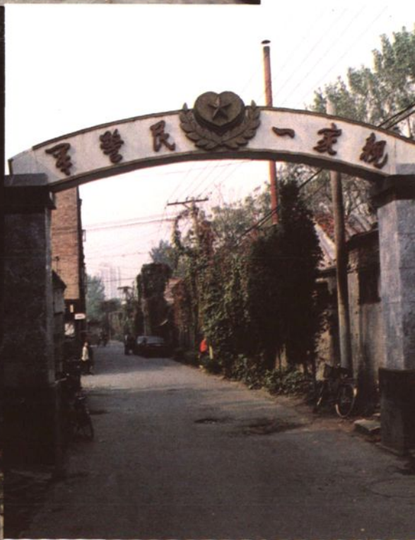
军警民一家亲牌楼