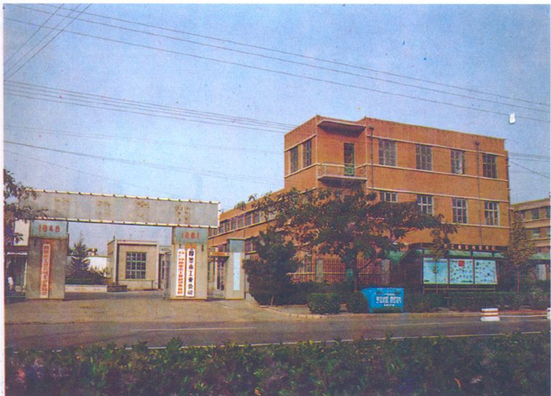
即墨市工业公司办公大楼，座落在即墨市新兴路 23 号