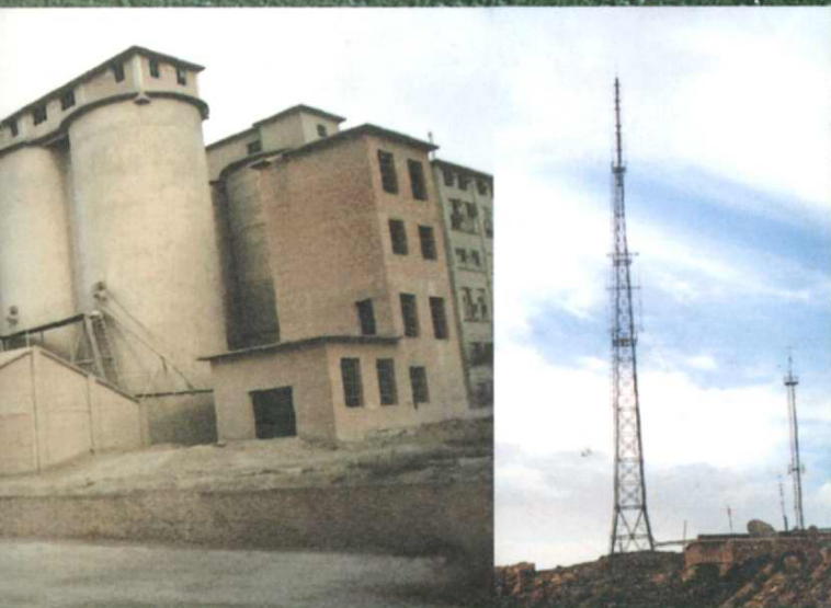
內蒙古自治區地方志叢書