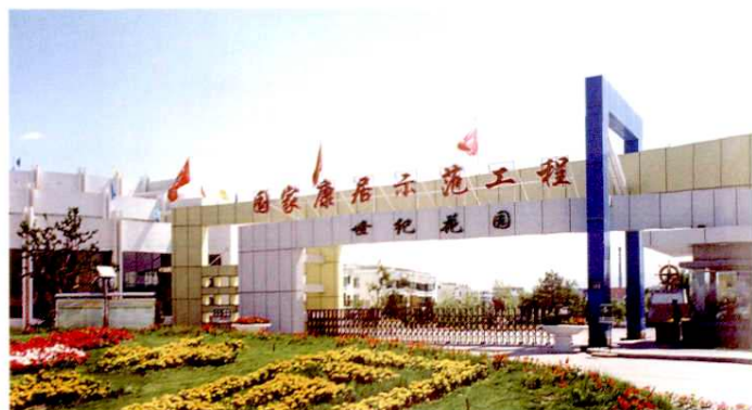
国家康居示范工程——世纪花园