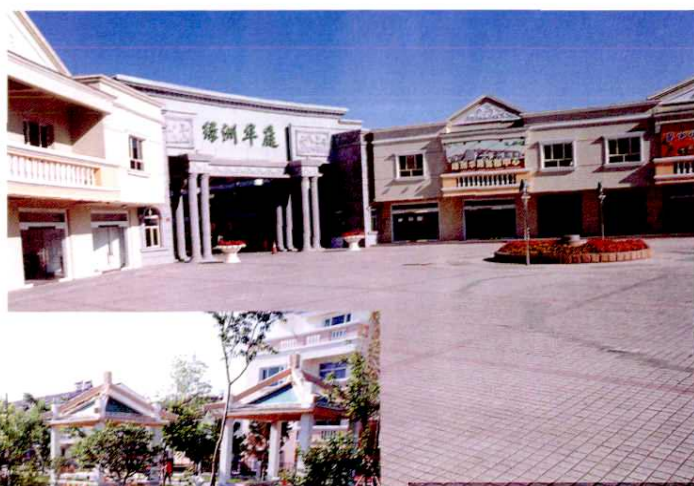
绿洲华庭别墅小区

昌吉市是亚欧大陆桥上一颗璀璨的明珠。城市硬软件建设齐全上乘，城市环保质量优良，是新疆维吾尔自治区最佳投资环境城市和人居最佳环境城市。