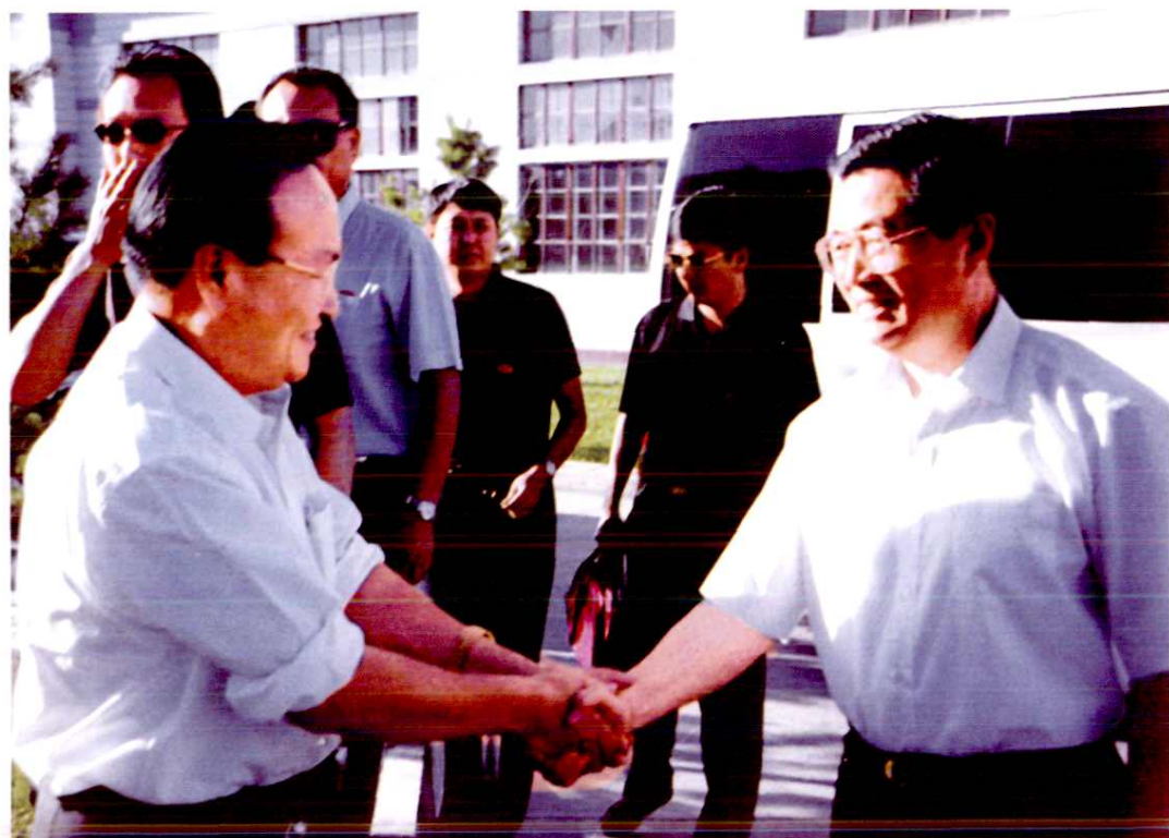
2001年6月13日,中共中央政治局常委、国家副主席胡锦涛考察昌吉时,勉励昌吉各族干部群众,在党中央领导下,抓住机遇,加快发展,争创一流。