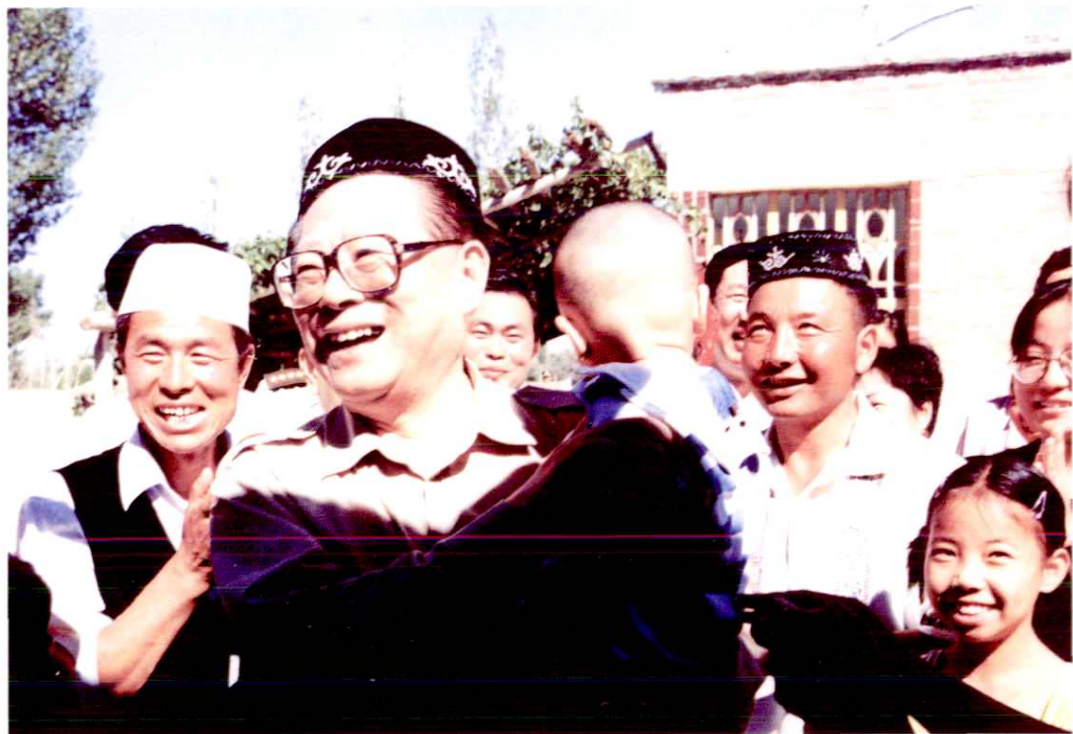
1998年7月7日,中共中央总书记江泽民再次考察昌吉时,亲切看望了三工镇常胜村王玉勤一家和哈萨克族牧民沙依拉别克一家。