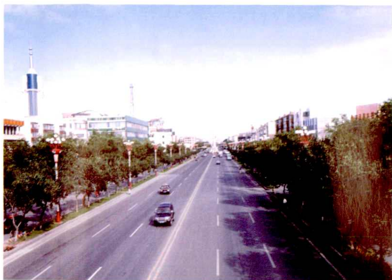
312国道乌伊公路横贯市区

昌吉市获全国城市环境综合整治优秀城市、全国卫生先进市、全国双拥模范城(二连冠)、全国科技进步示范市、全国民政工作先进