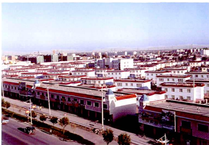
小康示范村——南五工二组