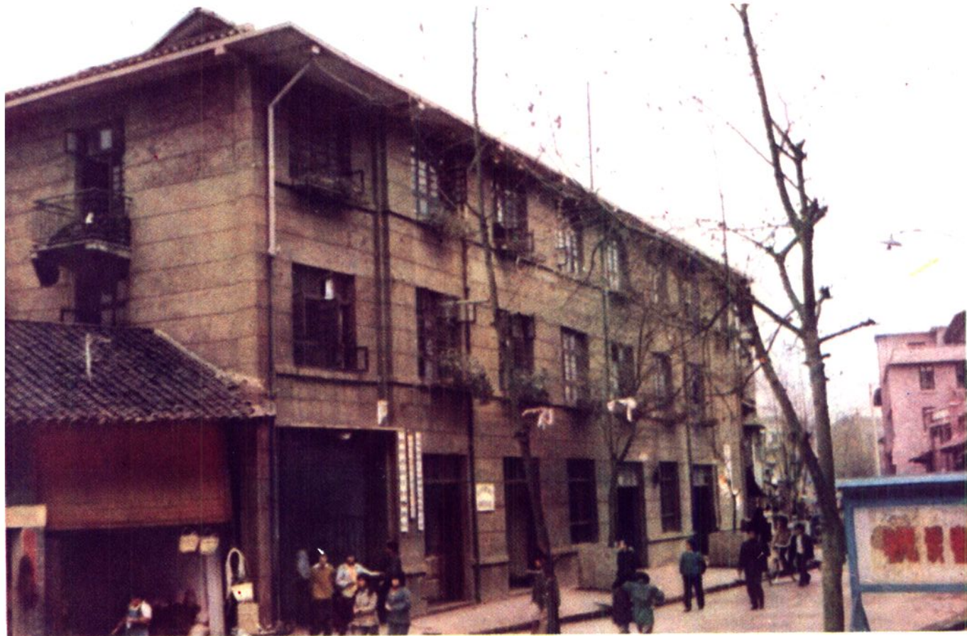
印江县粮食局办公楼