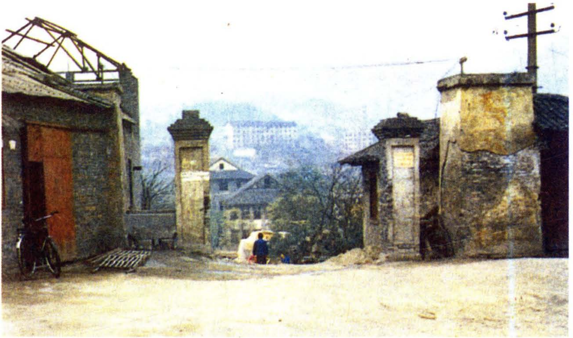
四川省立教育学院校门