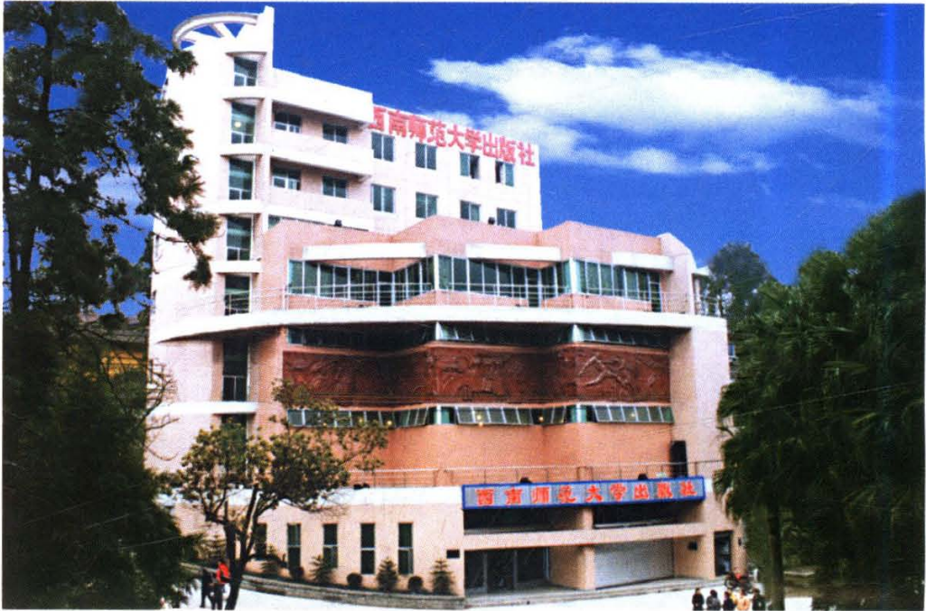
西南师范大学出版社大楼