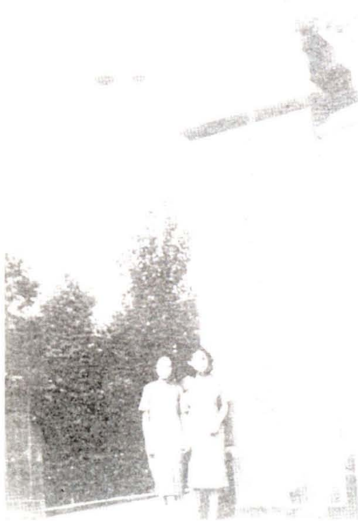
国立女子师范学院校门