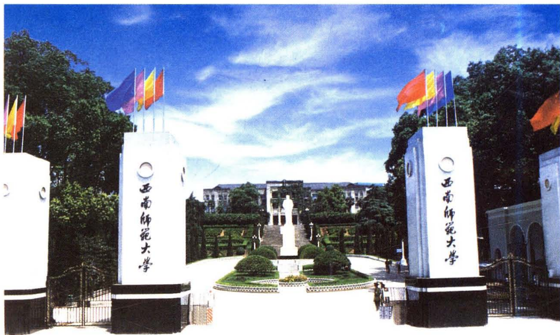
大 校 门