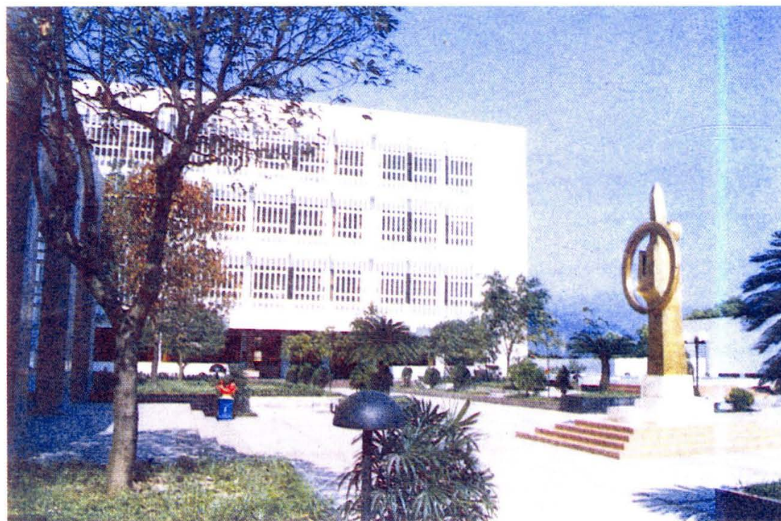
图 书 馆