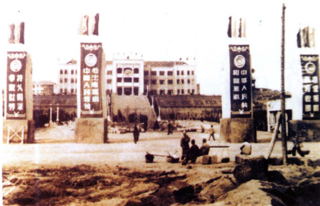
西南师范学院建校初期的大校门