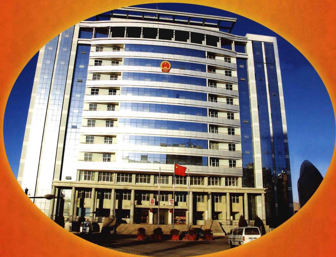
青海省西宁市城东区人民政府新办公大楼（西宁市昆仑东路188号）