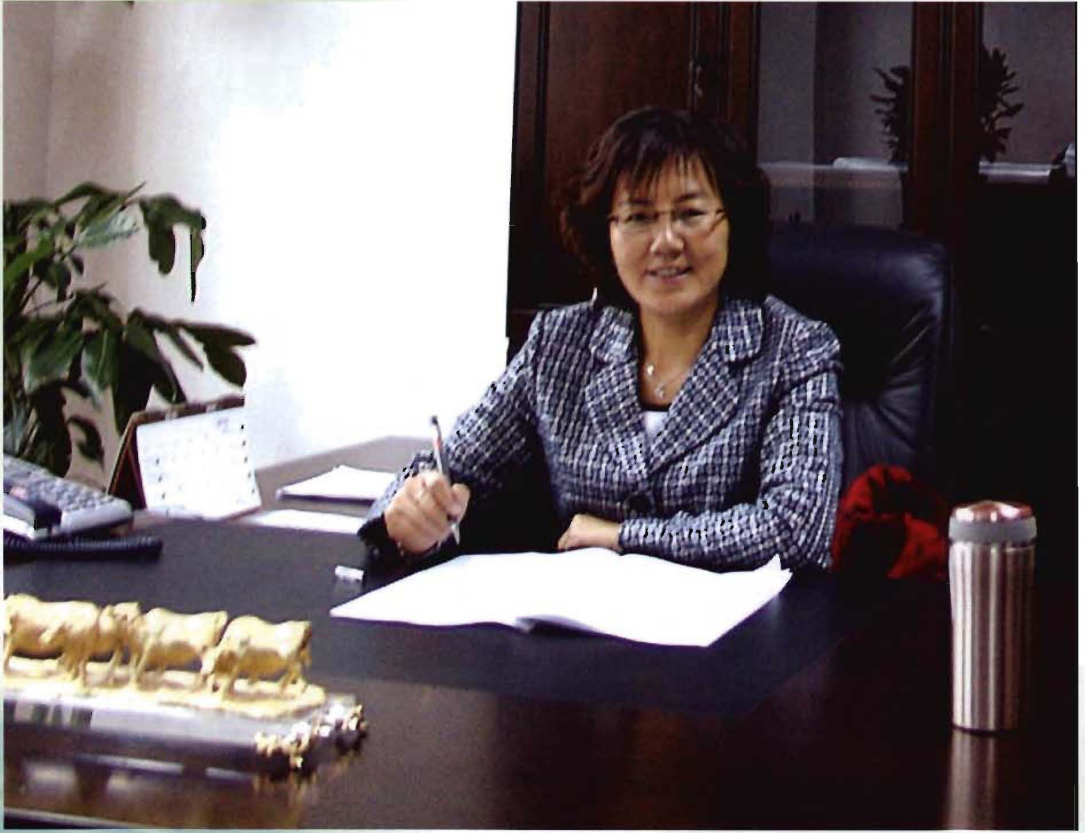
区政协主席 张梅玲