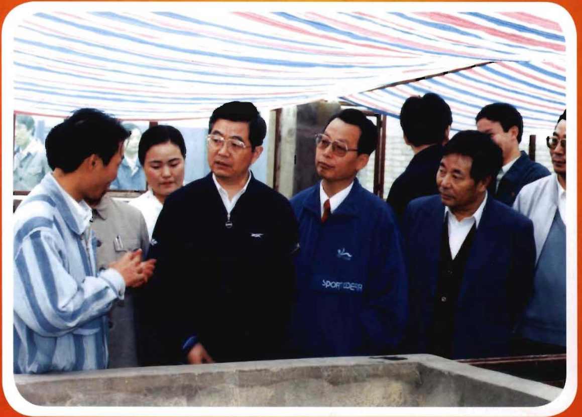
1995年7月13日，中共中央政治局常委、书记处书记胡锦涛视察张氏畜禽实业开发有限公司