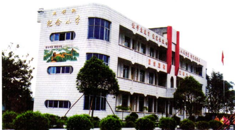
1999年由法国华侨教育基金会资助20万元援建的茅河乡姚舒脚纪念小学