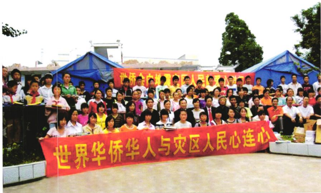
世侨会来名山县中峰中学考察5·12地震灾情