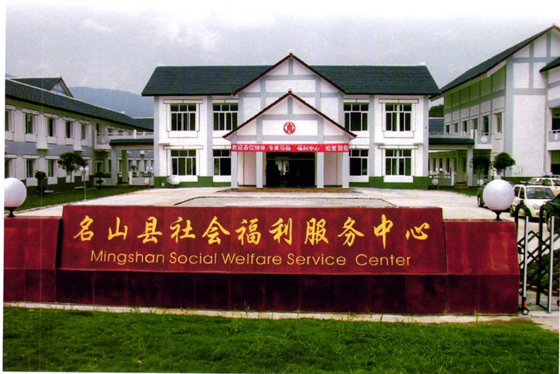
由台资企业广州宏昌电子材料股份有限公司援建的名山县社会福利服务中心