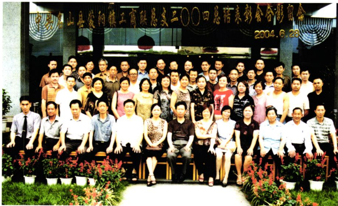
2004年6月，中共蒙阳镇工商联总支总结表彰大会