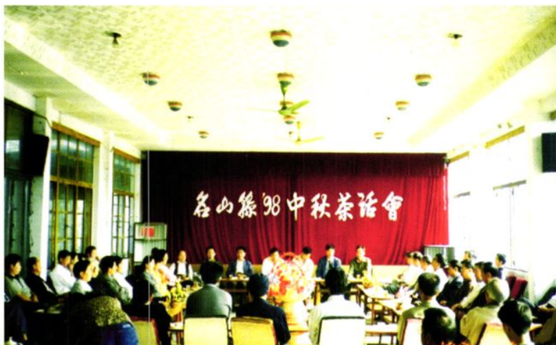
1998年9月29日，中秋茶话会