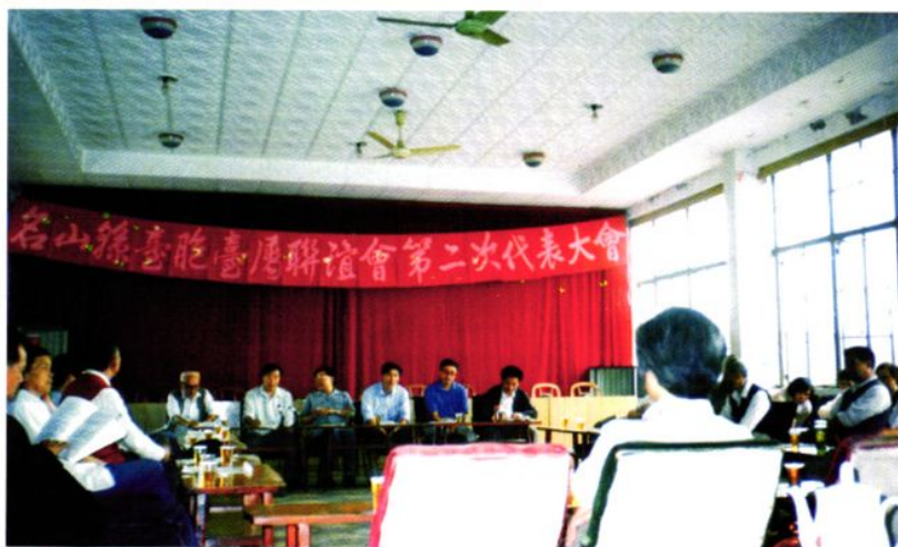
1998年9月18日，名山县台胞台属联谊会第二次代表大会