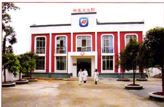
5·12地震灾后重建侨爱工程名山县解放乡侨爱卫生院