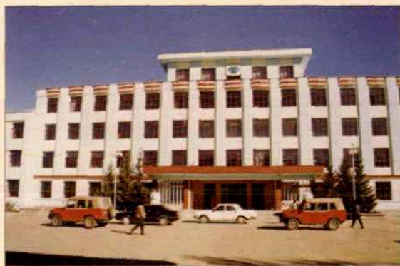
绰源林业局办公大楼