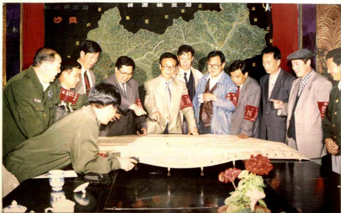
绰源林区防火指挥部