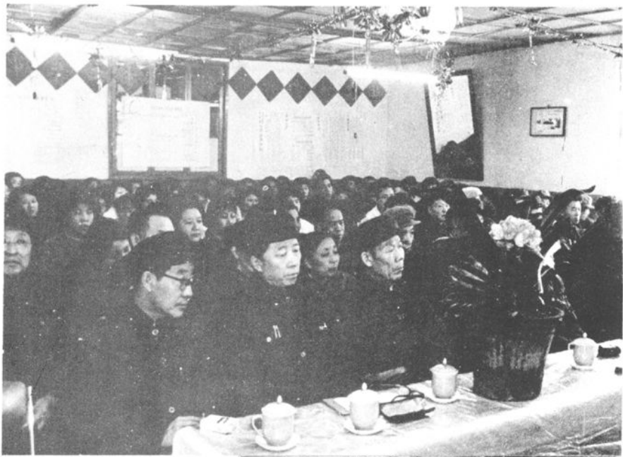
1984年3月我所举办了建所三十周年纪念活动，图为纪念大会会场。