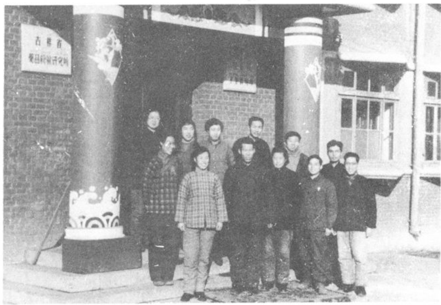
一九六〇年部分職工合影。