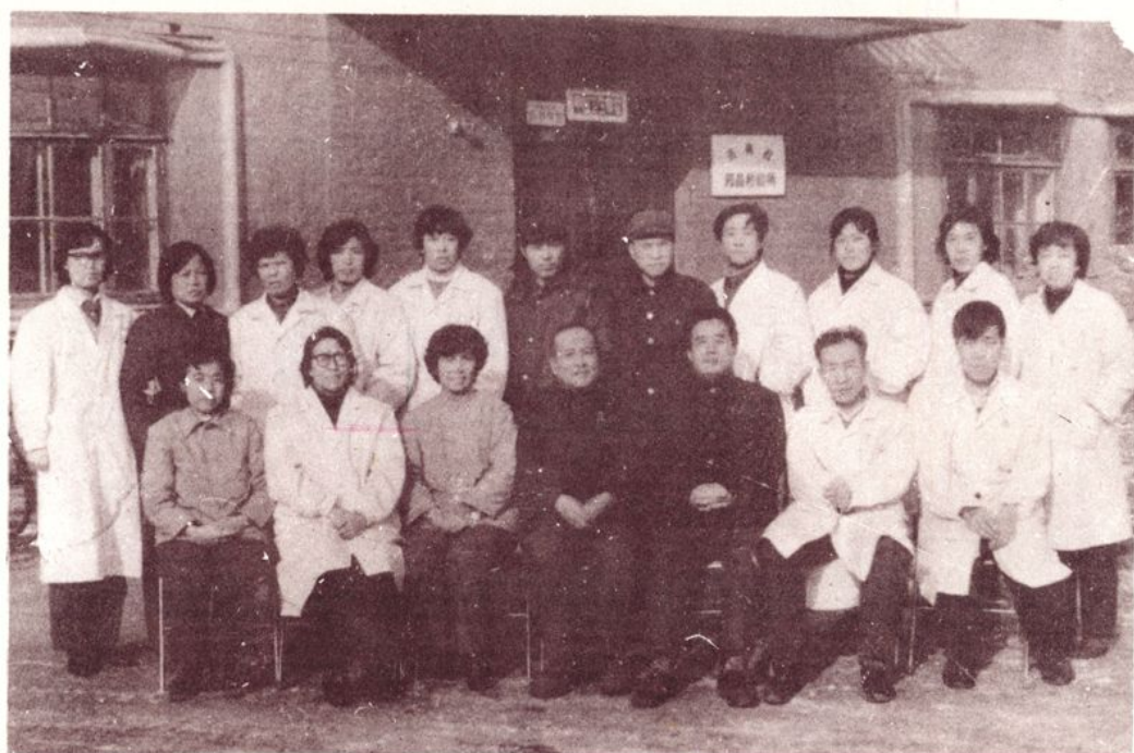
所领导与本所1985年度先进工作者合影。