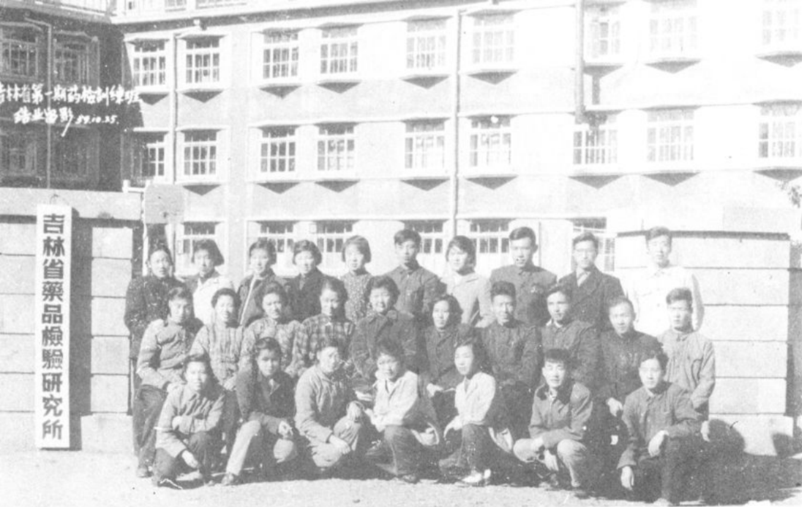
一九五九年我所舉辦的第一期 藥檢訓練班結業合影。