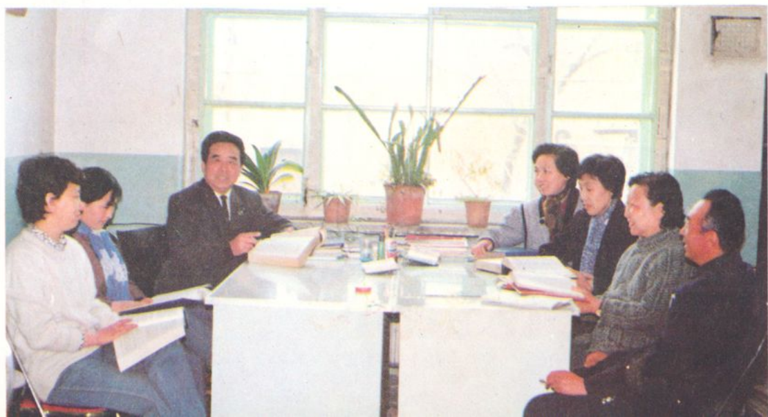
▶所志编写人员在研究所史资料。