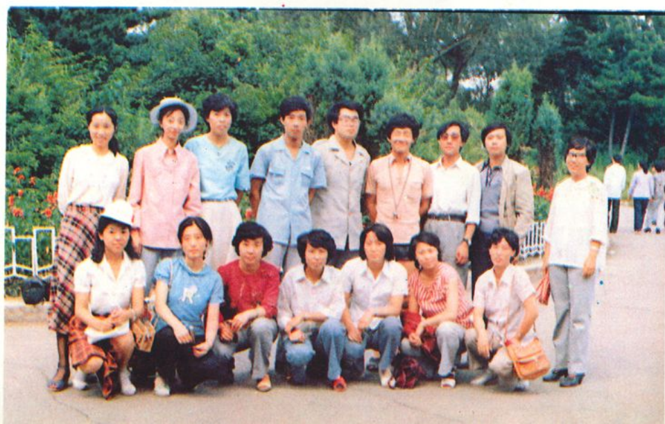
1987年五·四青年节团支部组织团员游园时合影。