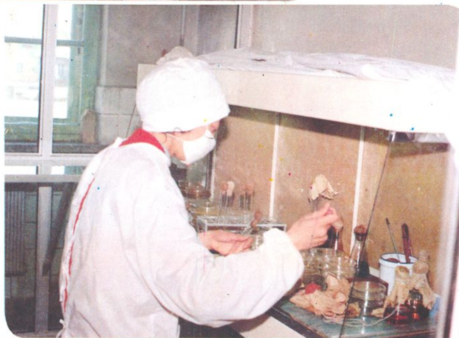
菌检业务人员正在进行药品卫生学的检验。