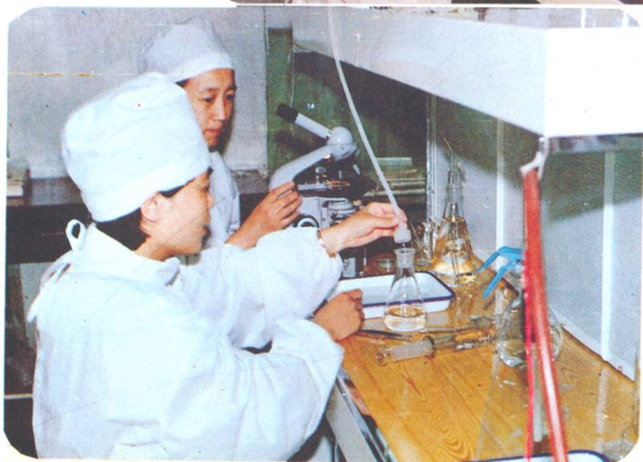
化学室的业务人员正在进行大输液的微粒检查。