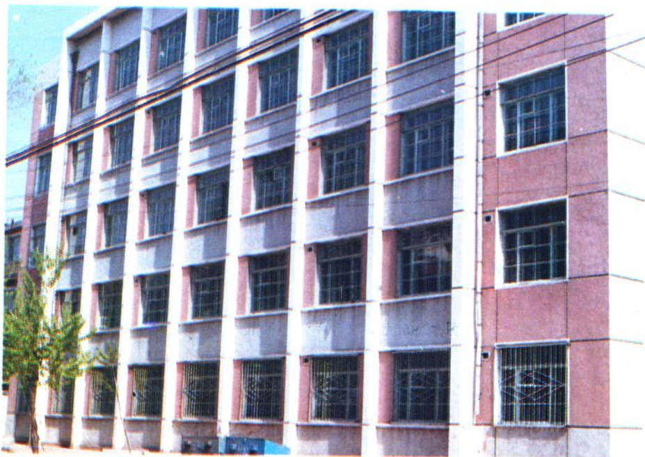
1987年5月交 付使用的新建实验 大楼。