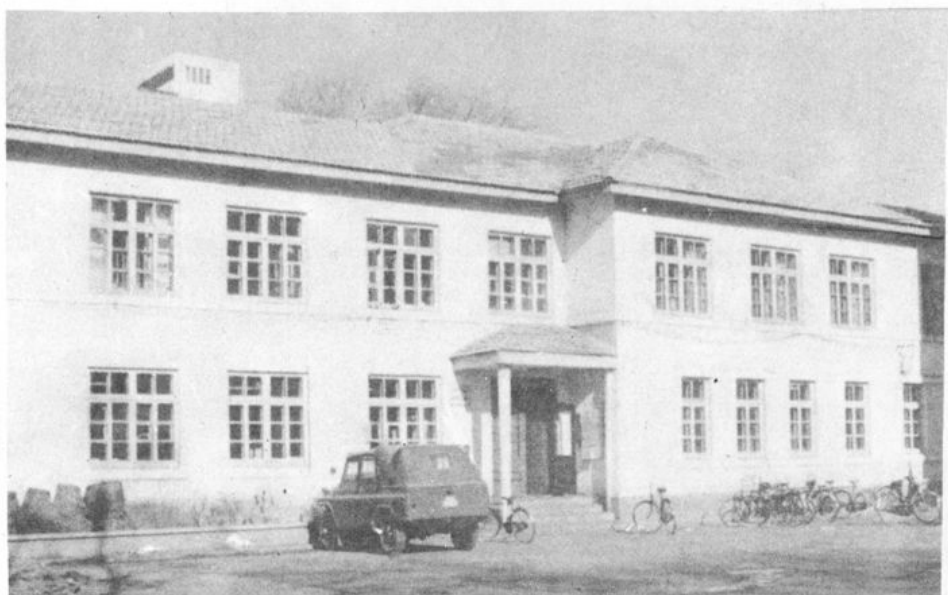
1953年11月20日，吉林省人民政府卫生厅 药品检验室成立于吉林市南京街，图为当时旧址。