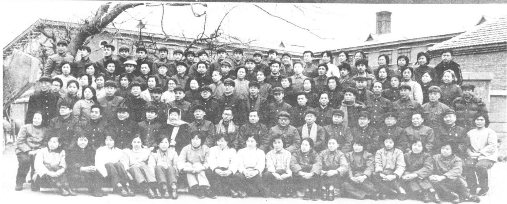
参加我所建所三十周年纪念活动全体人员合影