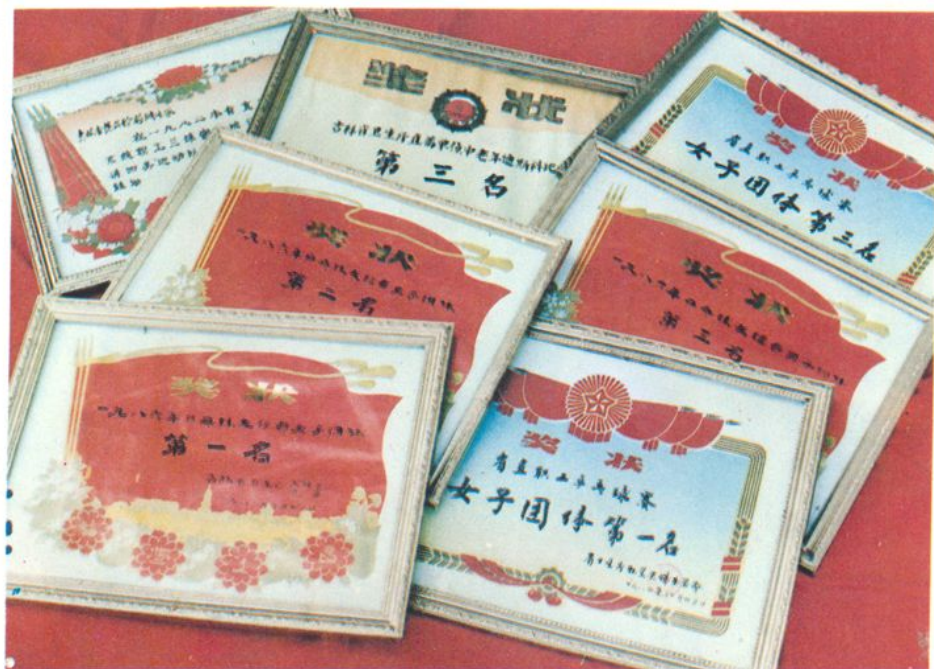
②我所在省直卫生系统组织的历次体育比赛中均获得了较好成绩，图为部分奖状

为丰富职工的文化生活，我所经常组织全所职工参加各种文体活动。我自编自演的小舞剧“心愿”获1987年省直卫生单位医德医风文艺汇演一等奖。