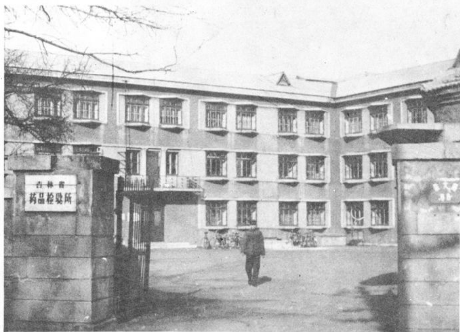
1955年12月，我所由吉林市迁入省会长春， 图为1956年至1985年的实验大楼和正门。