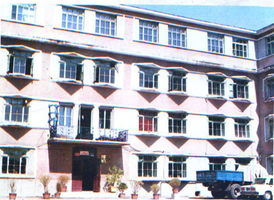
1986年我所将 原实验楼由三层接 为四层，图为增接 改建后的原实验大 楼。