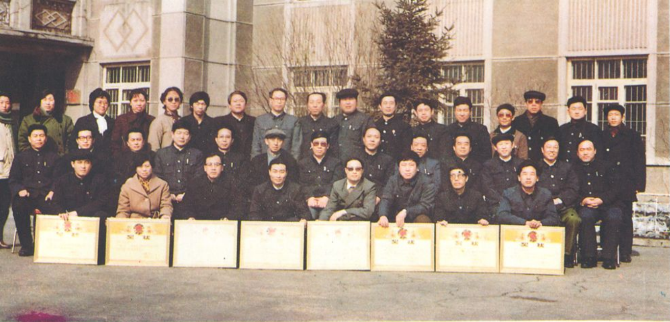
▲1987年度全省药检系统社会主义劳动竞赛活动中八个地、市级药检所均为达标单位。