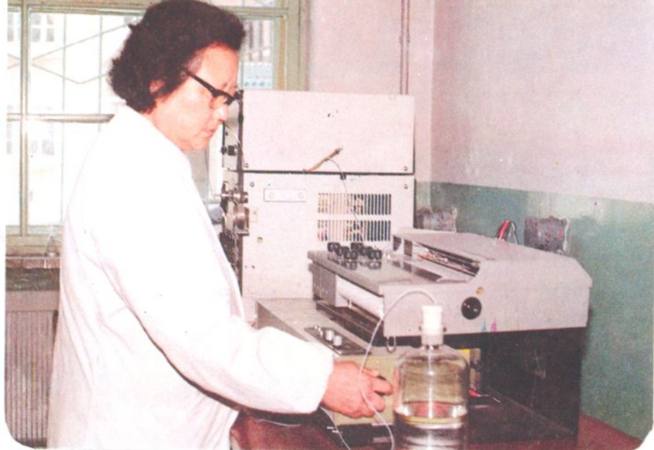
研究室的业务人员正在用高效液相色谱仪探讨复杂成分中维生素E的定量方法。