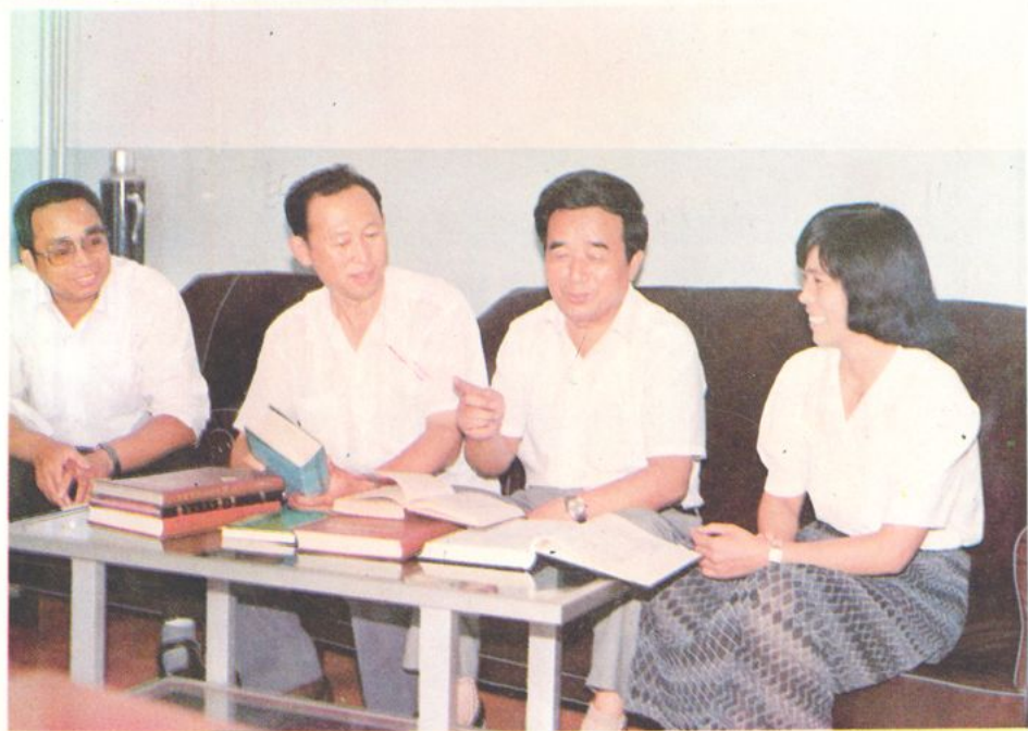
◀在商讨药检工作改革大计的本届所领导班子的。