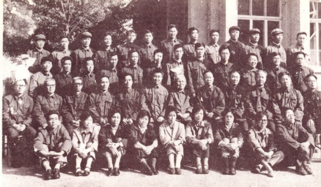
1981年全省首届县(市)药检所长培训班结业留影。