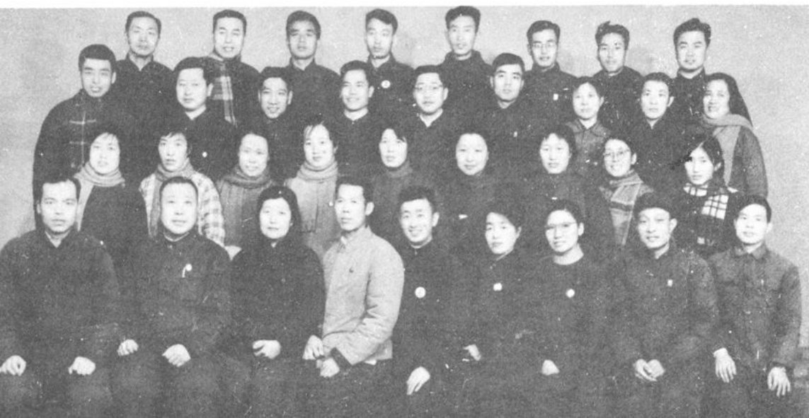
一九六九年全所職工合影。