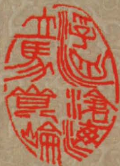
浮舟滄海 立馬昆侖