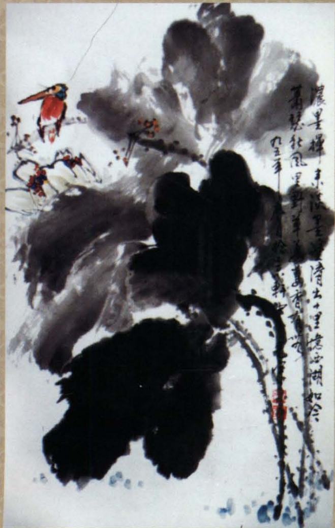
国画 [荷塘清趣] 张光宇 作