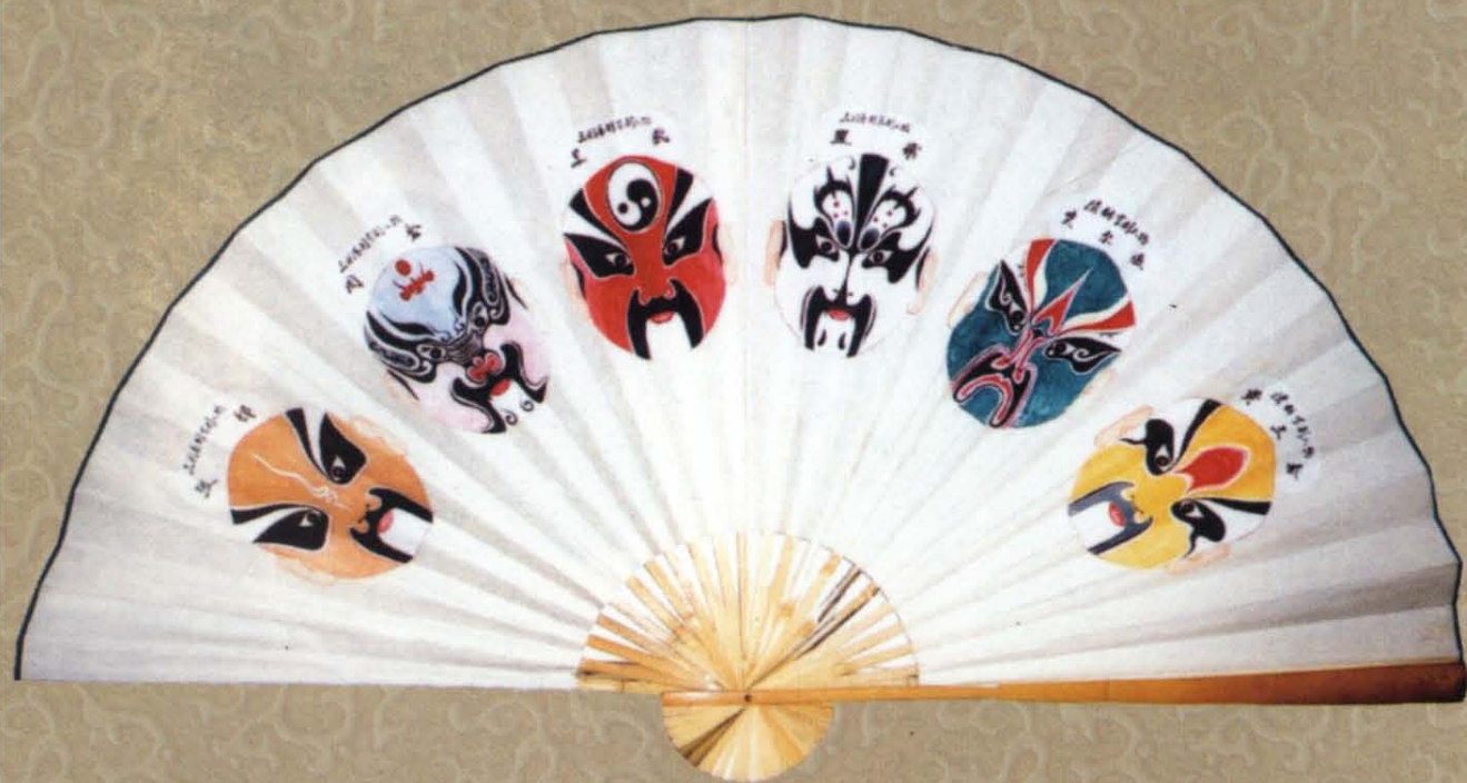
高福增彩绘的扇面京剧脸谱