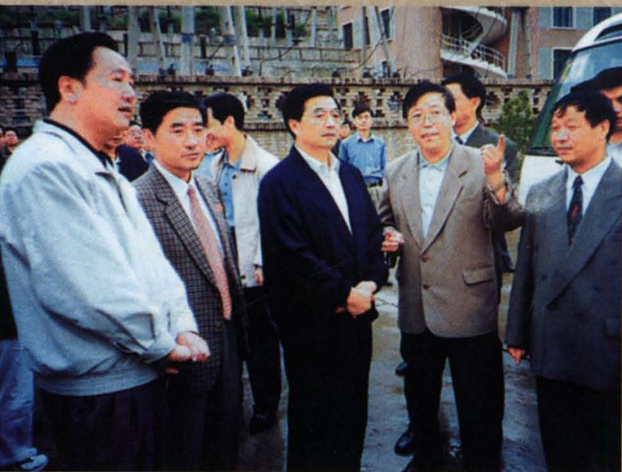
1999年9月11日，胡锦涛同志视察八盘峡水电厂