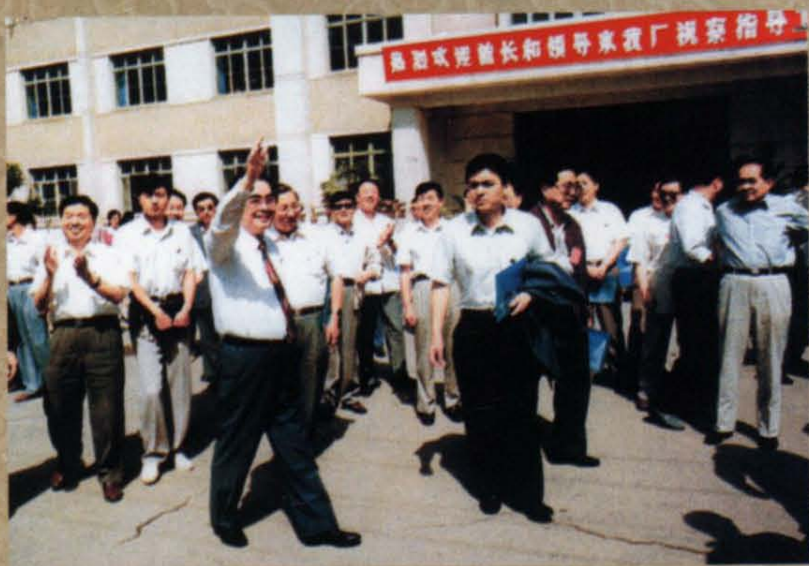
1995年7月25日，李鹏同志视察五〇四厂