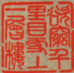
欲窮千里目 更上一層樓