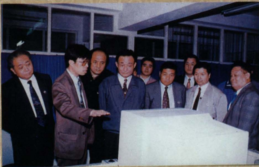
1995年5月7日，吴邦国同志视察兰州三毛纺织集团有限责任公司