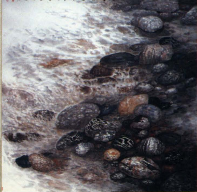
国画 [黄河岸边] 杨德仁 作