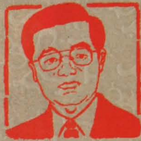
篆刻肖像 [四代领导人] 杨家祺