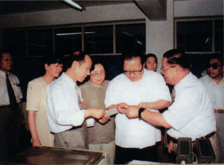
1996年8月18日，乔石同志视察兰州三毛纺织集团有限责任公司