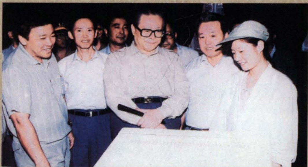
1992年8月，江泽民同志视察兰化