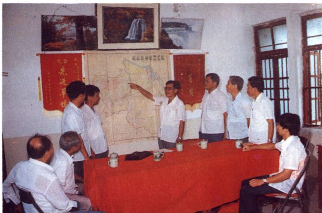
县林业局领导和技术人员在研究林业发展规划。