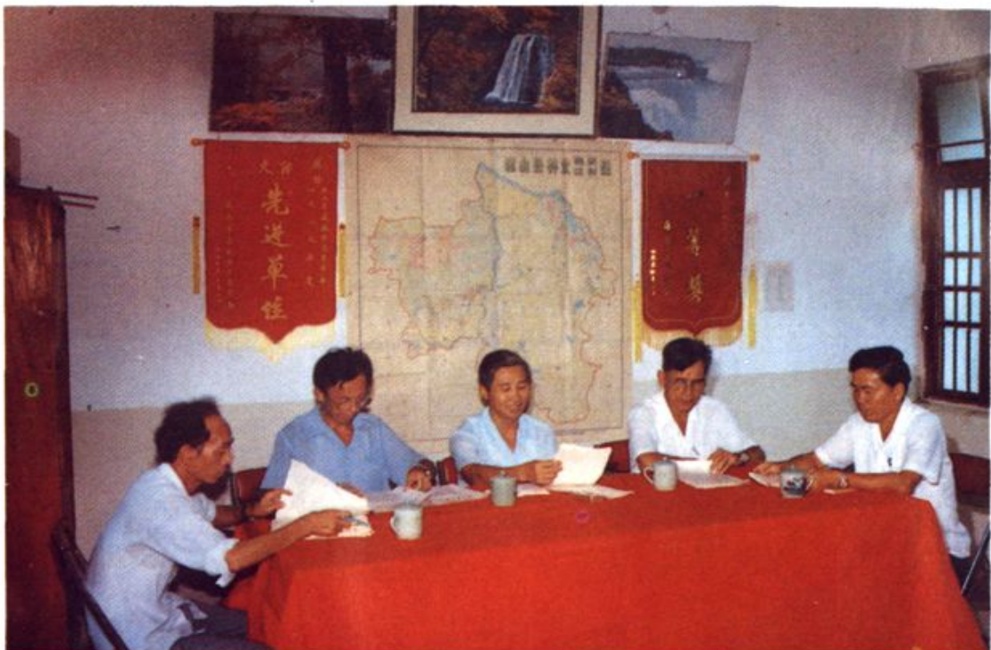
《琼山县林业志》编修成员研究审改志稿。