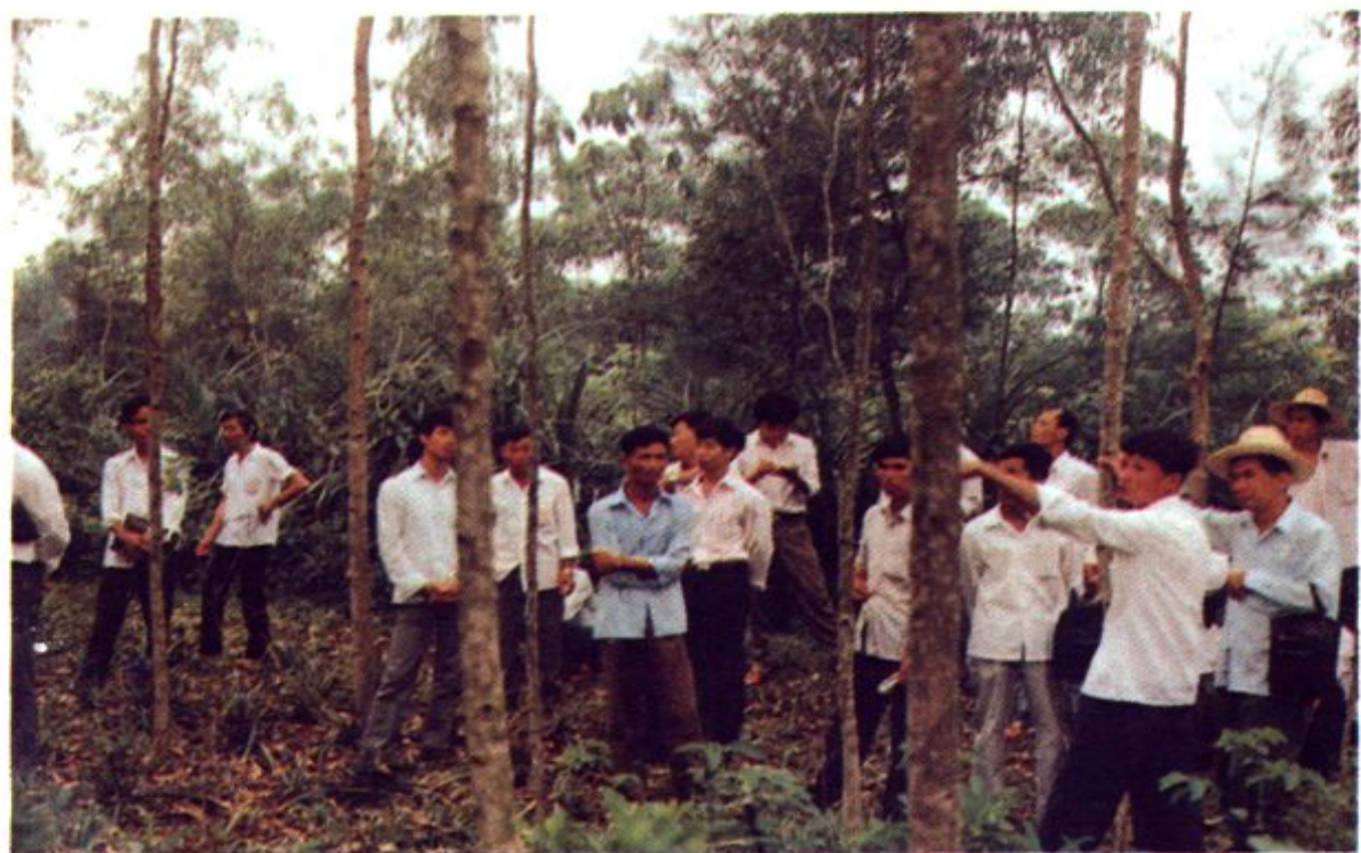
县林业局、乡镇林业站技术人员在大坡镇参观中央速生丰产林。