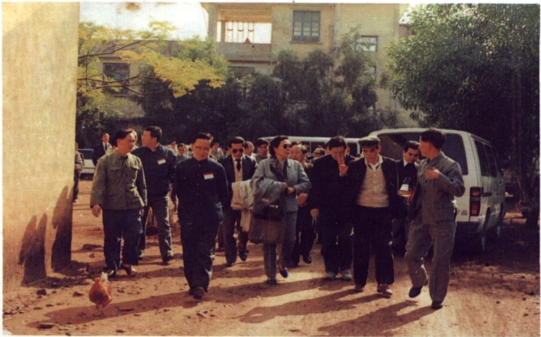
以全国政协副主席钱正英（右四）率领的政协考察团，在中共琼山县委书记林尤芳（右二）陪同下，考察东寨港红树林自然保护区。