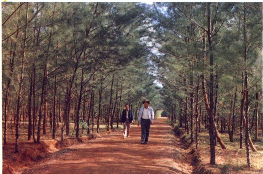
咸来镇乡村道路两旁绿树成荫。