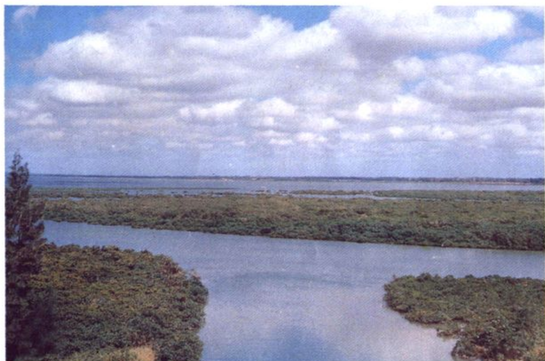
东寨港红树林自然保护区一角。