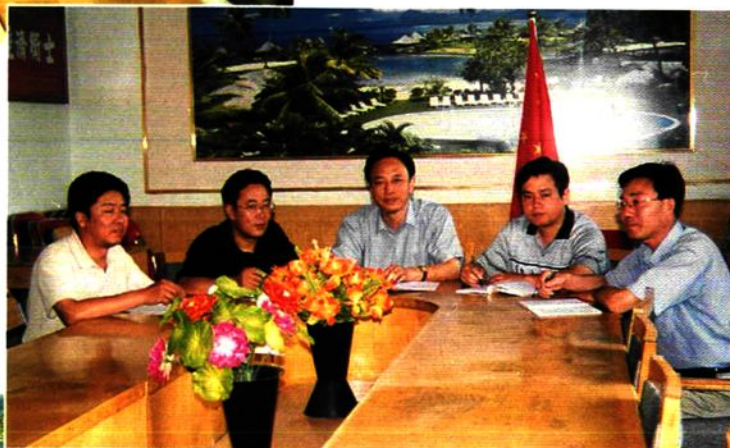
2002年7月石嘴山市审计局领导成员及科级干部研究工作