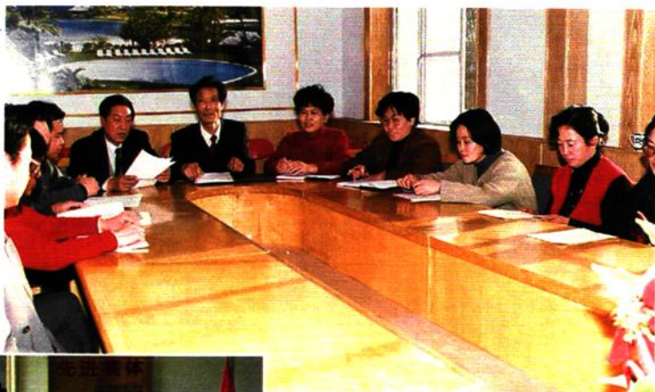
1998年2月石嘴山市审计局领导成员及科级干部研究工作