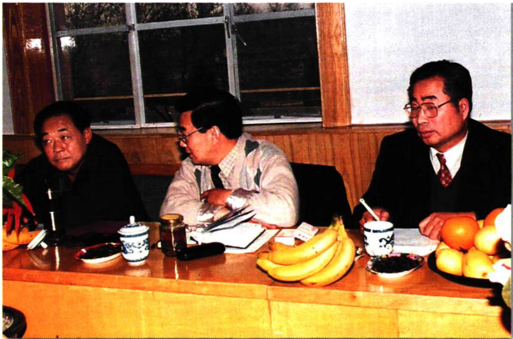
审计长与任启兴副主席(左)亲切交谈