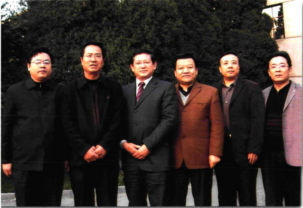
市委书记杨春光、副书记王儒贵与市审计局领导班子合影