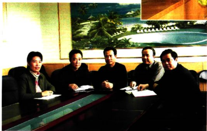
2004年9月石嘴山市审计局领导成员研究工作