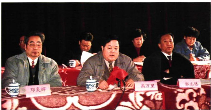
(左一)参加全市审计工作会议 1998年审计厅厅长邓炎辉