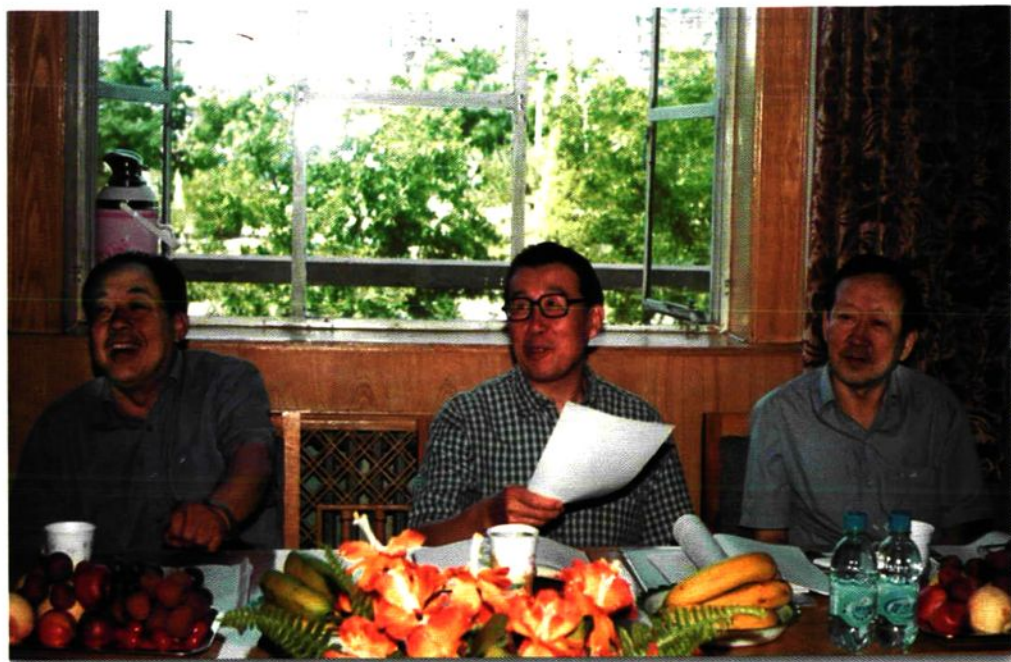
副审计长令狐安(中)和大家亲切交谈