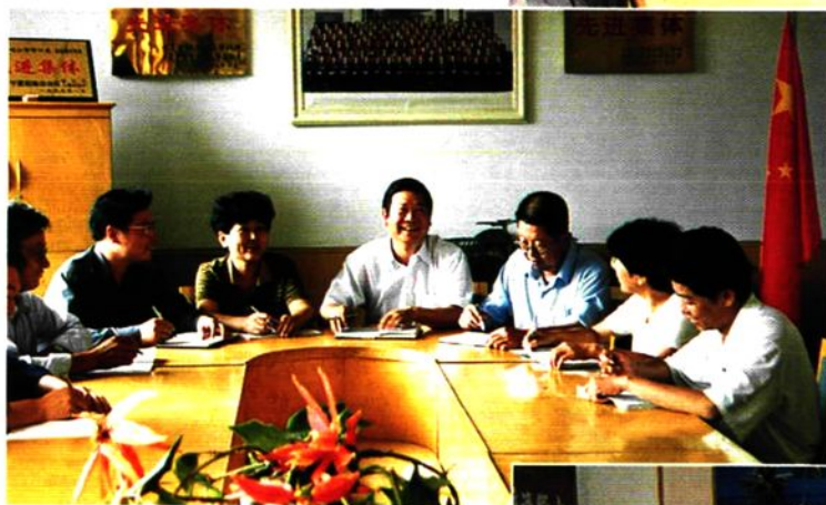
1990年8月石嘴山市审计局领导成员及科级干部研究工作