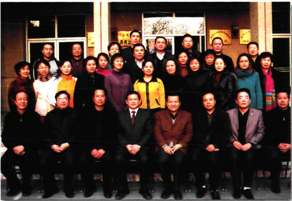
市委领导与全体审计干部合影