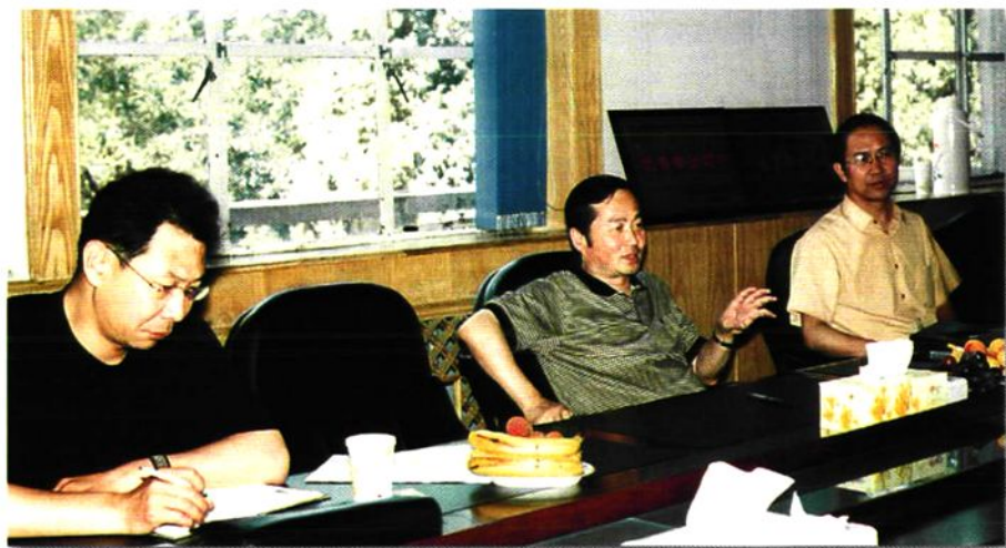
2003年自治区审计厅厅长章建忠(中)在石嘴山市审计局调研