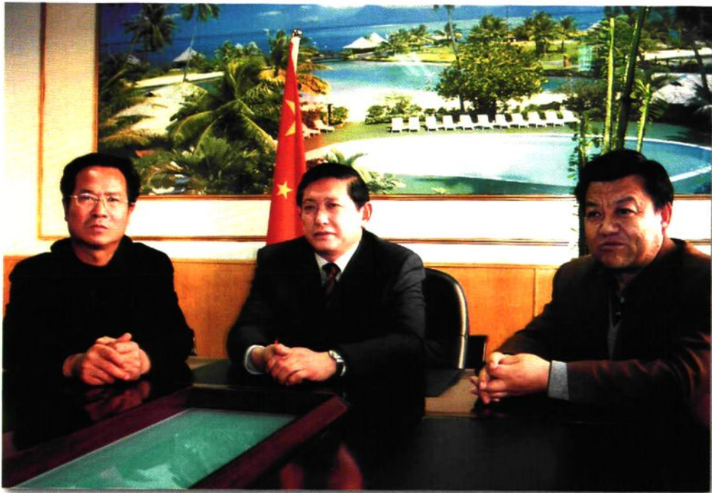
中共石嘴山市委书记杨春光(中)、副书记王儒贵(右)到市审计局调研指导工作