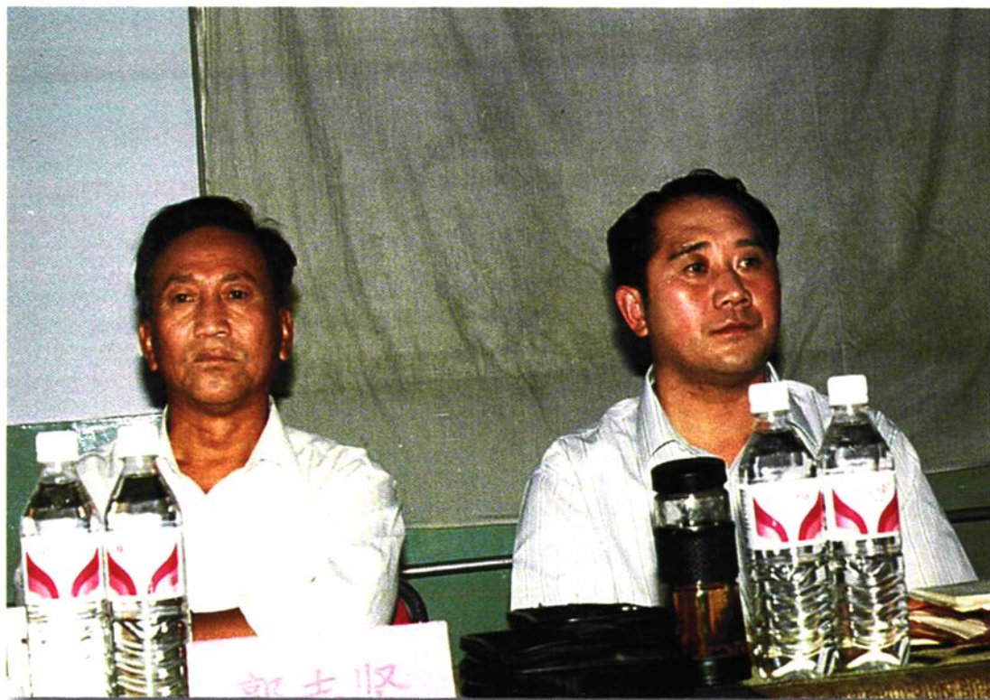
2000年,中共石嘴山市委书记郑小明参加全市审计工作会议