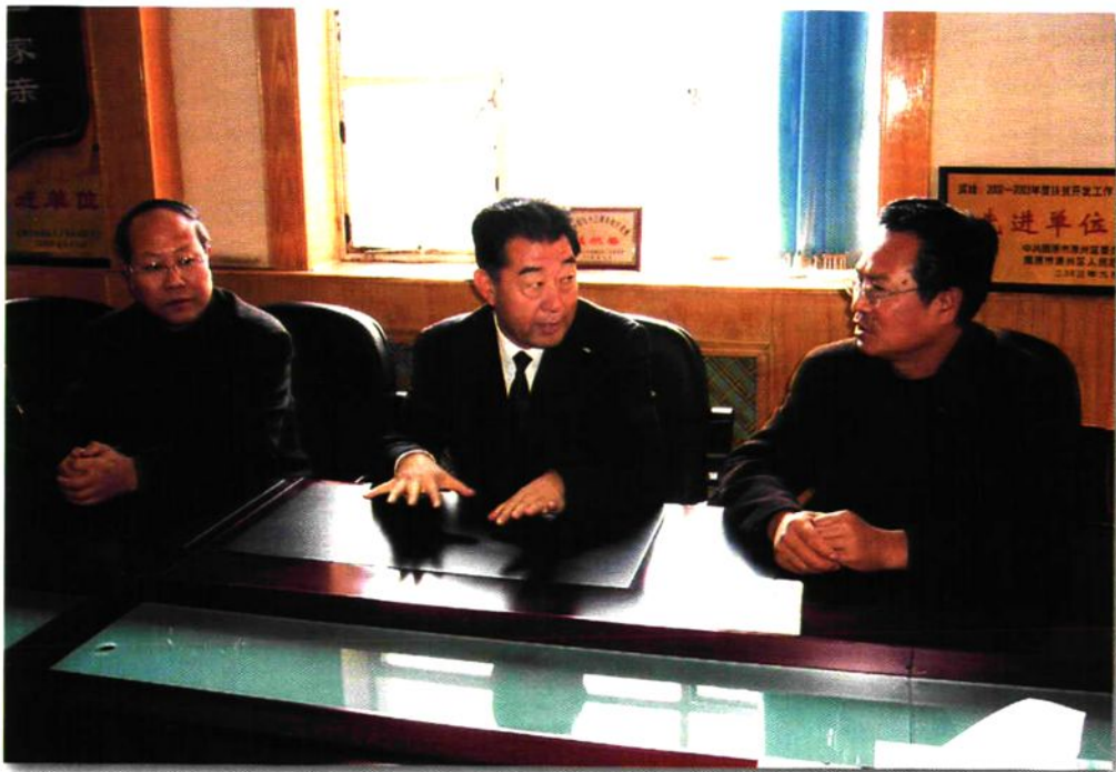
石嘴山市代市长田明(中)、副市长徐占海(左)在市审计局指导工作