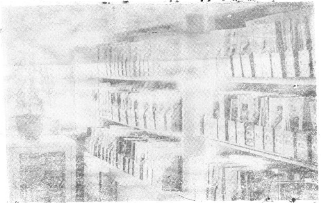
县科委科技情报资料室