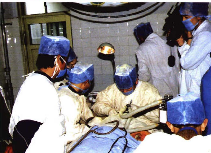
县医院做大型肿瘤切除术