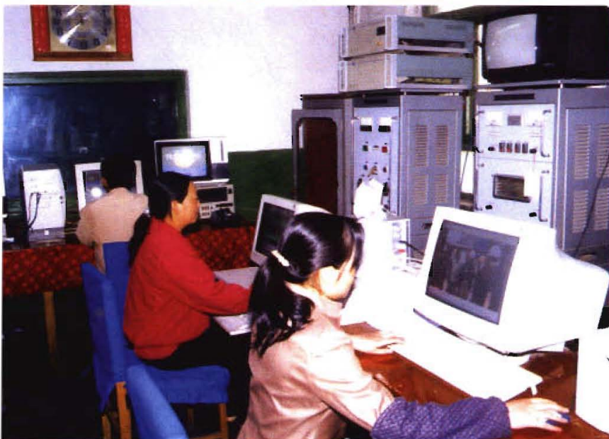
县电视台工作人员在 编辑《化隆新闻》节目