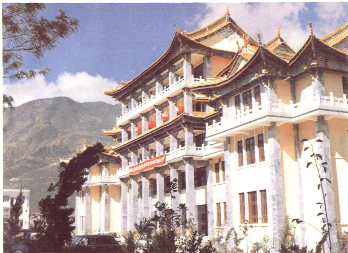
大理白族自治州人大常委会