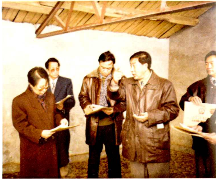
自治区政府主席乌云其木格视察畜牧业种子工程建设并题词