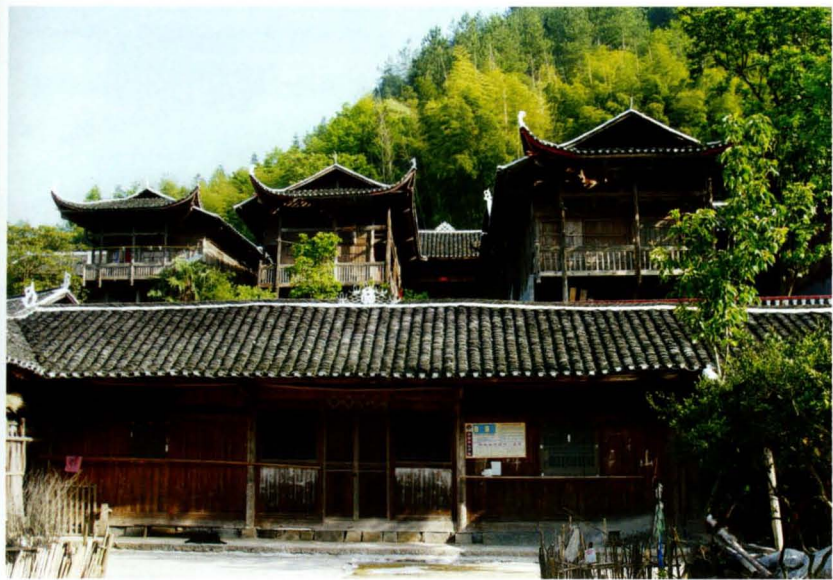
位于沙道沟镇两河村彭家寨的土家特色建筑——吊脚楼群。