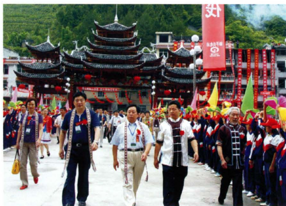
2006年7月22日，省民宗委主任郭大孝（左二）、恩施州长周先旺（左一）参加宣恩长潭河侗族乡20年庆典。