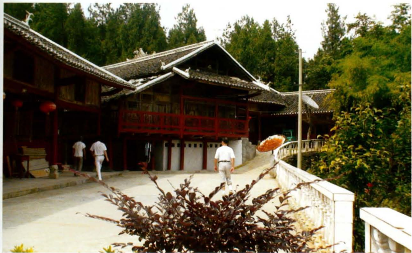
省级民族团结进步示范村——椒园镇黄坪村改造后的特色民居。