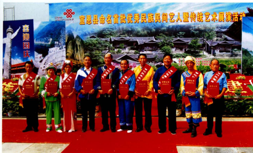
2007年9月26日宣恩县人民政府命名的第一批10名优秀民族民间艺人合影。