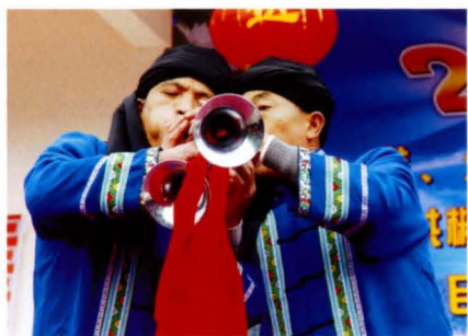
民间绝艺——双人喷呐。