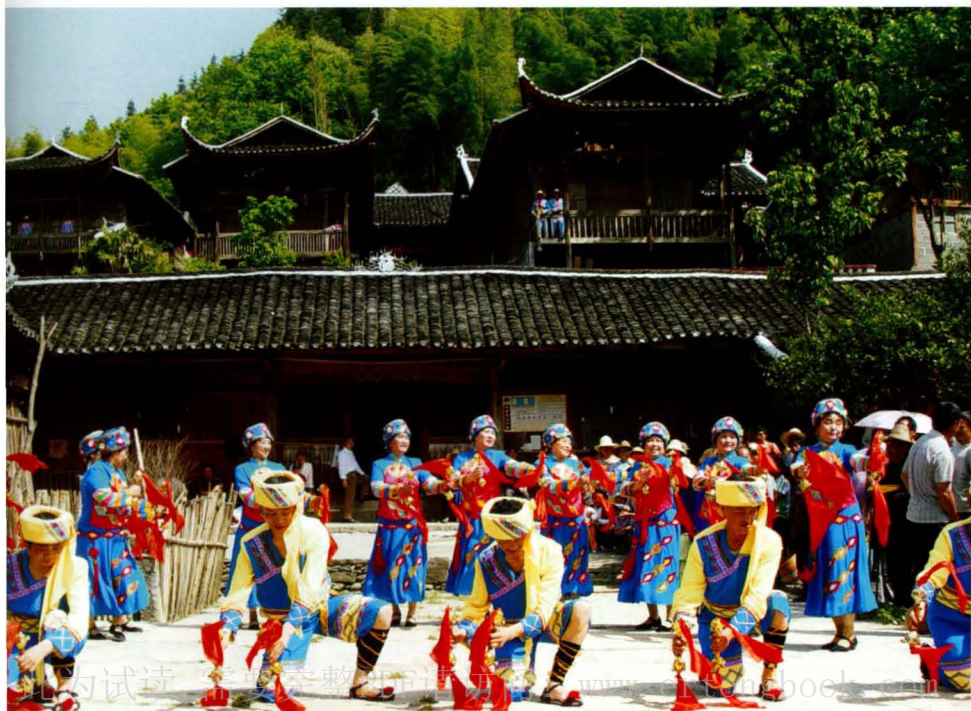
彭家寨民族文艺活动蓬勃开展。