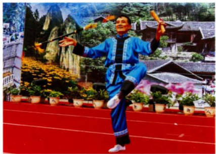
民间绝艺——滚龙莲湘。