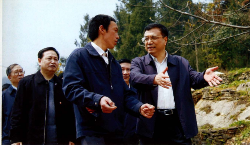
2008年4月6日，李克强副总理视察宣恩椒园黄坪新农村建设。