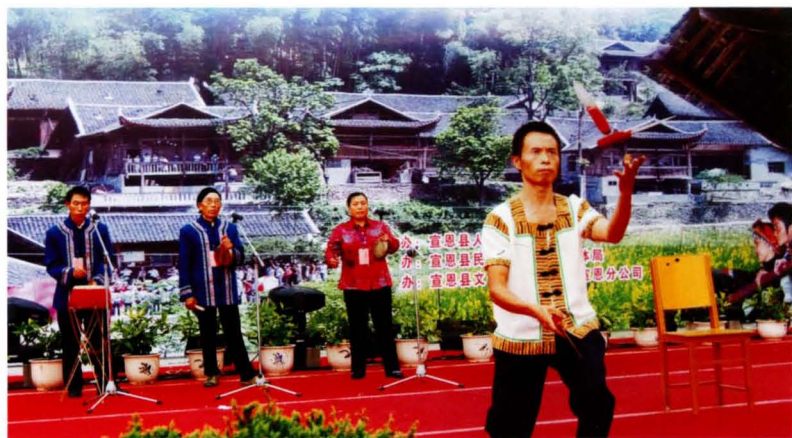
民间绝艺——三棒鼓杂耍。