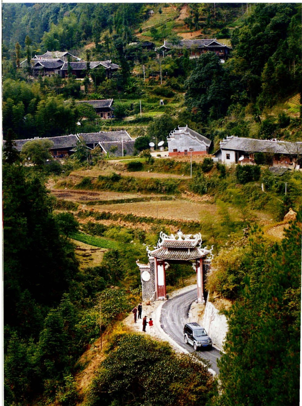
省级民族团结进步示范村——高罗小茅坡营村改造后新面貌一角。