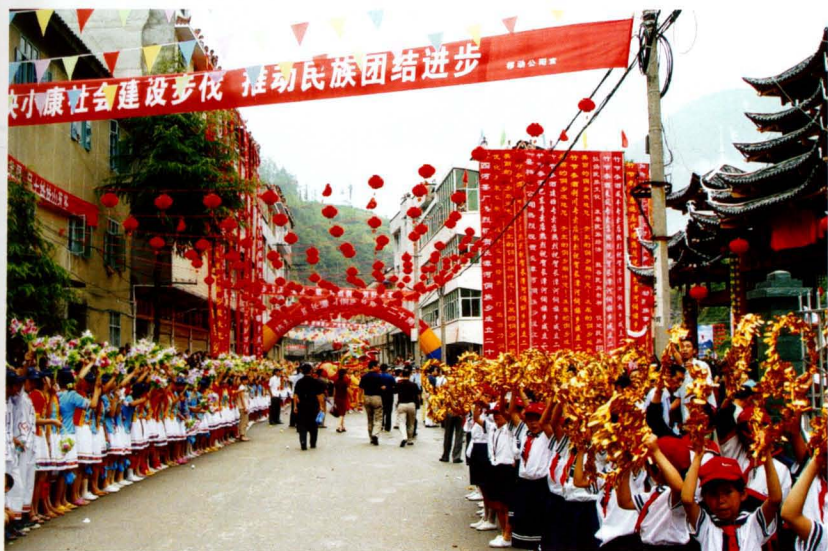
2007年7月1日长潭河侗族乡20年庆典活动。