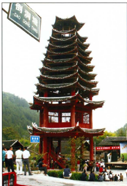
晓关倒洞塘鼓楼。