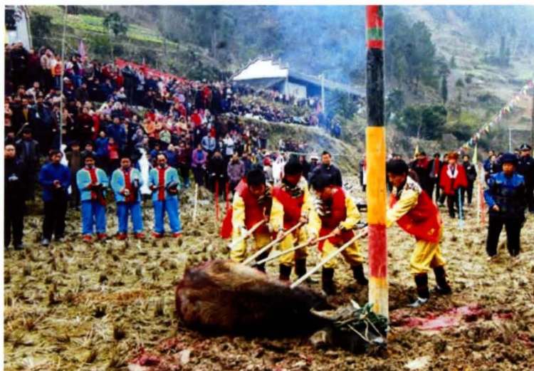
苗族椎牛。