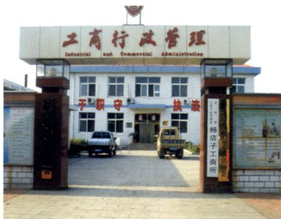
2001年建成的 杨店子工商所