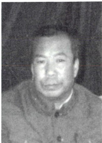
迁安县工商行政管理局