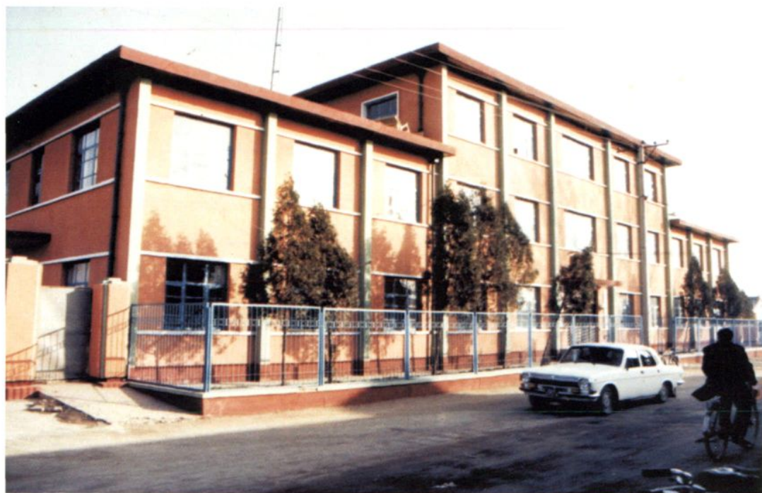
1980年落成使用的迁安县工商行政 管理局办公楼