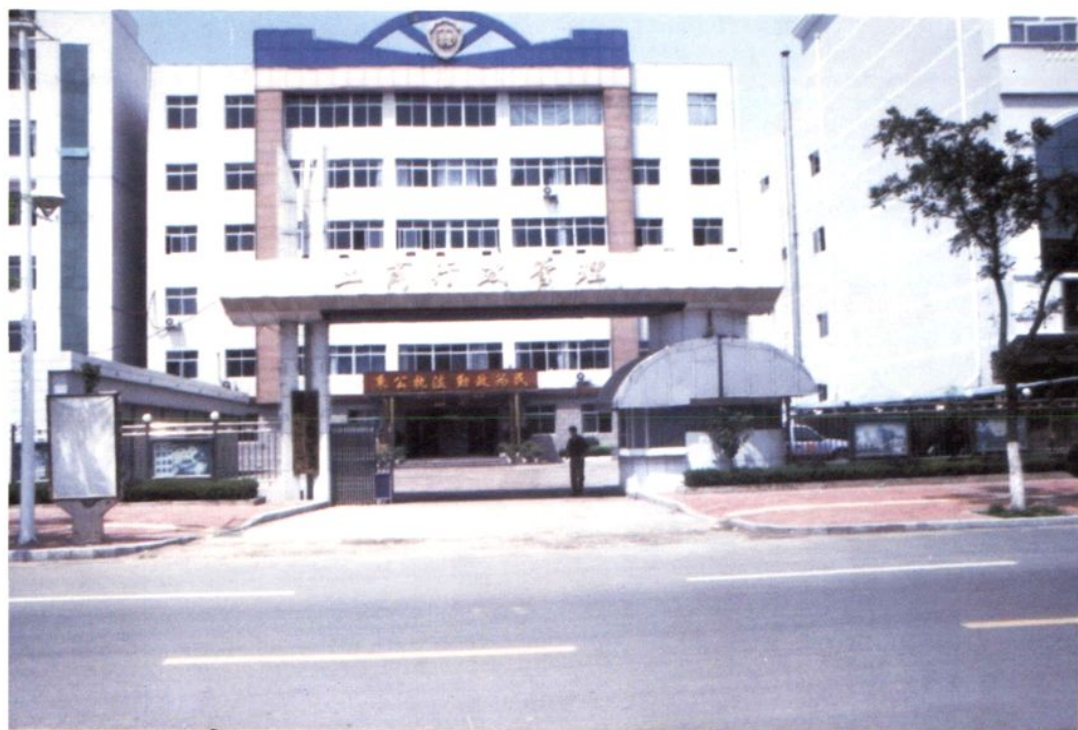
2000年落成使用的迁安市工商行政 管理局办公楼