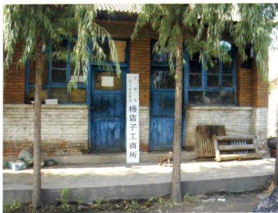
1984年以前杨店子 工商所旧址