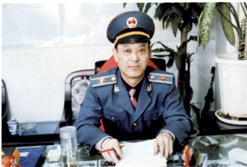
迁安县（市）工商行政管理局局长