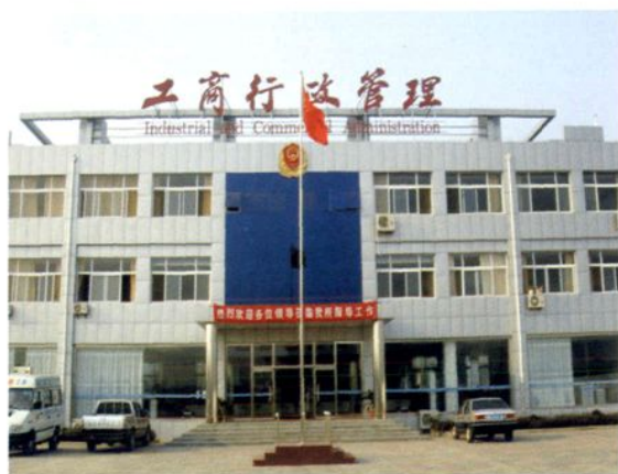
2006年新建全省一流 杨店子工商所