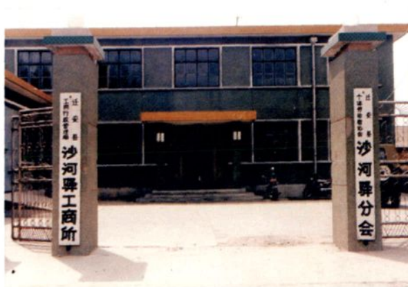
2003年以前的工商所旧址