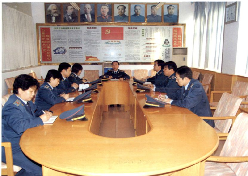
工商局领导班子会议