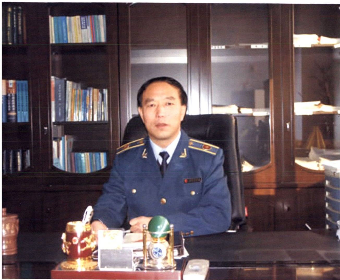
迁安市工商行政管理局局长