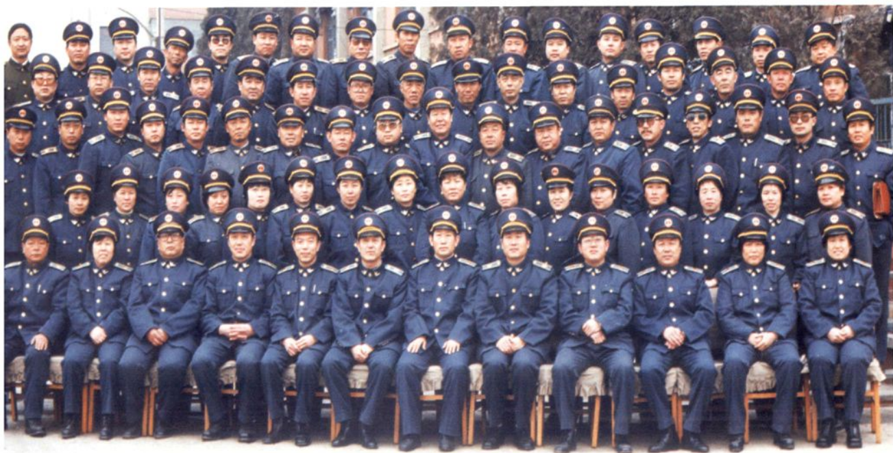
工商行政管理机构改革前，迁安工商局股级以上干部合影