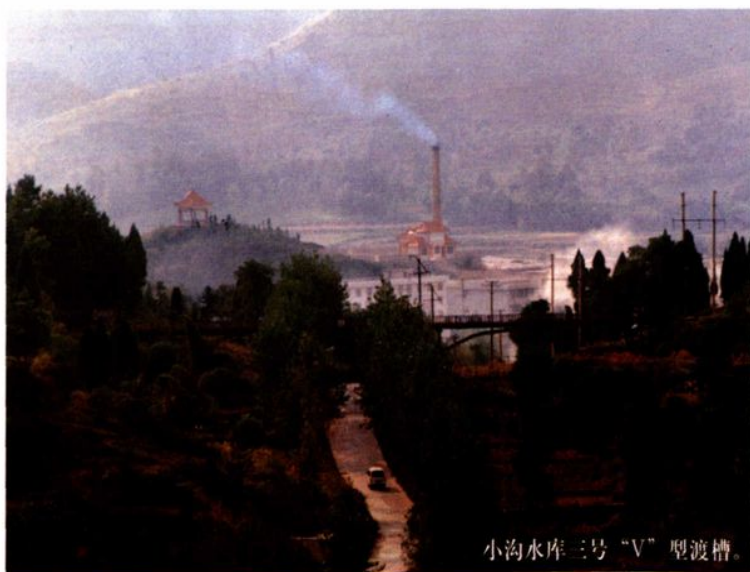
小沟水库三号“V”型渡槽。