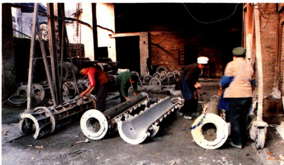
德江县水电水泥制品厂电杆生产车间