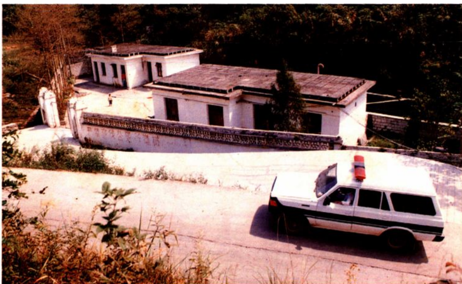
德江县潮水河抽水泵房