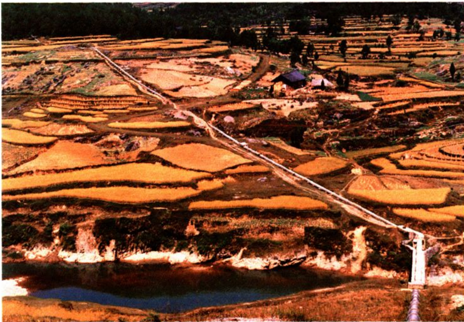
明溪水库红恩塘钢筋 混凝土预制倒虹管