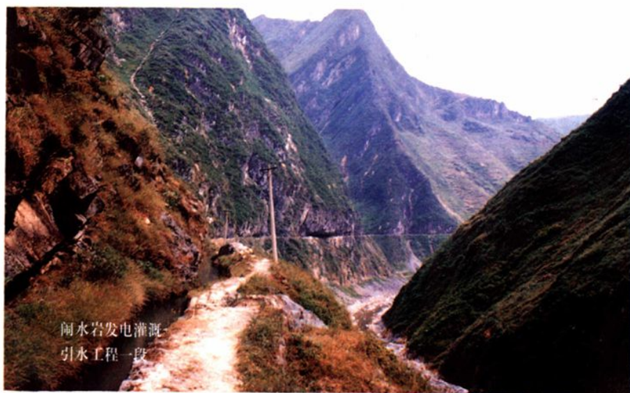
闹水岩发电灌溉 引水工程一段