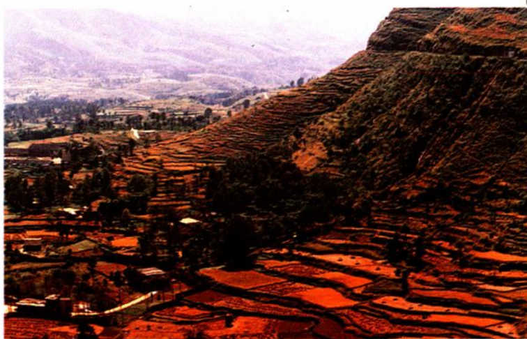
南水岩二级灌溉水力发电站