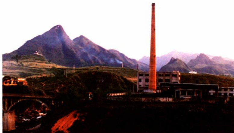
德江县桐子坪火电厂