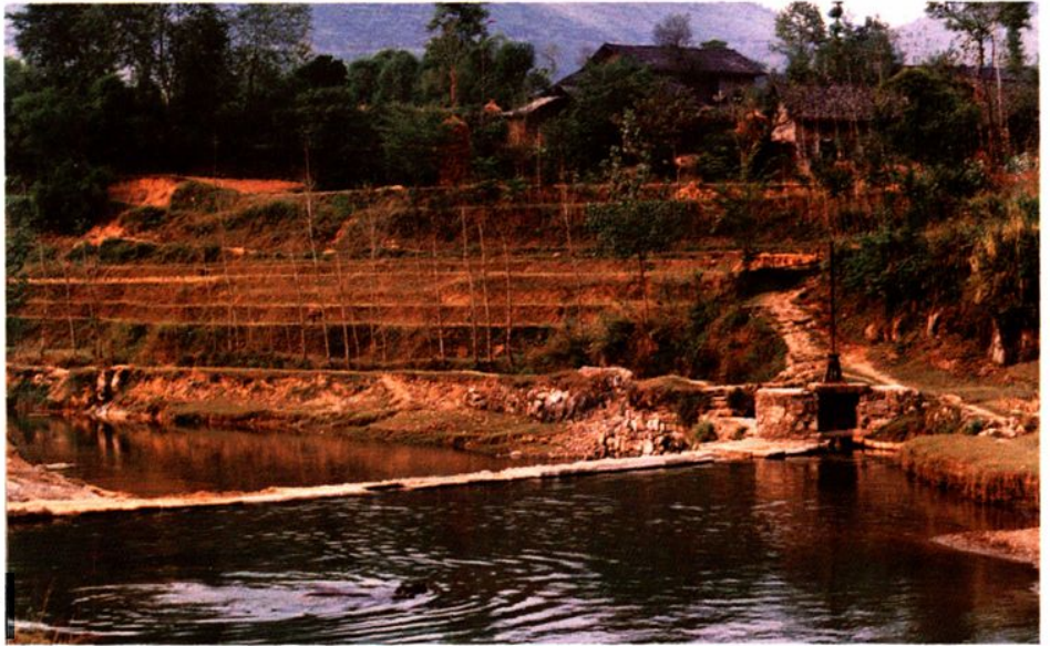
大龙阡引水工程渠道