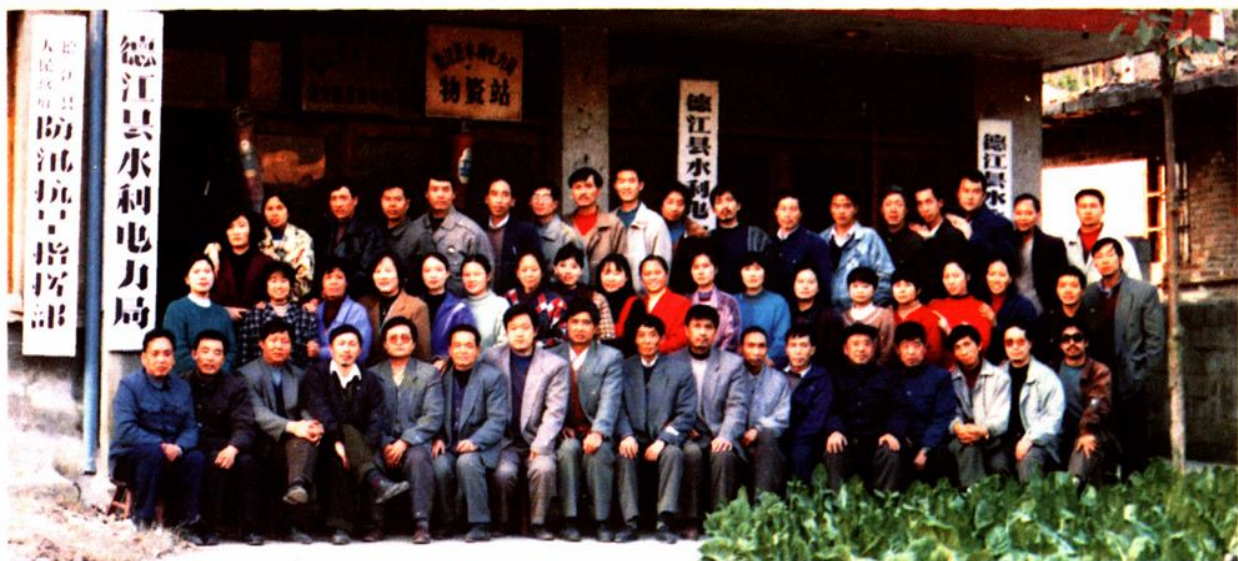
德江县水利电力局1996年副股级以上干部合影