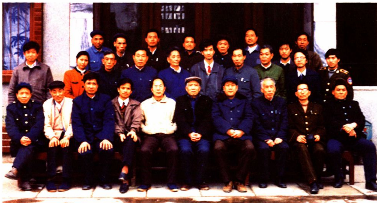
1992年3月17日19日,《德江县水利电力志》初稿评审会全体人员合影。