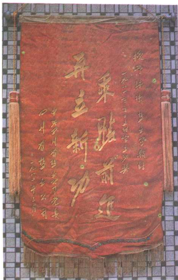
一九八一年获省百日立功先进单位奖状锦旗