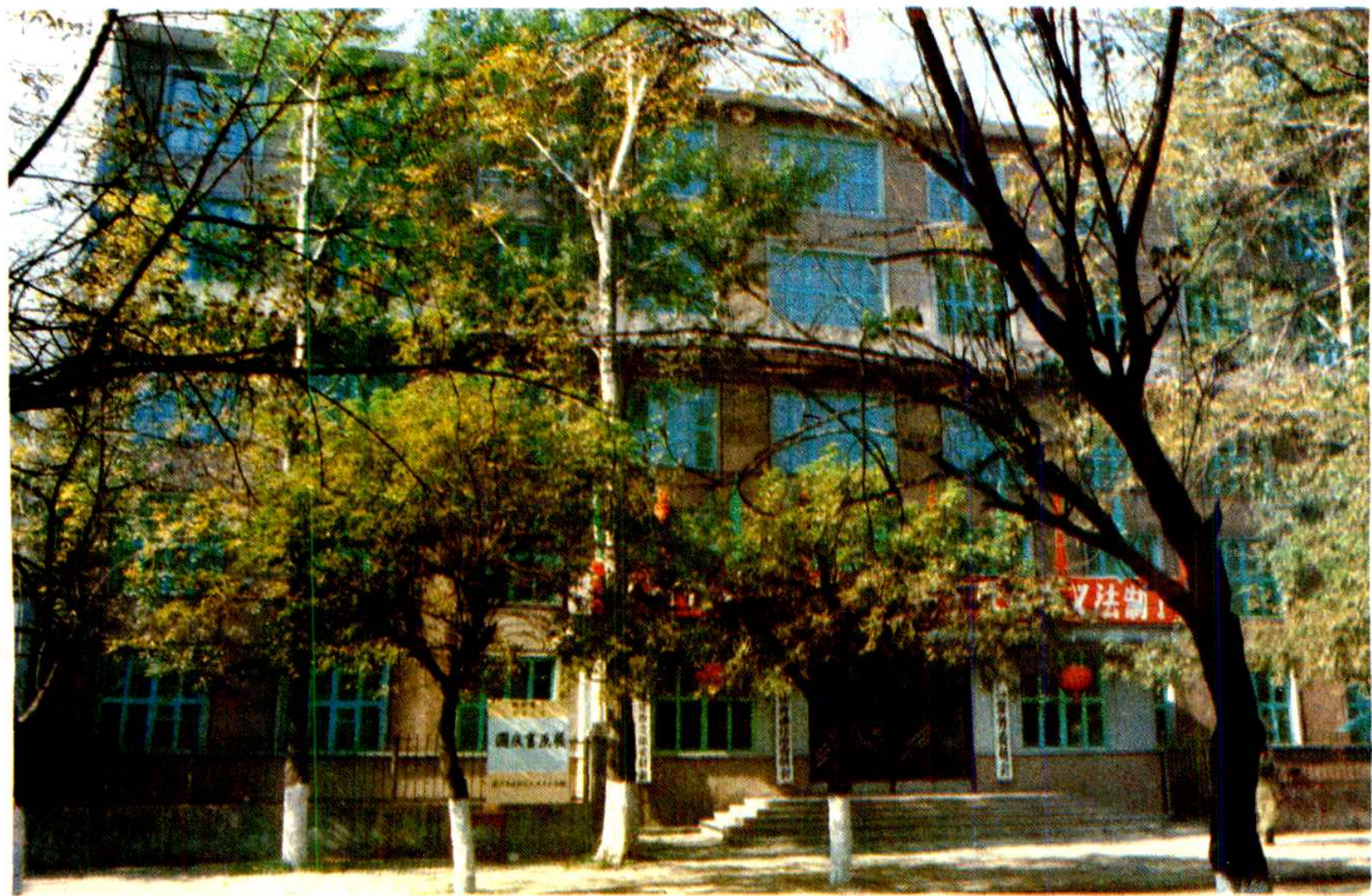
通化市人大，通化市政协办公楼