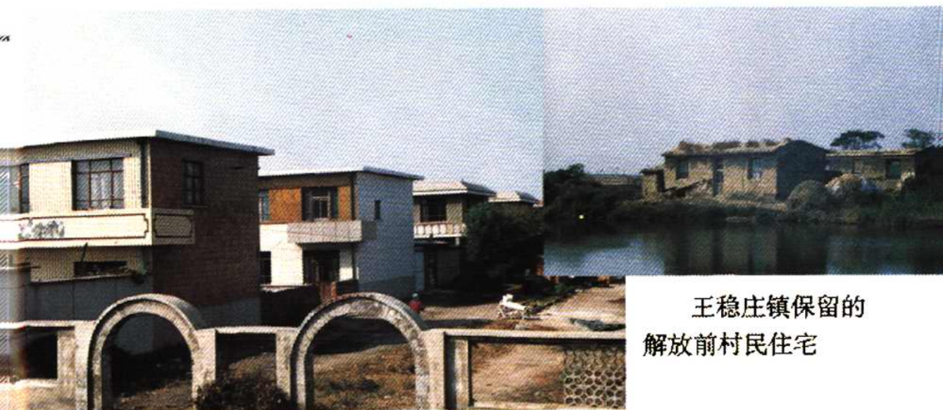
王稳庄镇保留的解放前村民住宅