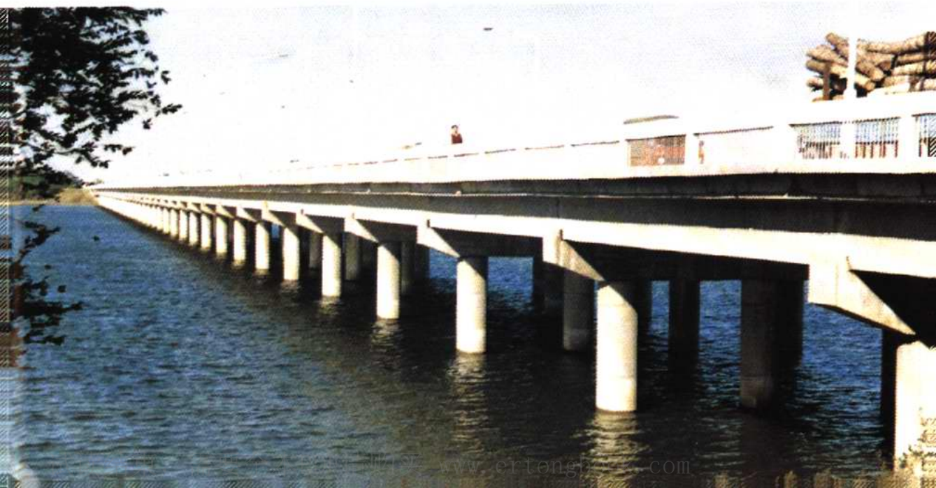
独流减河西流域大桥