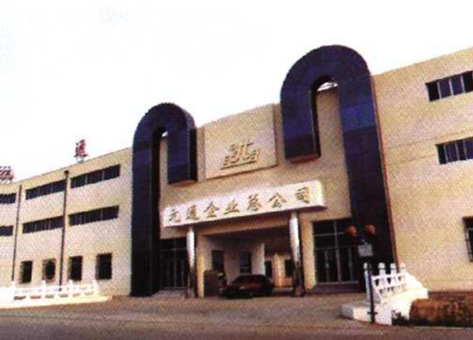
杨柳青镇东桑园村元通企业总公司