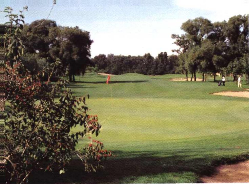
杨柳青镇高尔夫球场