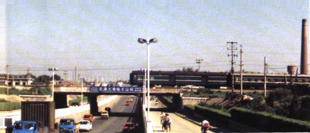
津同公路铁路立交桥