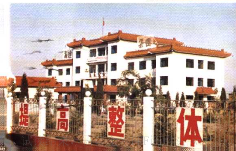
辛口镇水高庄村委会