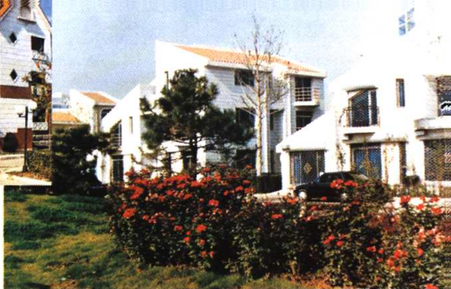
别具一格的别墅住宅小区