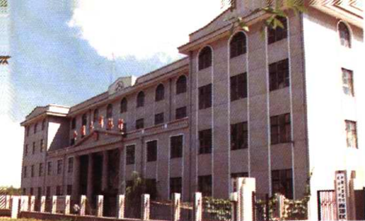
西青区杨柳青镇工商银行