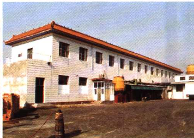
辛口镇水高庄冷冻厂