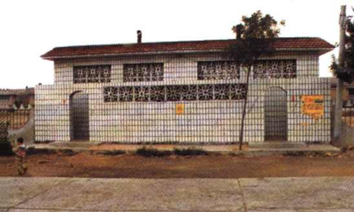
李七庄街于台村公厕