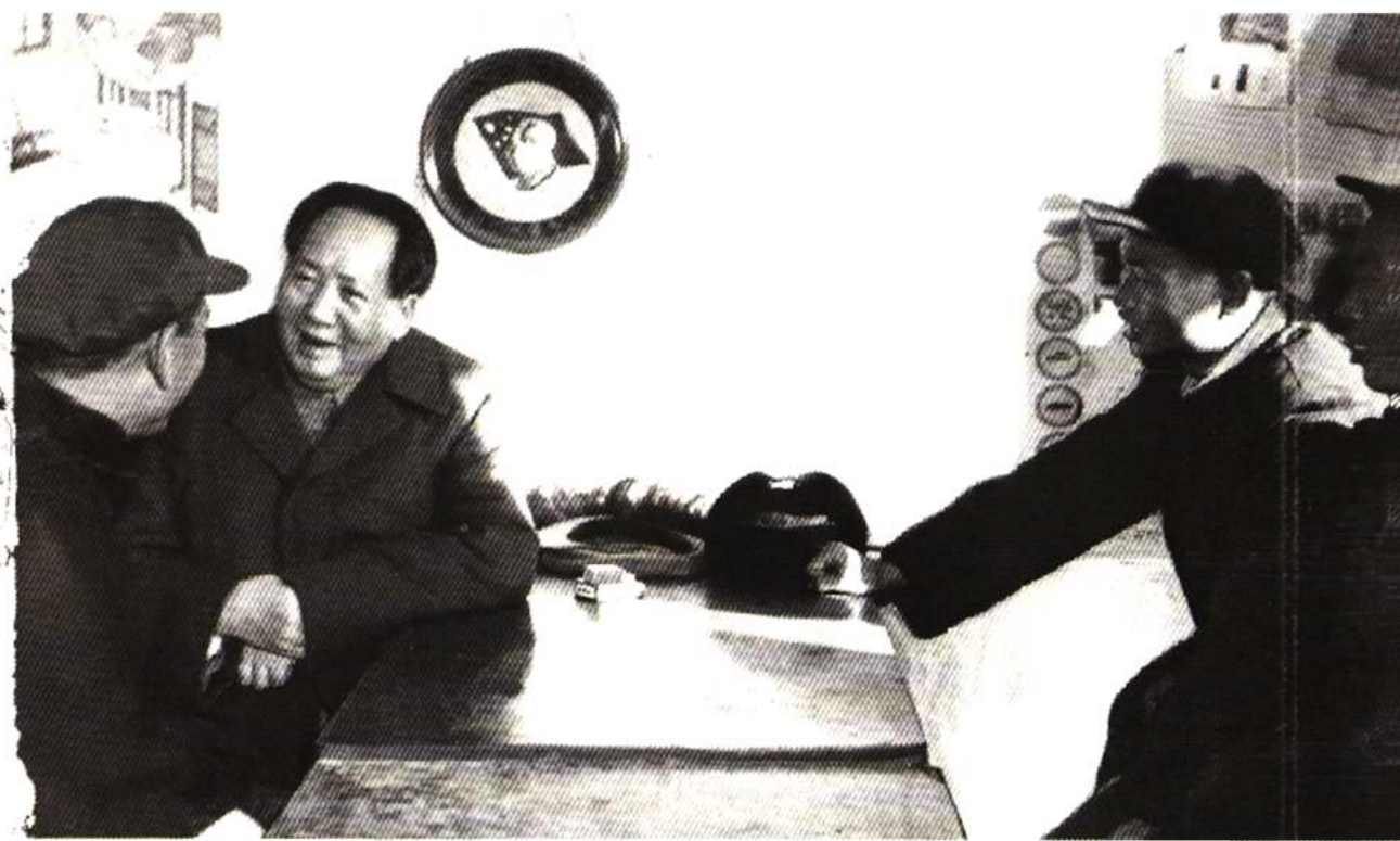
1956年1月12日毛泽东主席视察王顶堤村时与群众亲切交谈