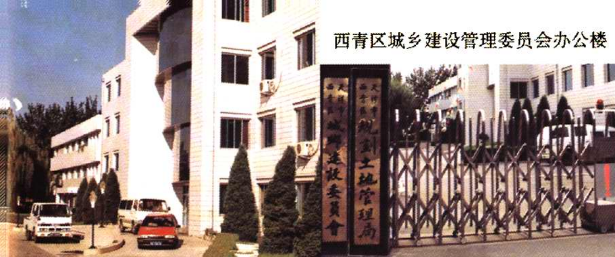
西青区城乡建设管理委员会办公楼