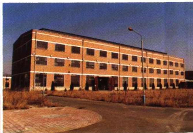
中北镇谢庄恒兴集团厂房