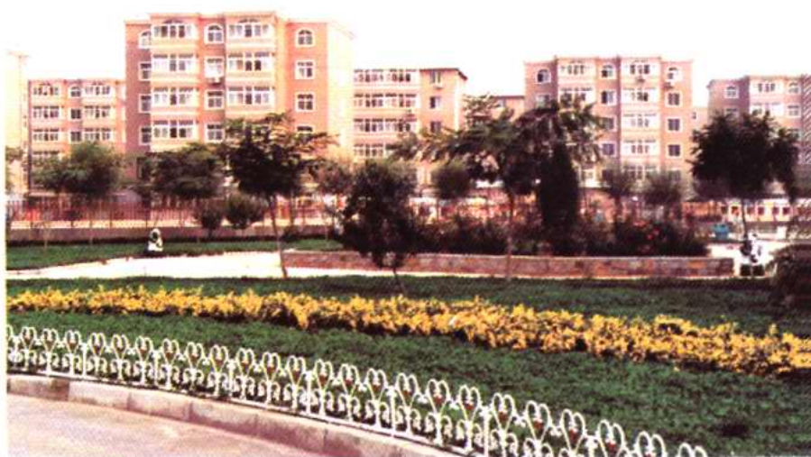
90年代大寺 镇居民住宅楼