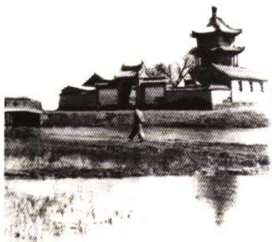
摄于 30 年代初的文昌阁