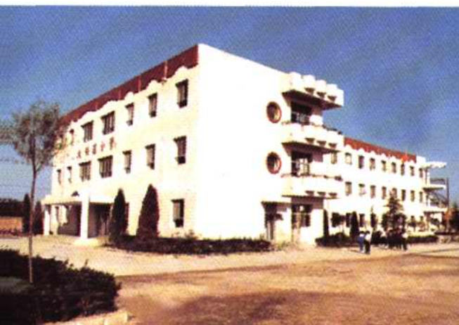
大寺镇大任庄小学