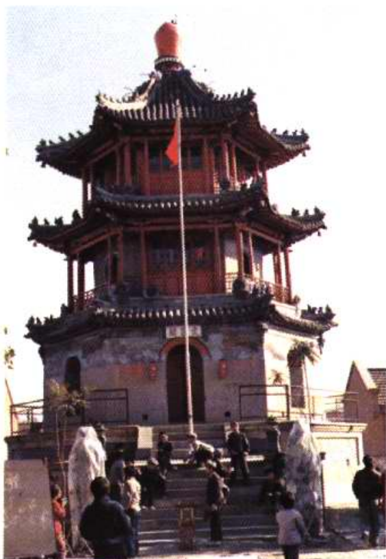
杨柳青镇文昌阁今貌