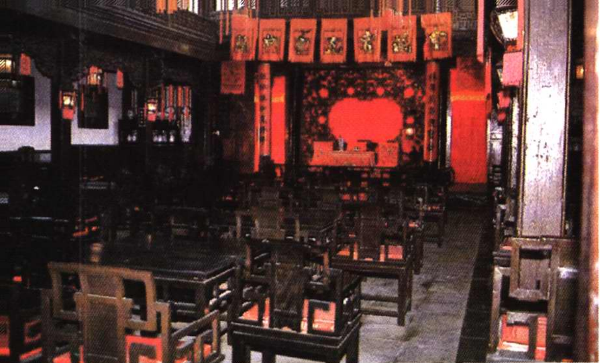
清代民宅、现杨柳青博物馆内石府戏楼