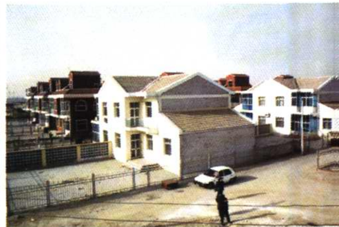
张家窝镇别墅式农民住宅