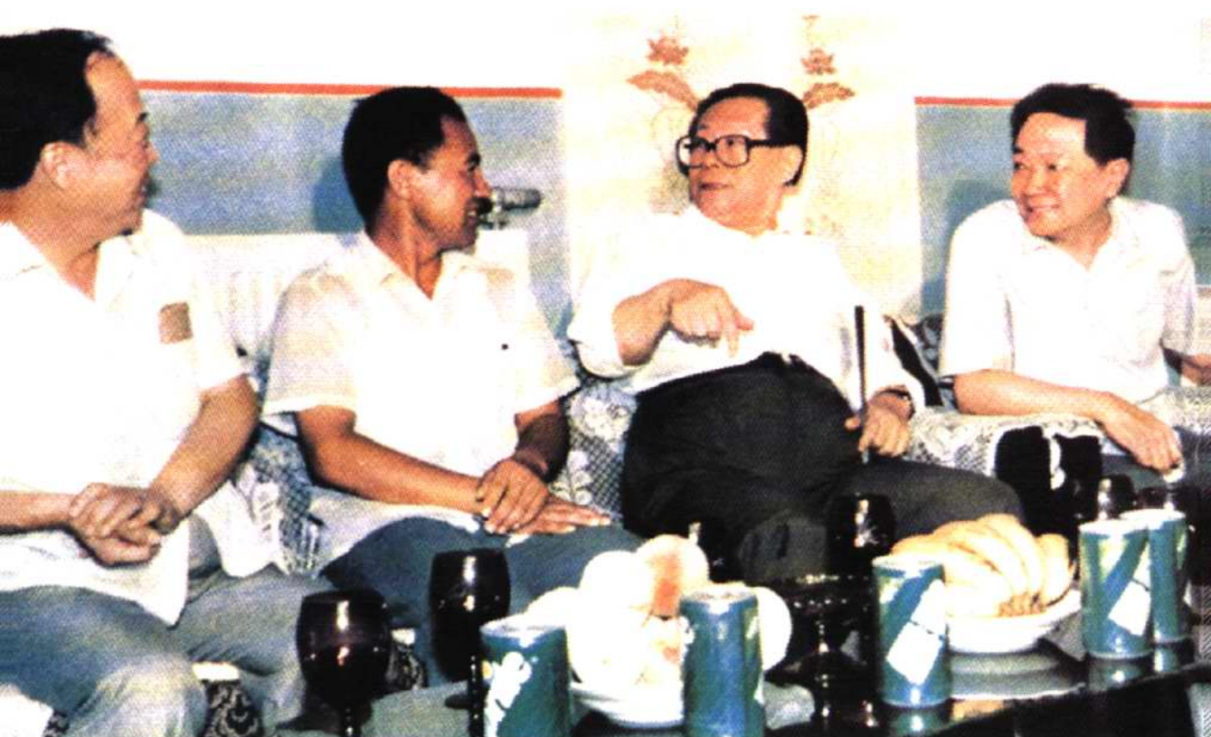
1991年7月28日国家主席江泽民视察小南河村