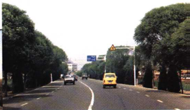
京福公路西青区段