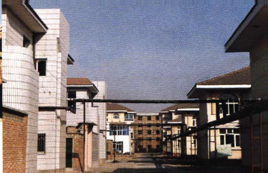
辛口镇第六埠村住宅小区