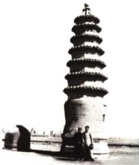
摄于 30 年代初的杨柳青镇普亮宝塔