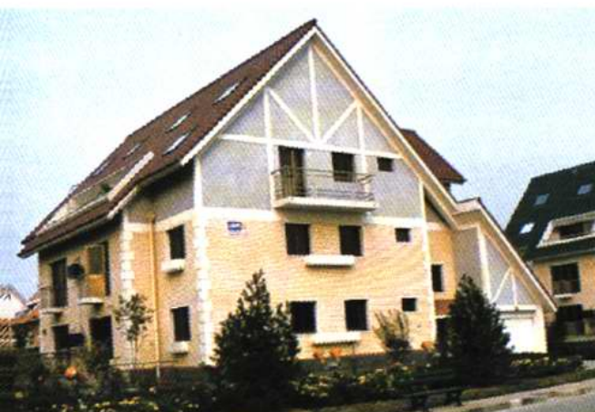
中北镇西姜井村西苑别墅住宅