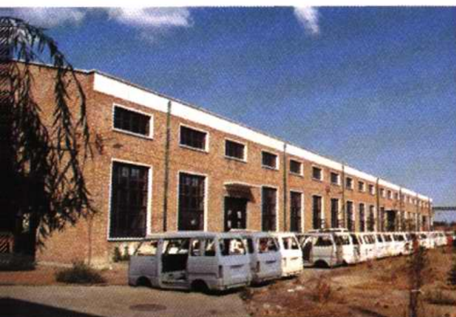
中北镇汽车制造车间