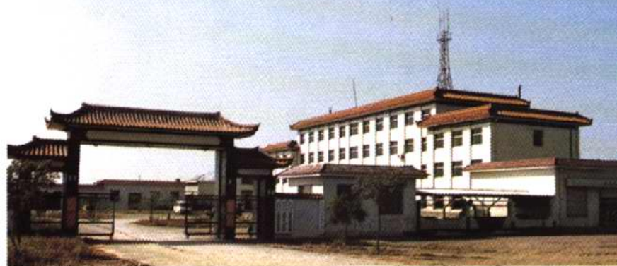
王稳庄镇政府大楼