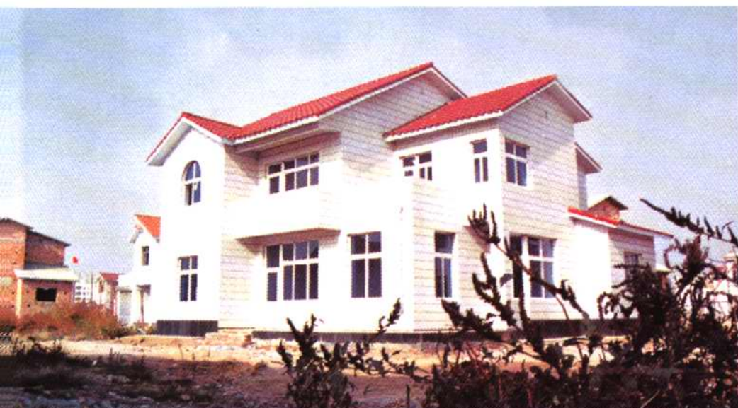
大寺 镇贾庄子 村别墅式 村民住宅