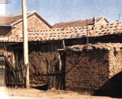
辛口镇现保留的解放前村民住宅