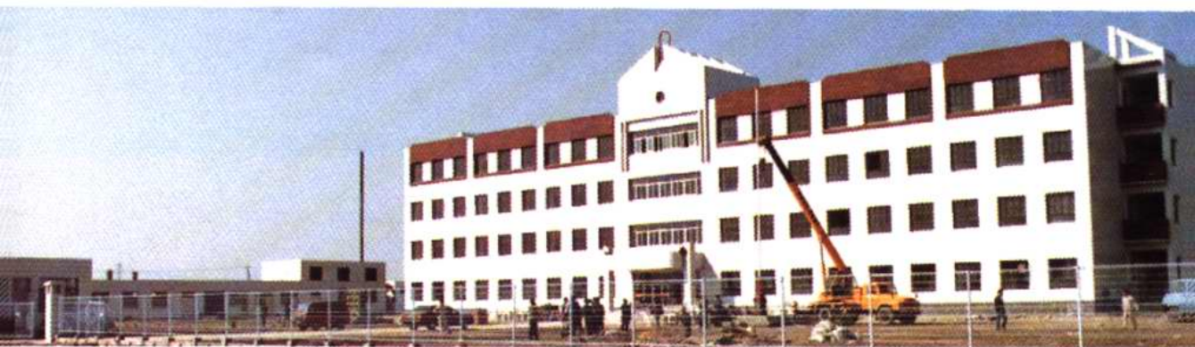
王稳庄中学教学楼