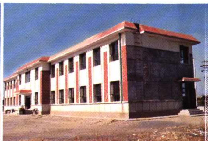
王稳庄镇二侯庄小学