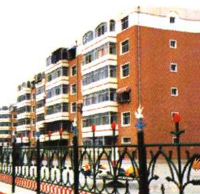
张家窝镇住宅小区