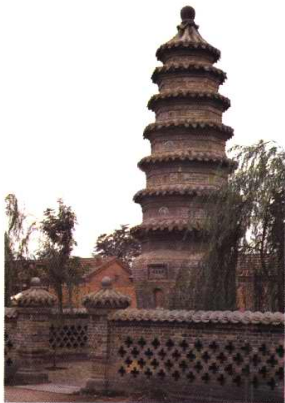
1988 年修复后的杨柳青镇普亮宝塔