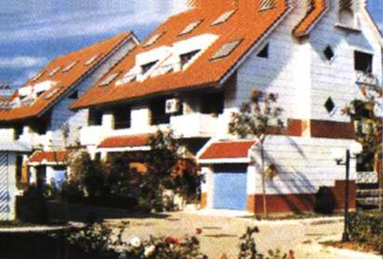
宁家房子别墅住宅