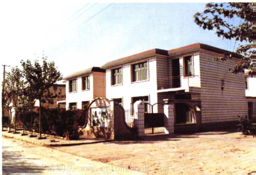
大寺镇 大寺村农民 住宅楼