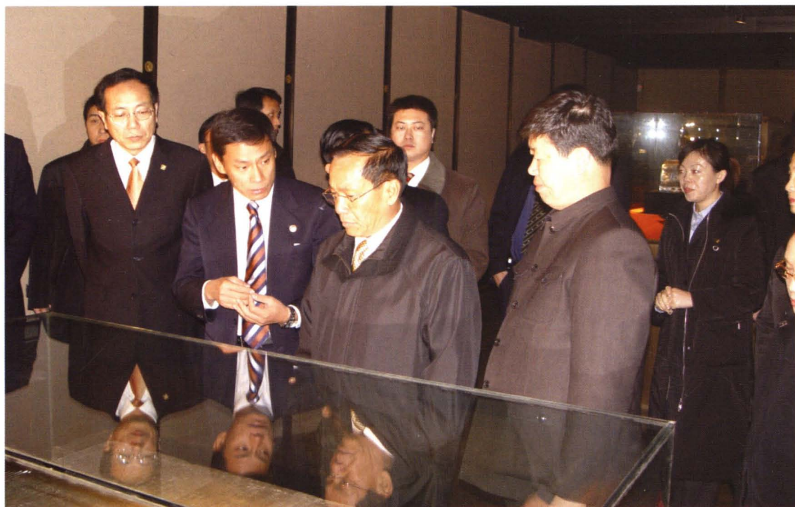
缅甸总理索温在法门寺