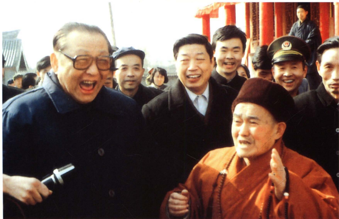
习仲勋同志来扶风法门寺。