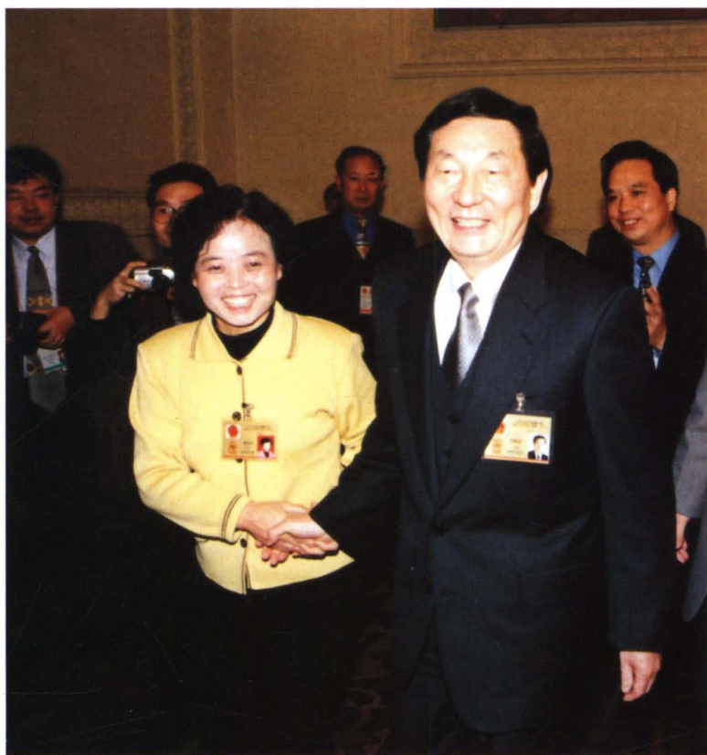
1998年3月，在九届全国人民代表大会上，朱镕基同志与扶风籍宝鸡市全国人大代表曹莲芝握手。