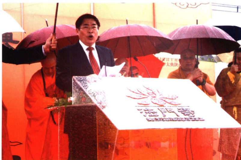
省长袁纯清同志在法 门寺佛指舍利安奉大典上 致辞