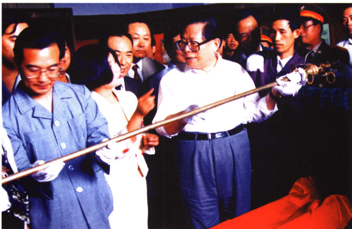
1993年6月，江泽民同志和温家宝同志来扶风视察并参观法门寺