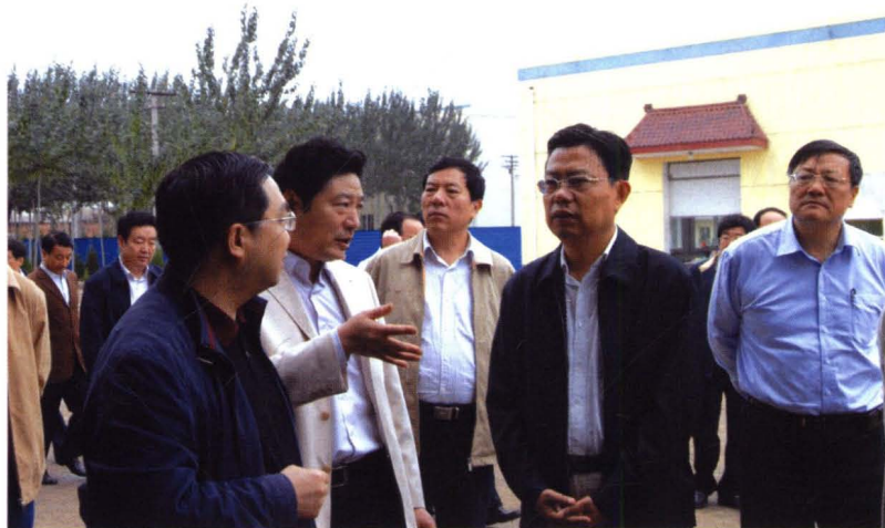
省委书记赵乐际同志 (右二)来扶风视察工作