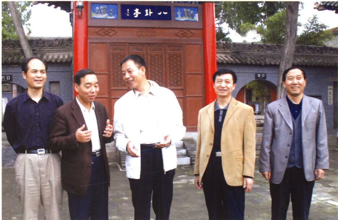
人大常委会主任梁宗建（中）调研文化文物工作