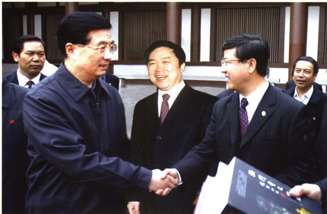
2004年4月11日，中共中央总书记、国家主席、中央军委主席胡锦涛同志来扶风视察