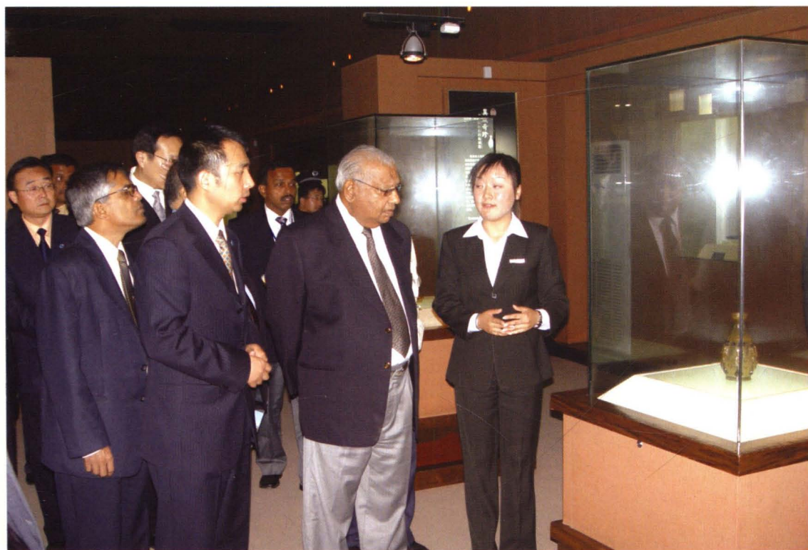
毛里求斯副总统班敦在法门寺