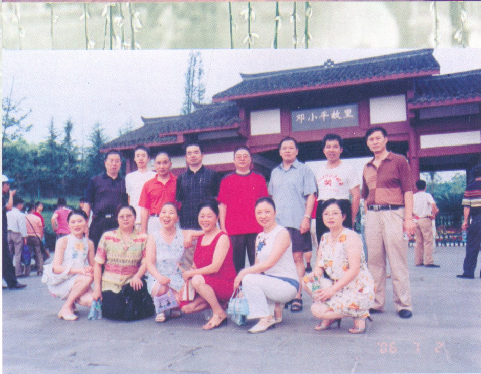
二〇〇五年七月一日物价局干部、职工和部分家属到小平故里进行革命传统教育