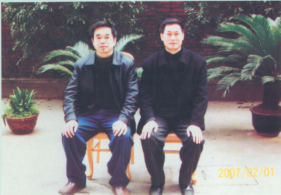
物价局第四届领导班子