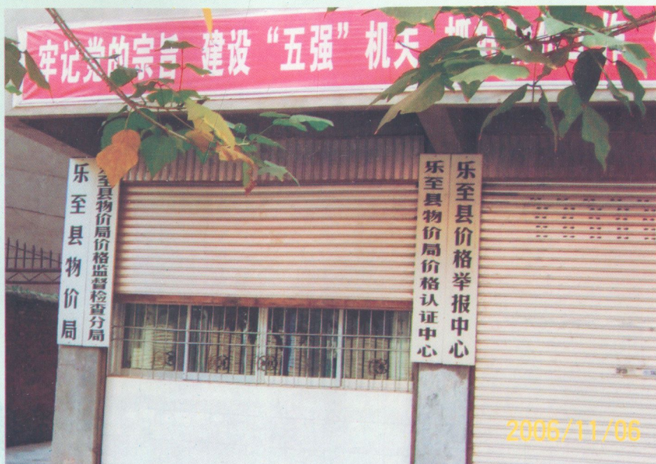
乐至县物价局办公楼