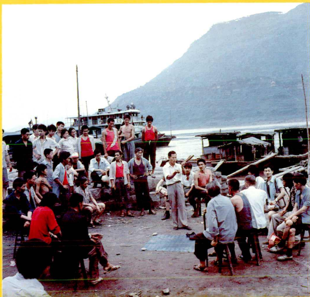
金钱板 涪陵曲艺队在长江边演唱