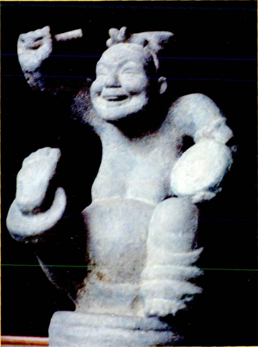
东汉说唱俑(四川新都县出土)