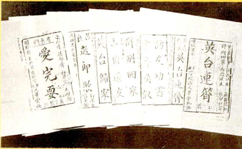
打连厢刻本(重庆图书馆藏)