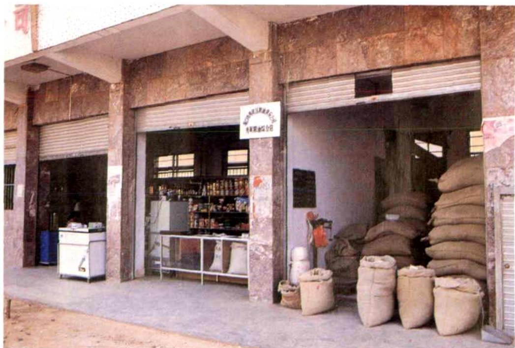
▲秀英粮油公司多种经营