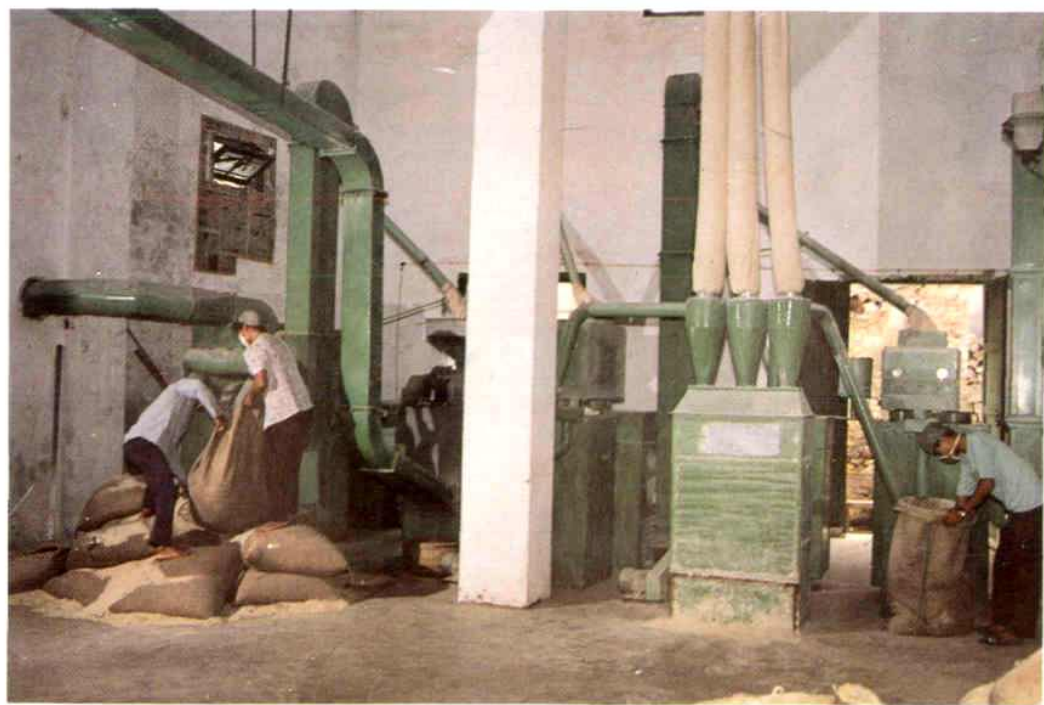
▲市粮油加工厂生产线