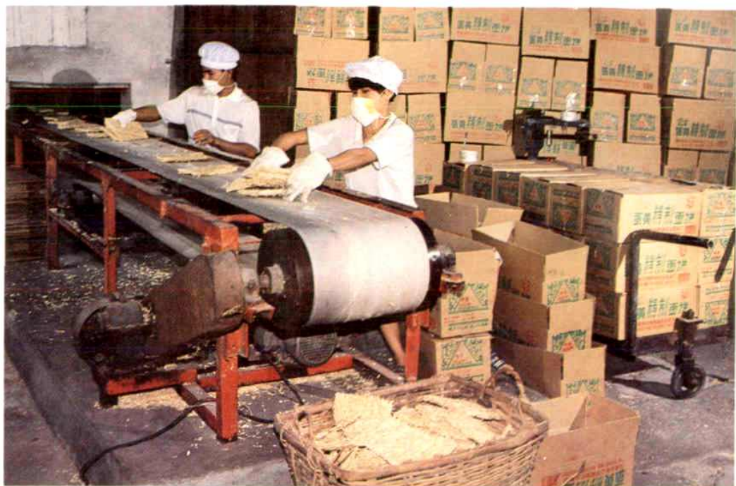
▲市面制品厂生产线