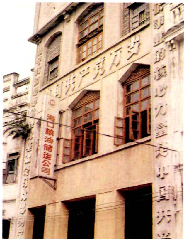
▲1950—1977年市粮食局办公楼(水巷口56号)