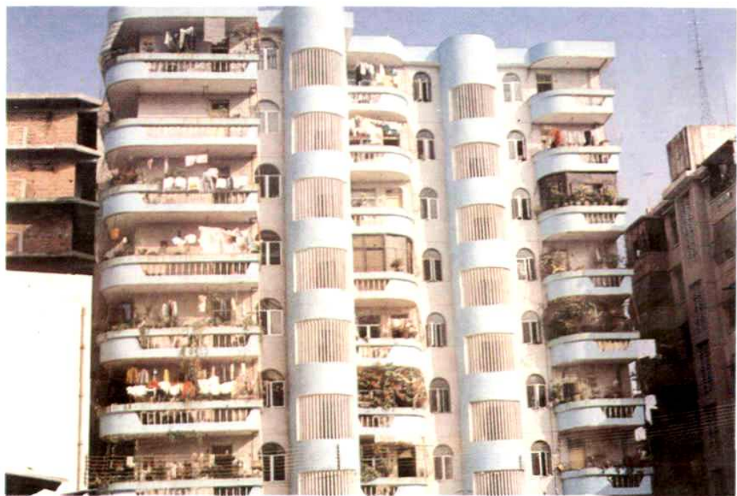
▲ 80年代市粮食局职工宿舍(长堤东路)