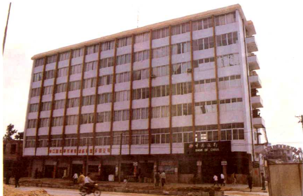
▲市秀英粮油供应公司办公楼