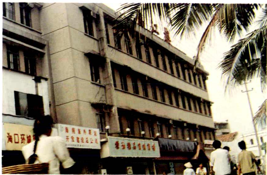
▲1978—1988年市粮食局办公楼(长堤路)