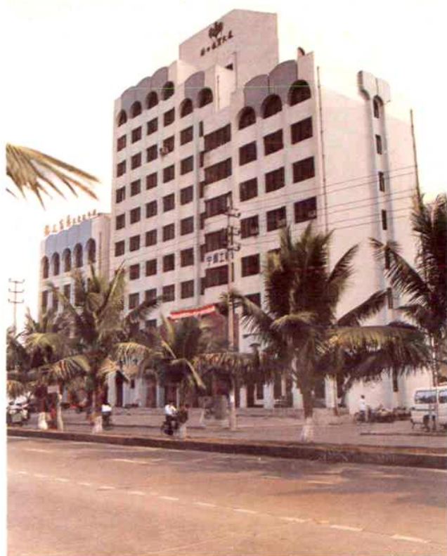
▲1990年市粮食局办公楼(长堤路)