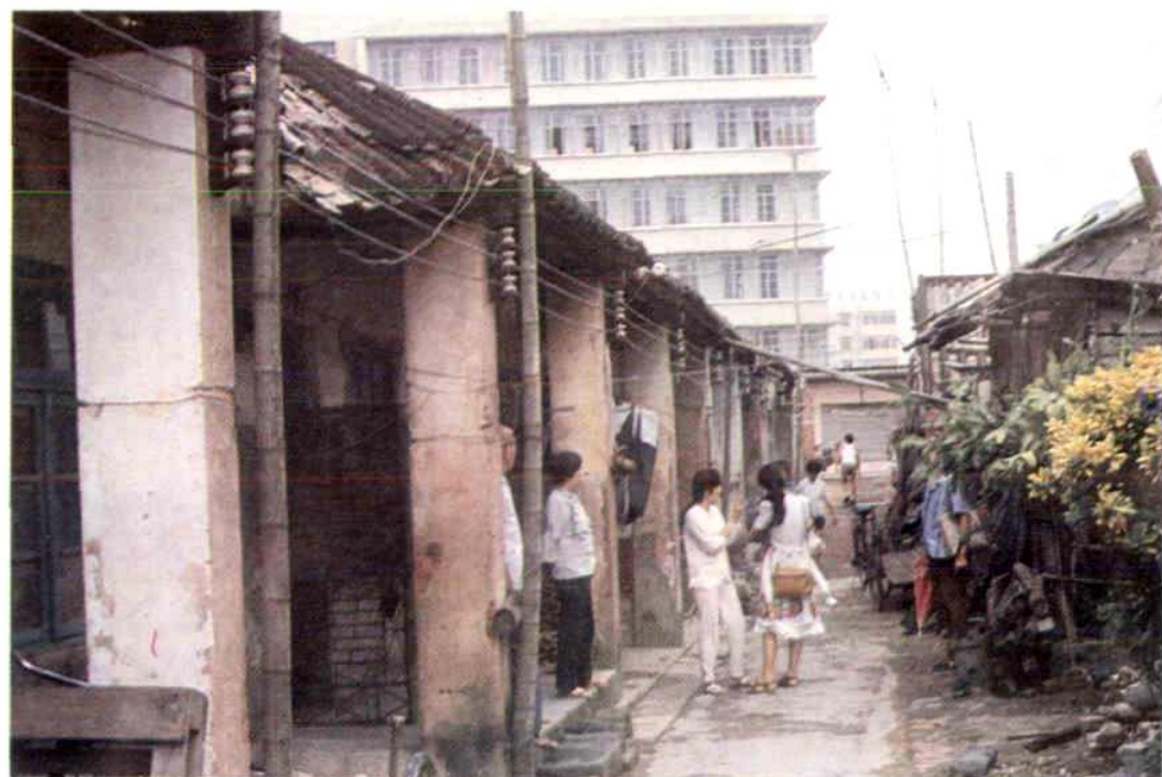
▲ 60年代市粮食局职工宿舍(海甸)