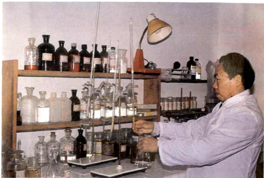
▲粮食转运站防化室粮质检验