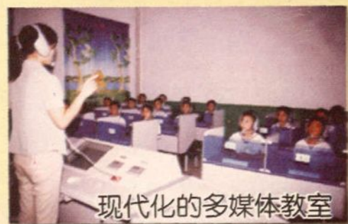
现代化的多媒体教室