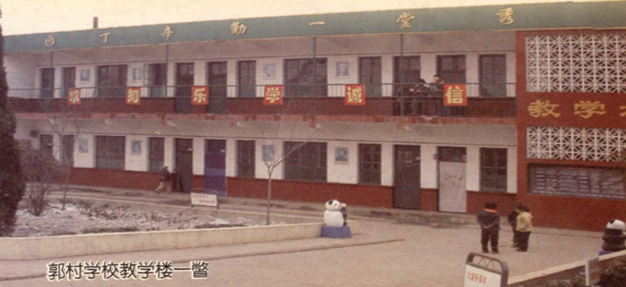
郭村学校教学楼一瞥