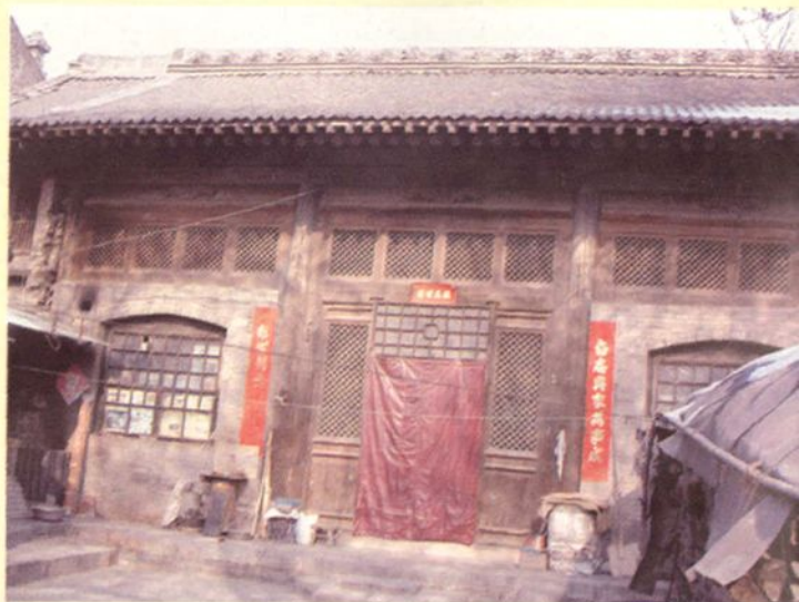
上百年历史的老住宅