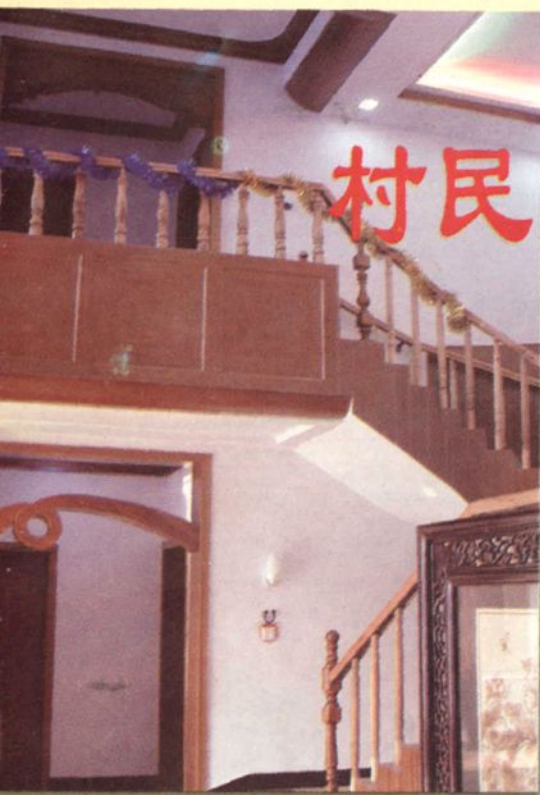
豪华的农家居室一瞥