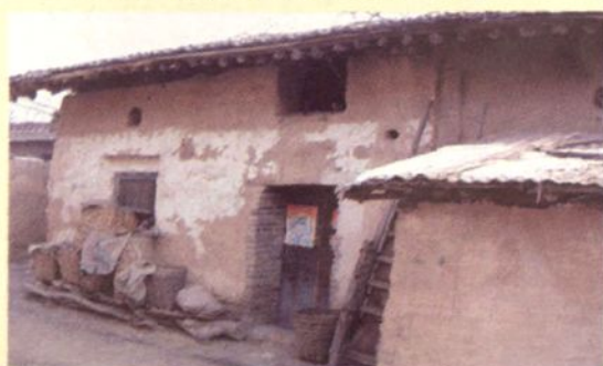
解放初期的农民住房