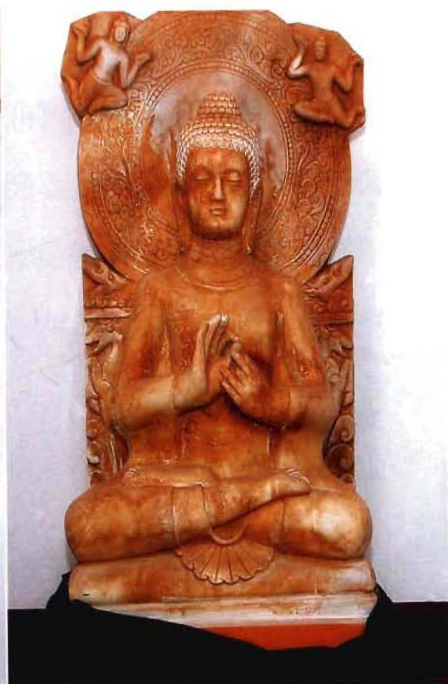
法海寺存北魏石造像

久雨不晴，乡民多到寺内“祈雨”、“祈晴”。寺僧不出庙，做善事不收钱。寺内有元泰定三年（1326年）龟负重修碑及清康熙五十二年（1773年）重修碑各1通，筑碑亭护之，藏有明刊本《大藏经》30卷。寺西有元泰定年间建筑圆通寺塔，明永乐年间筑广进、玉住寿塔。1980年春，寺前出土一批残缺不全的石造像，头、肢体共120余件。残像大者1.4米上下，小者仅20厘米。出土的石造像经整理对接，无一完整。石像比例匀称，造型优美，有一佛像的长方形底座上镌有题铭：“大齐武平二年岁次辛