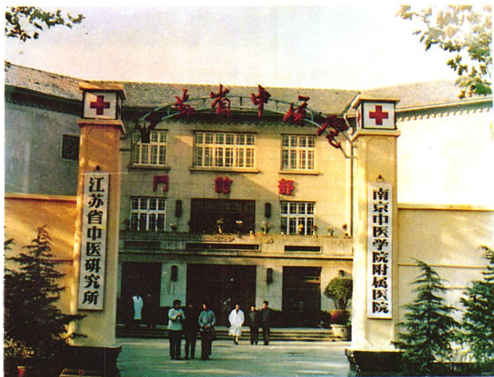
▲ 经省政府批准，1956年江苏省中医院在南京市汉中路155号新建门诊病房大楼。图为1958年竣工使用的门诊部大楼。