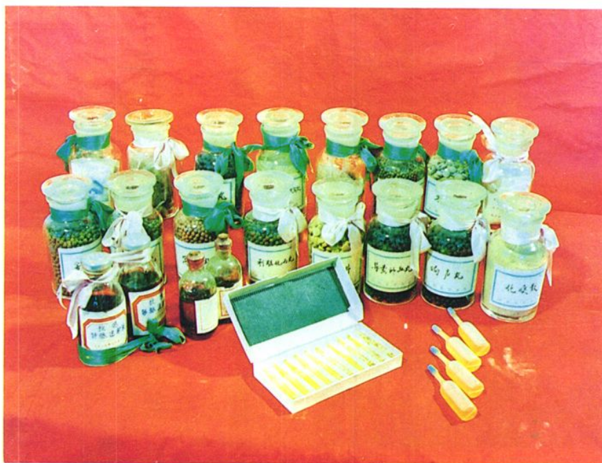
▲ 医院自制各种剂型的中成药达160余种，图为其中部分制剂。