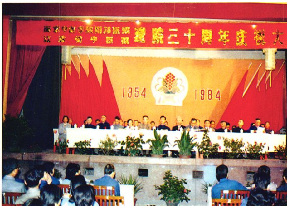
▲ 1984年10月4日是江苏省中医院建院30周年院庆，出席院庆的有省政府杨沐沂副省长、许京安副秘书长、省卫生厅盛立、盛天任厅长等领导同志。图为大会主席台。