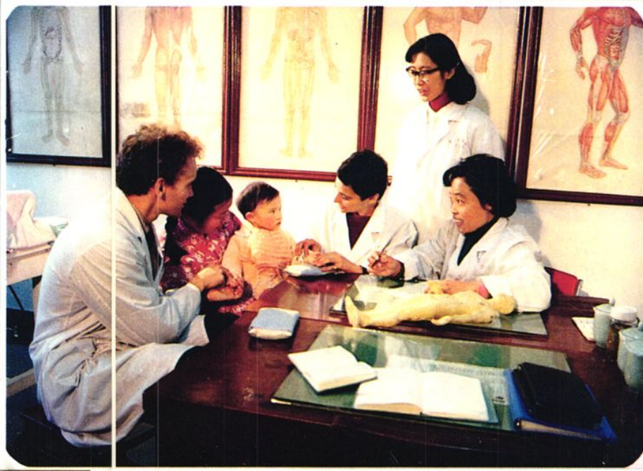
◀ 医院是国际针灸的临床教学基地，先后有30多个国家500多名外国医生前来学习针灸。图为两名芬兰医师正在实习针灸。