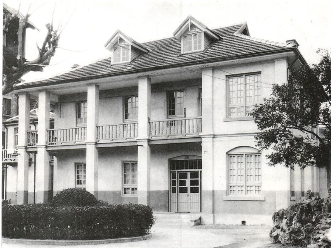
▲ 1954年10月4日江苏省中医院门诊部在南京市石婆婆庵八号正式开诊。图为当时门诊部内科、针灸诊室外景。