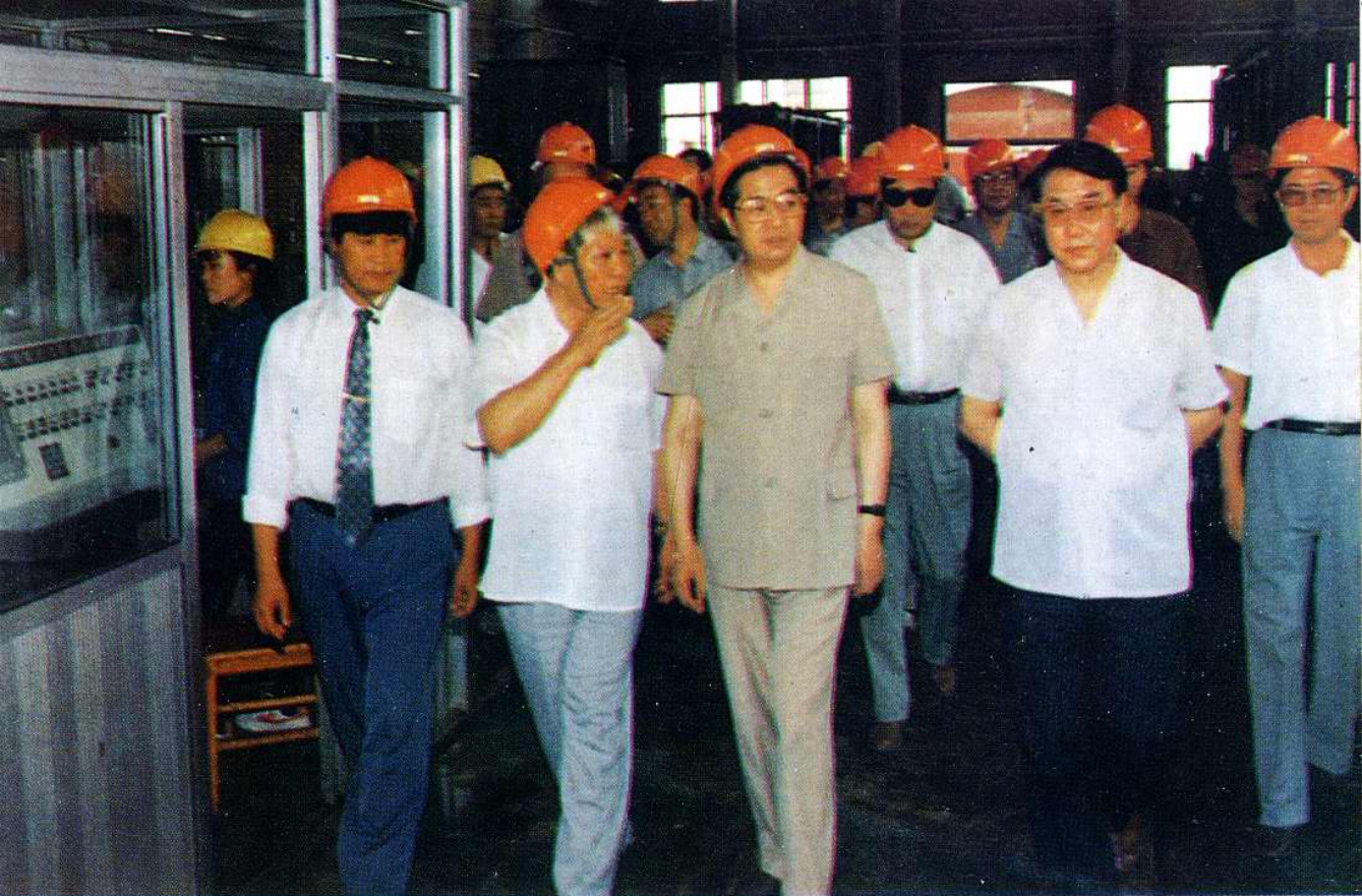
1994年6月21日，中共中央政治局常委、书记处书记胡锦涛视察宏利集团公司