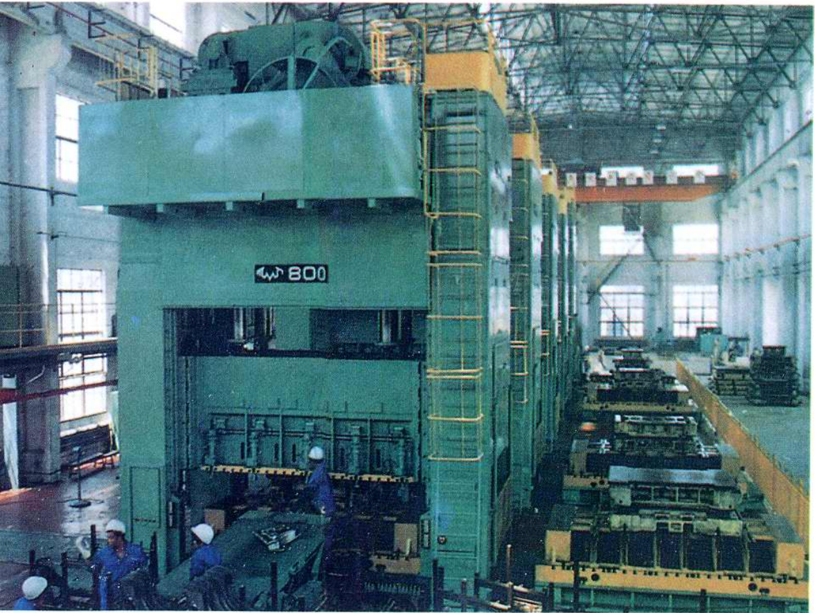
恒兴集团为汽车工业配套的冲压车间