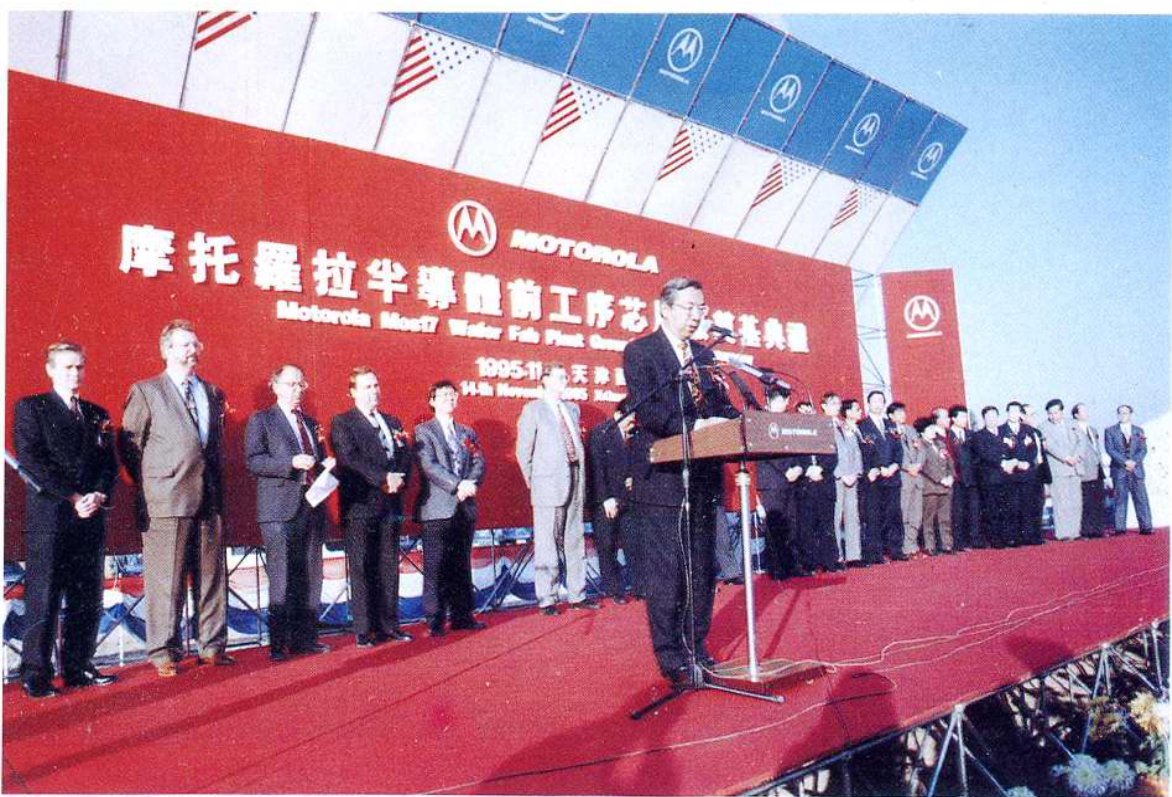
1995年11月14日，摩托罗拉半导体前工序芯片厂在西青经济开发区举行奠基典礼