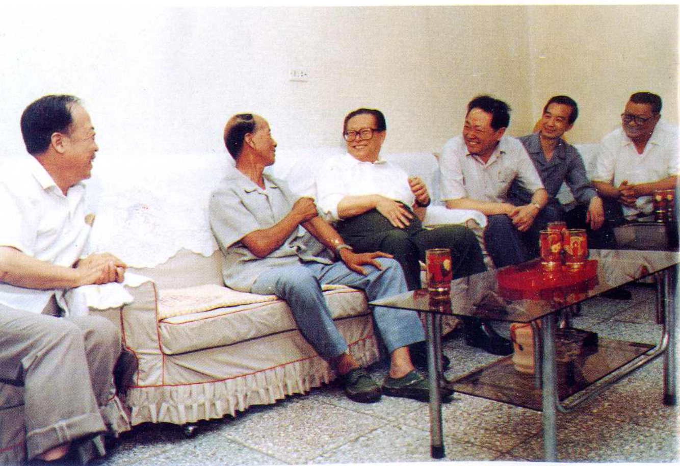
1991年7月28日，中共中央总书记、中央军委主席、国家主席江泽民视察小南河和小孙庄村