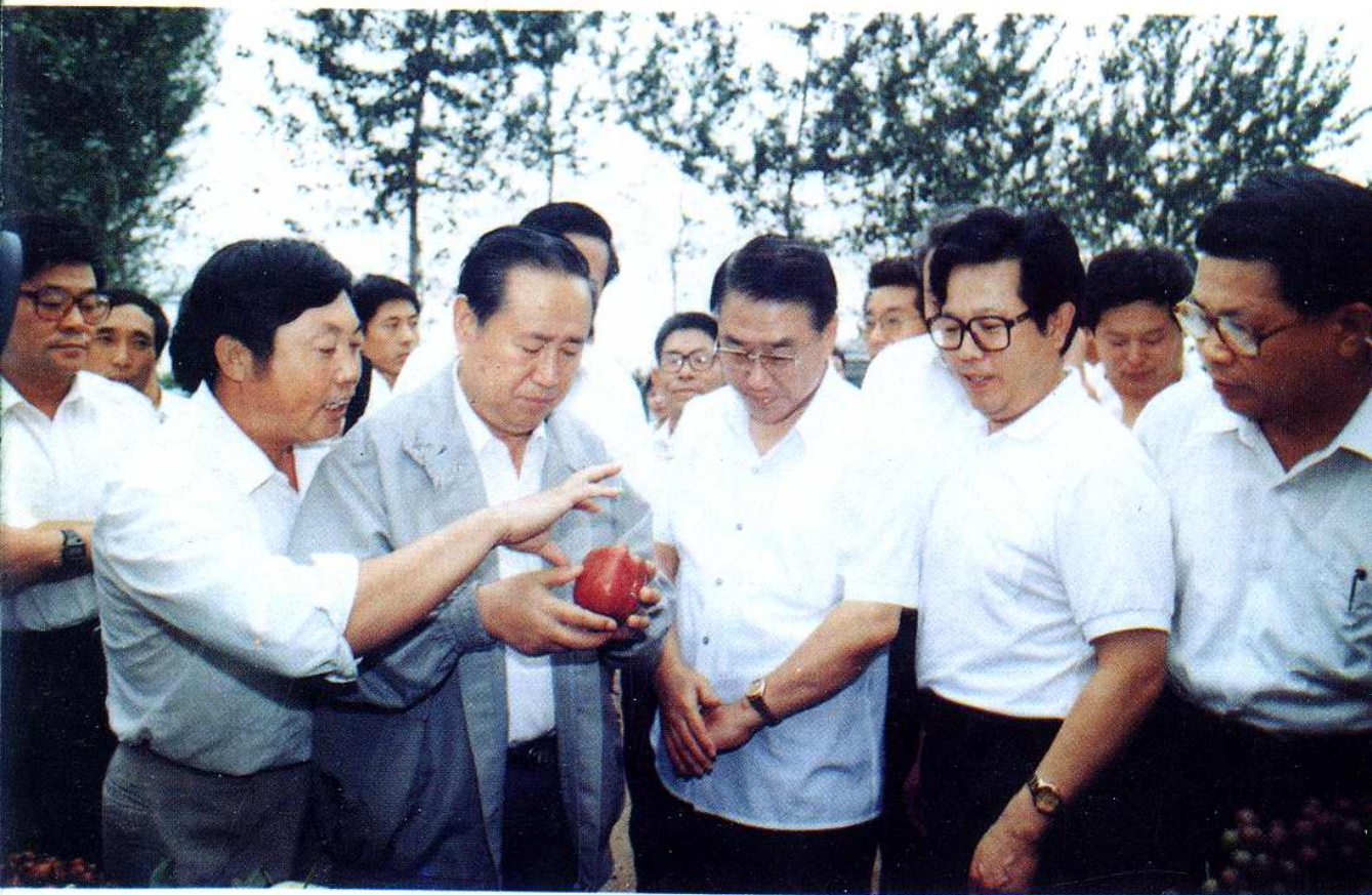
1995年9月5日，中共中央政治局委员、书记处书记、国务院副总理姜春云视察大柳滩万亩果园