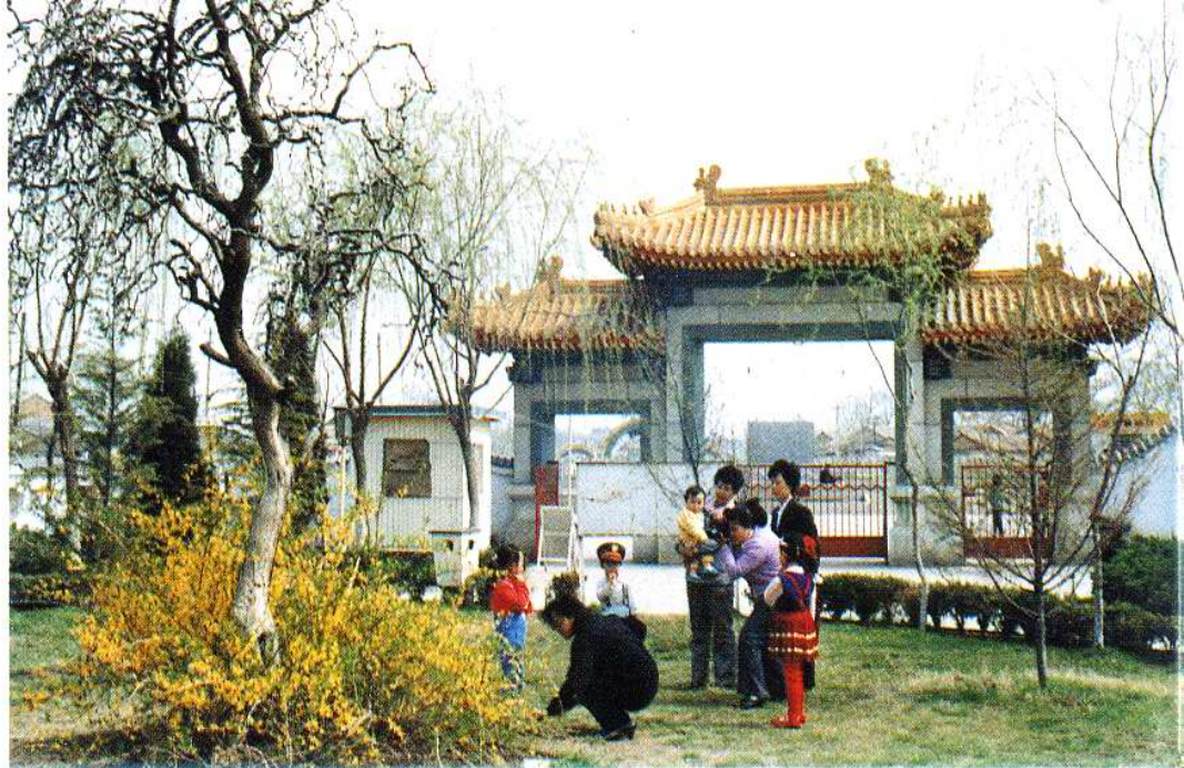
1987年4月建成的杨柳青公园（图为颐寿园门楼）