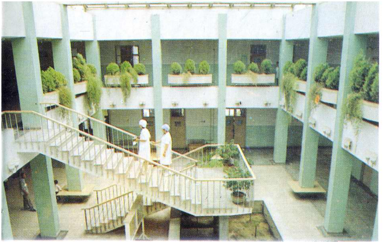
1986年6月落成的西郊医院（图为门诊大厅）