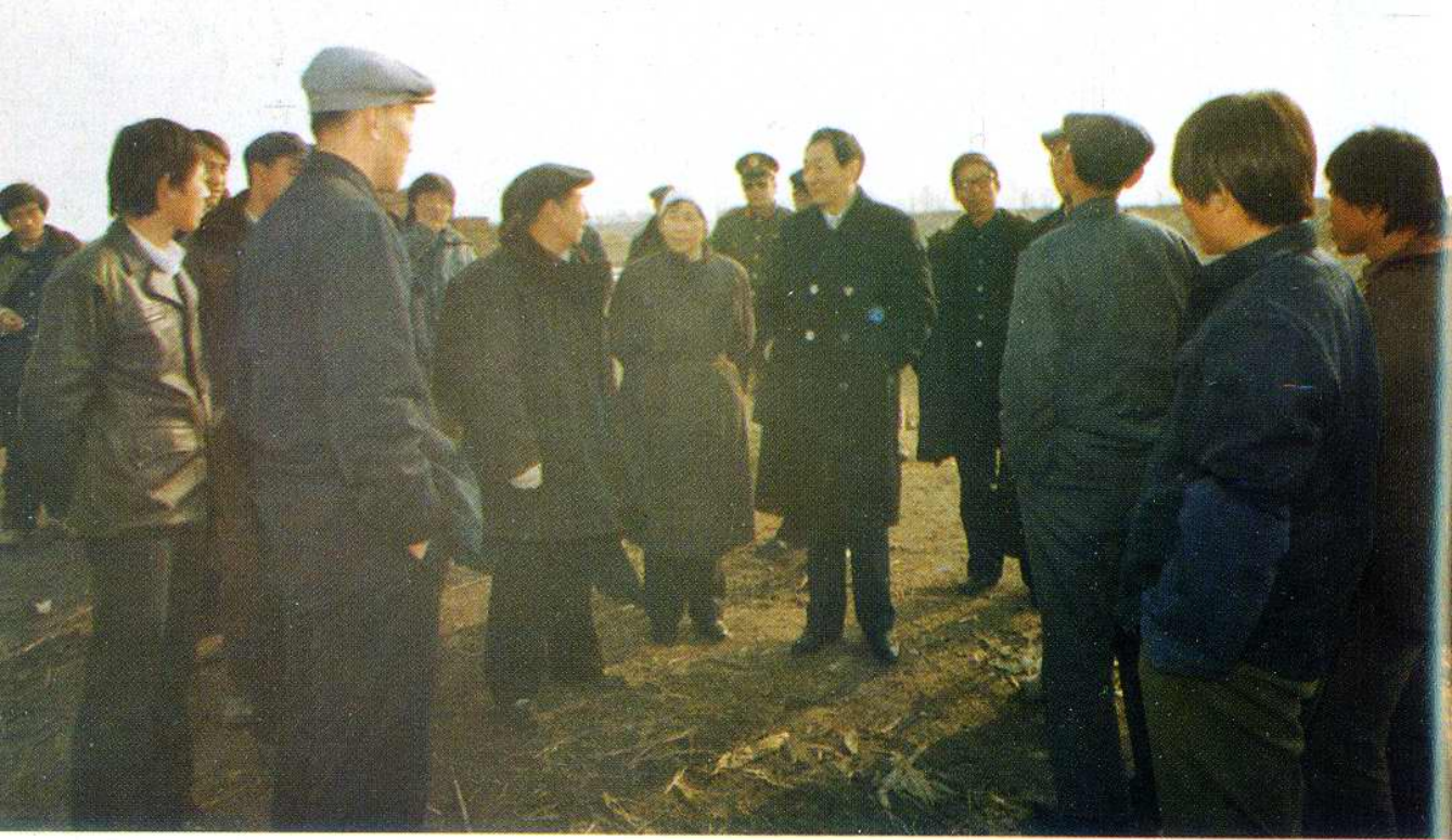
1988年11月15日，上海市市长朱镕基参观上辛口乡菜篮子工程