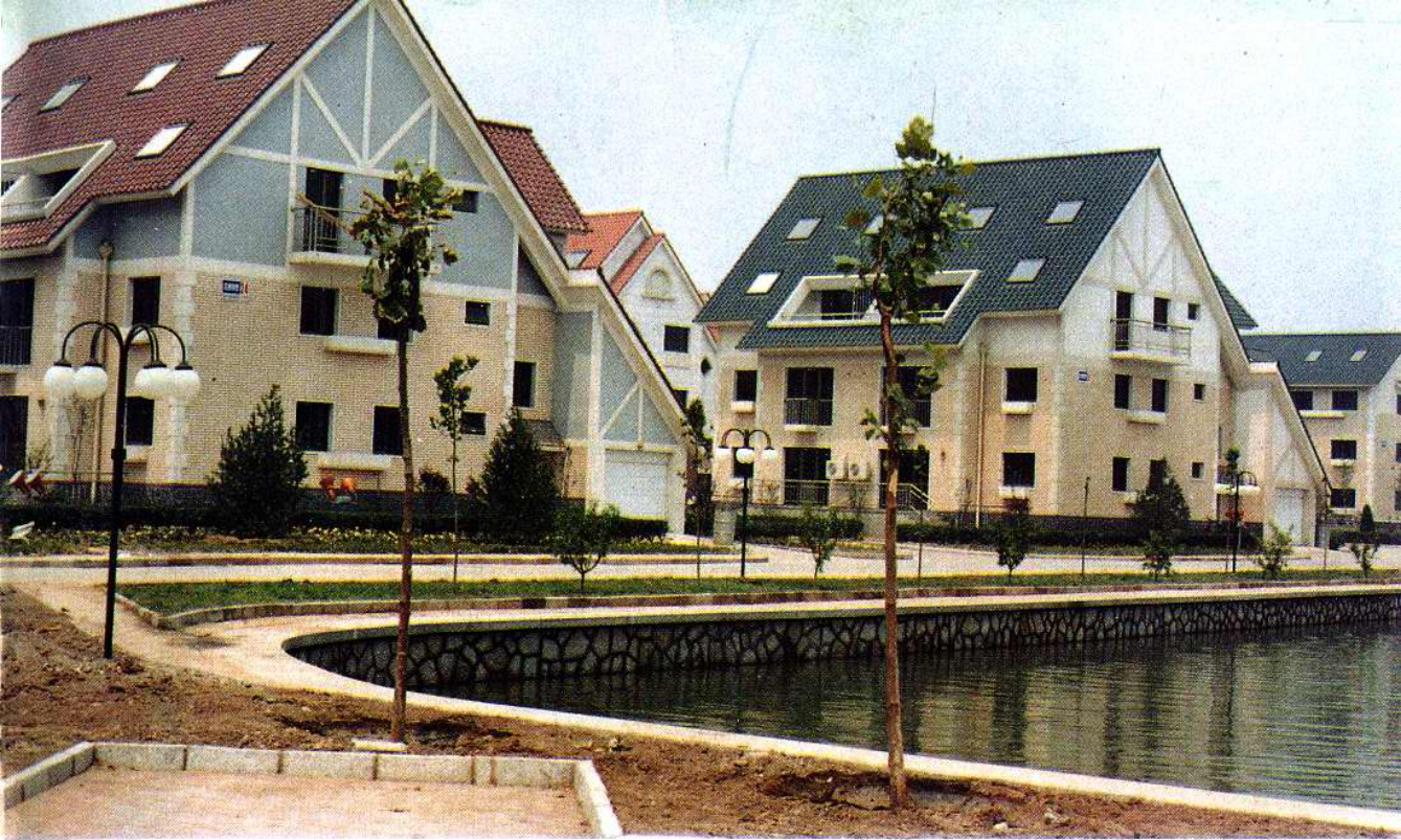
宁发集团农民新村——花园别墅区