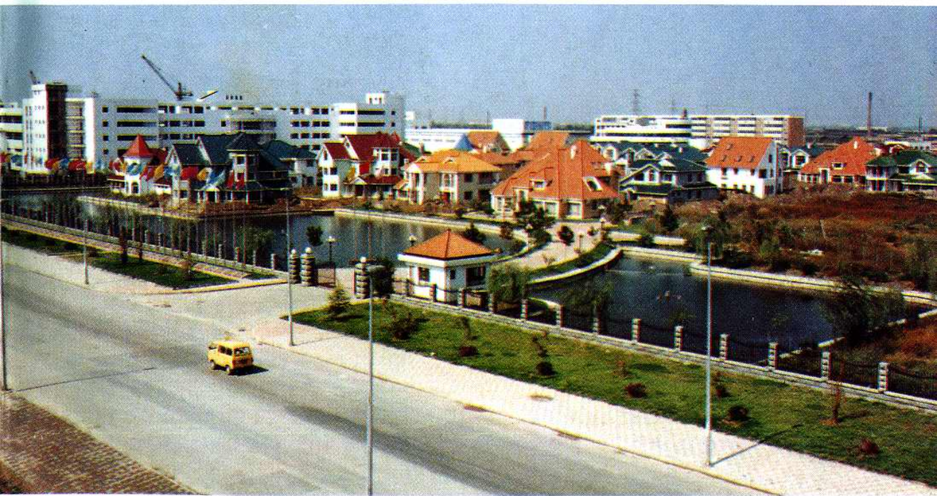
西青经济开发区建成的一号别墅区