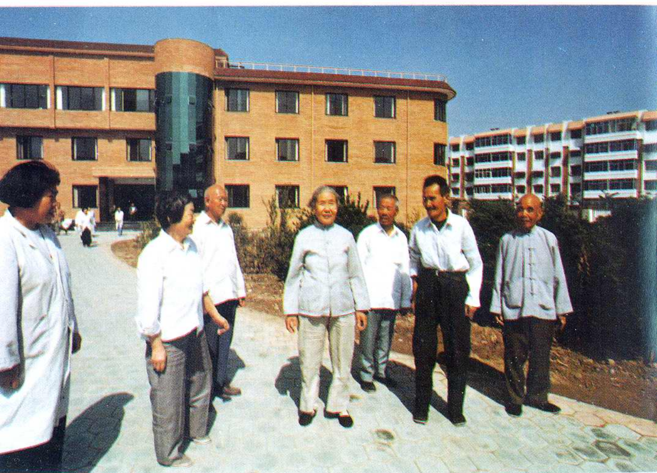
天津市一流的老年公寓——张家窝镇办敬老院