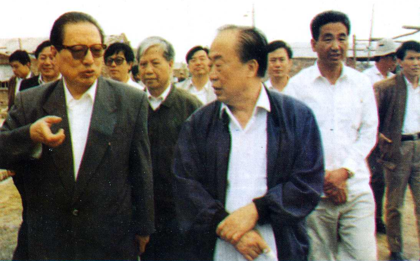
1994年5月14日，中共中央政治局常委、全国人大常委会委员长乔石视察小南河村养鸭场