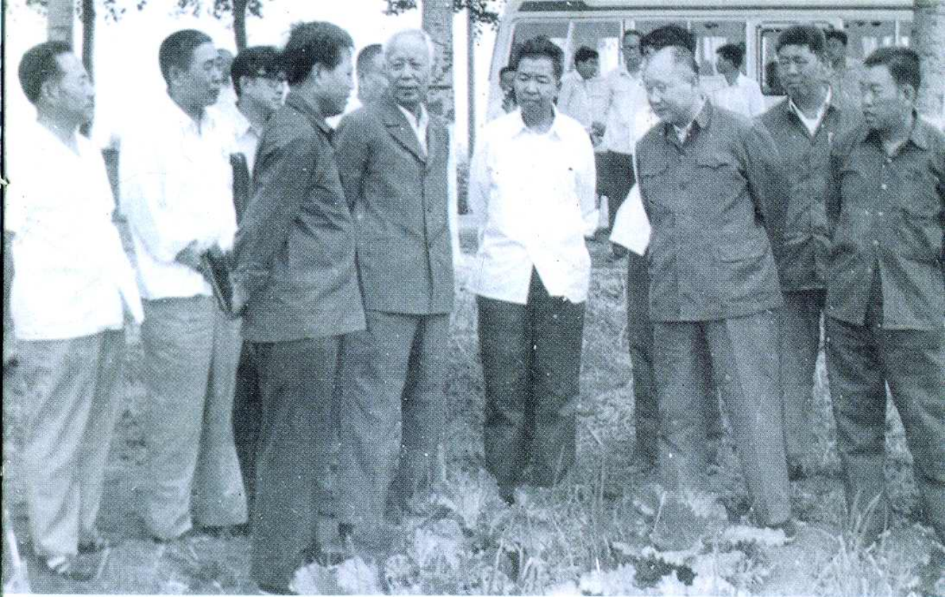
1983年8月27日，国务院副总理万里在西郊视察