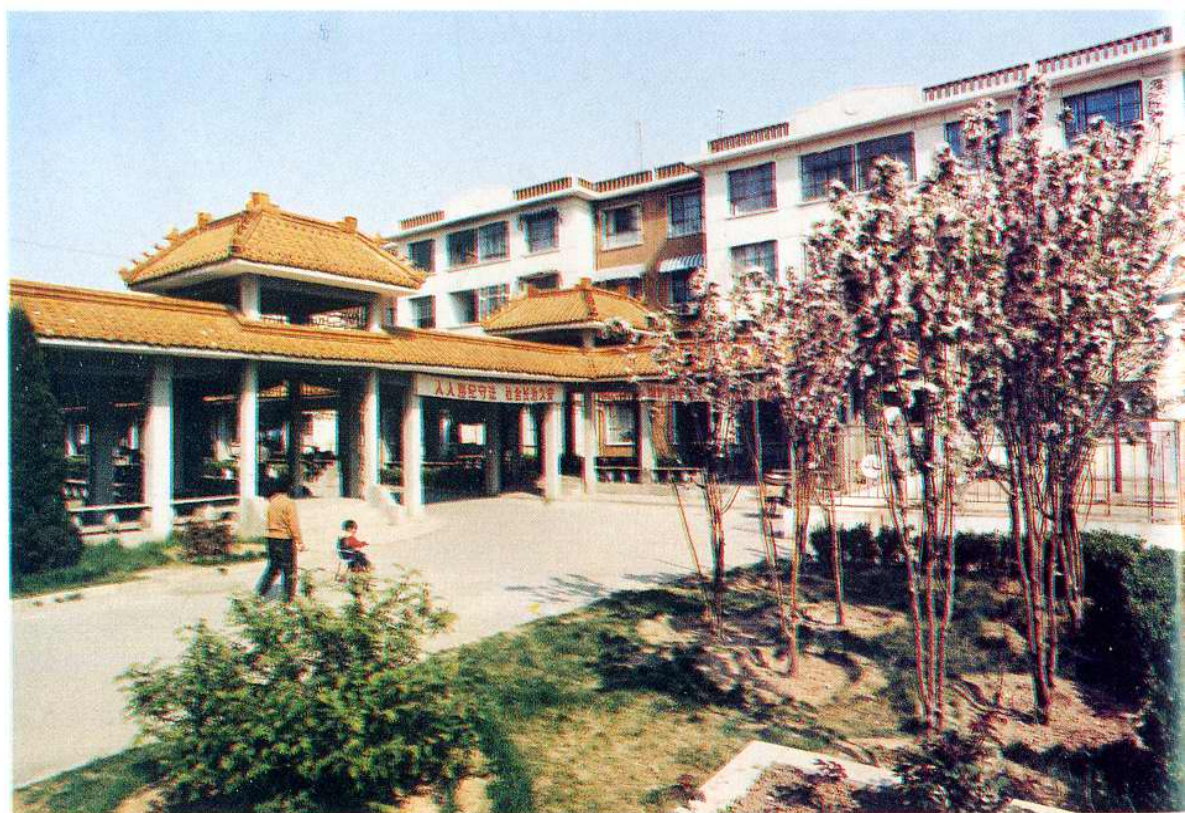
先达集团公司的前桑园农民新村