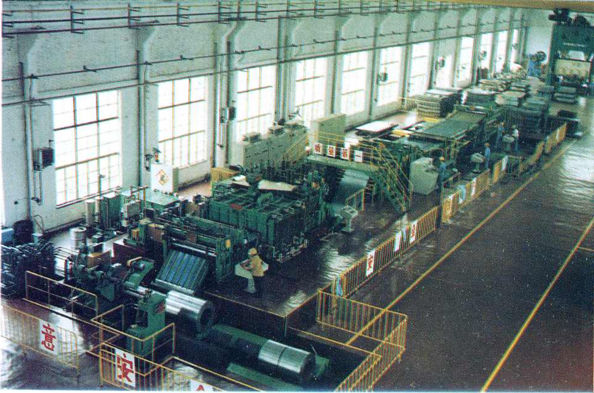
中北斜乡曹庄子村信誉剪板厂流水线