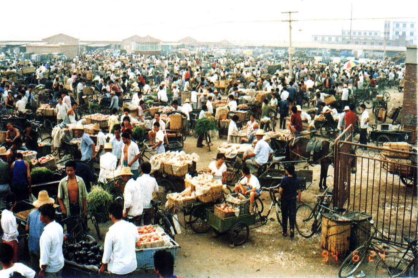
1992年10月建成境内规模最大的杨柳青二经路综合批发交易市场