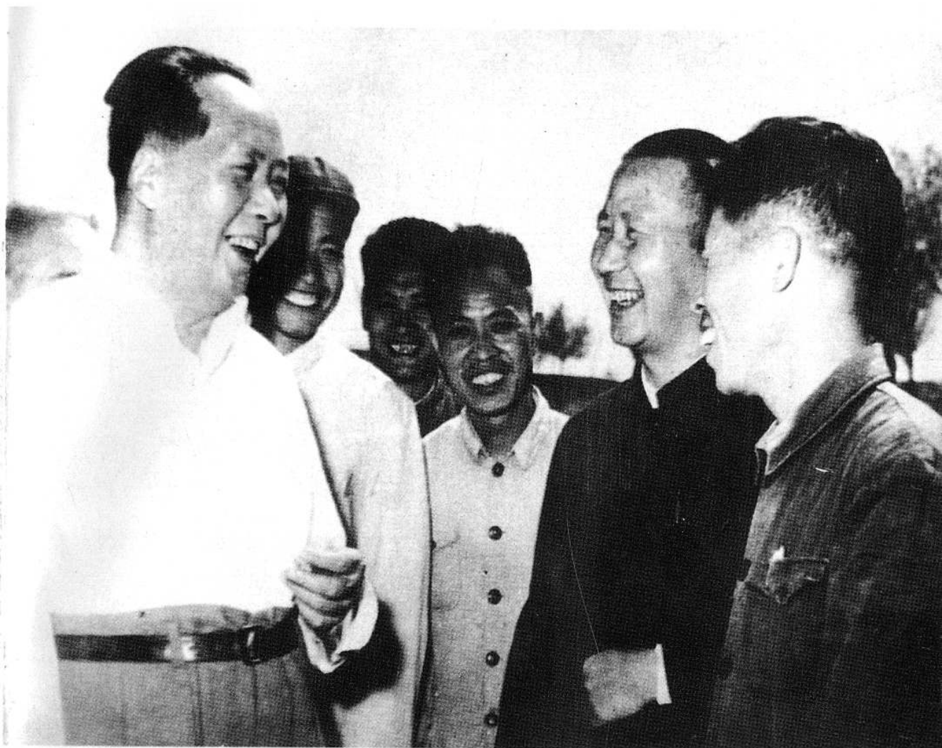
1959年9月19日，毛泽东主席视察西郊区杨庄子管理区稻田