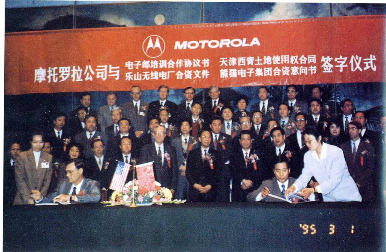
1995年3月1日，摩托罗拉公司在北京人民大会堂与西青区签署土地使用权合同