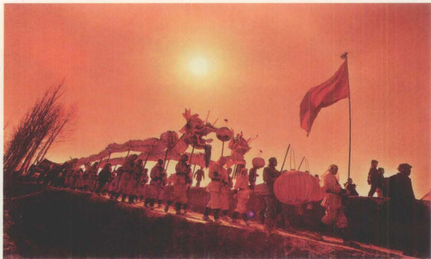
社火出行串 村表演

长距离 107 公里,总面积 6090 平方公里。永登处于青藏高原东北部与黄土高原西部过渡地带,也是祁连山支脉东延与陇西沉降盆地间交错的过渡地区,西风带的暖湿气流不易到达,形成了这里半干旱温带大陆性季风气候,成雨机会不多,雨量稀少,蒸发量大,气候干燥,素有三年两头旱之称。冬春漫长寒冷,夏秋短暂凉爽。