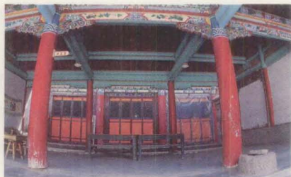
红城镇古晋 会馆宽阔的过 厅