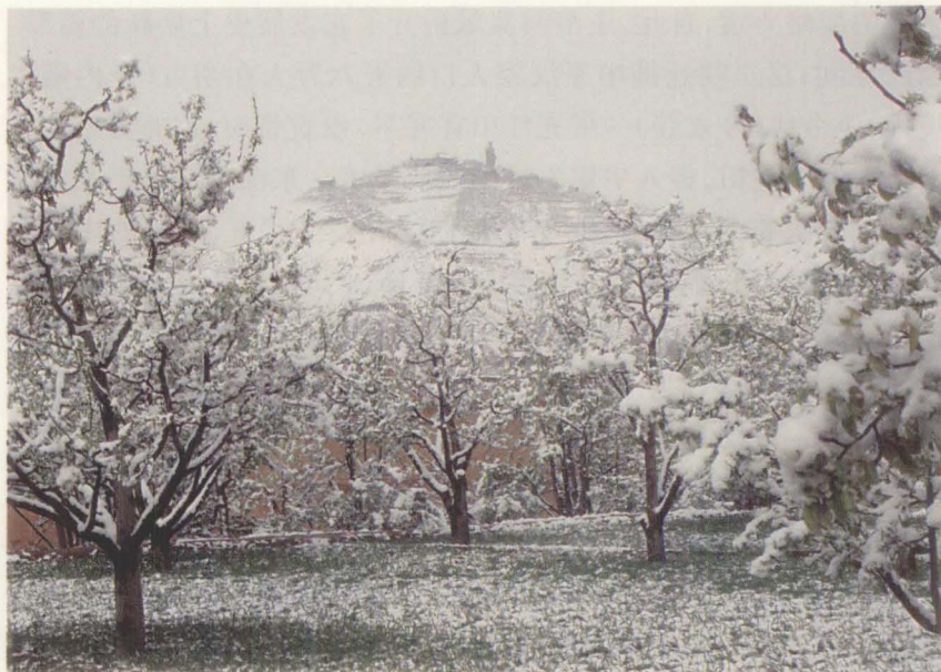
位于永登苦 水街村西南的 猪驮山全景