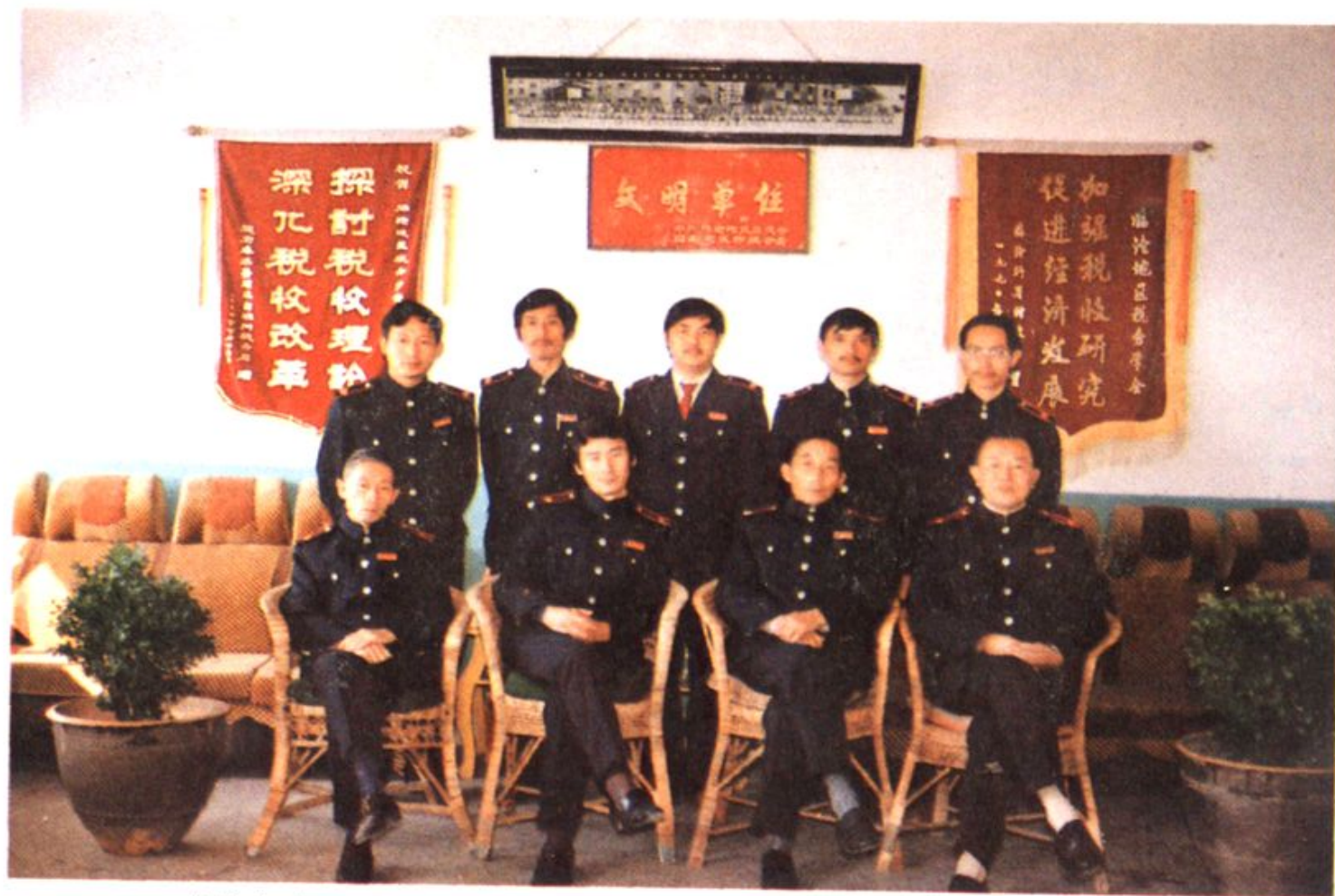
临沧地区税务志编纂委员会全体成员