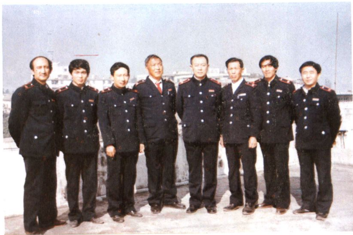
临沧地区税务局税志办工作人员