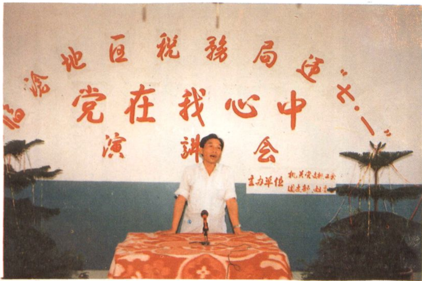
地局机关庆祝“七一”建党节