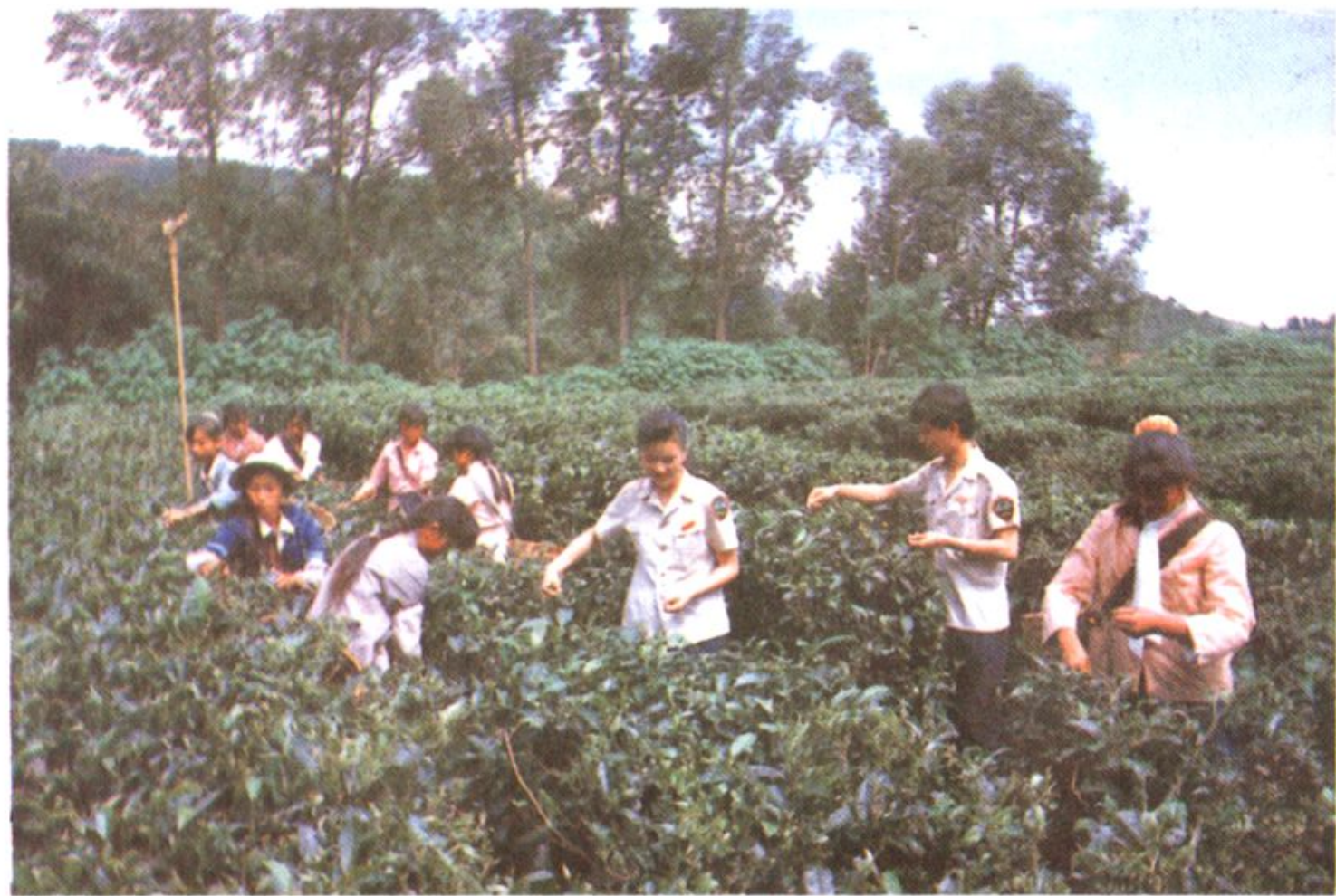
深入茶园了解春茶长势