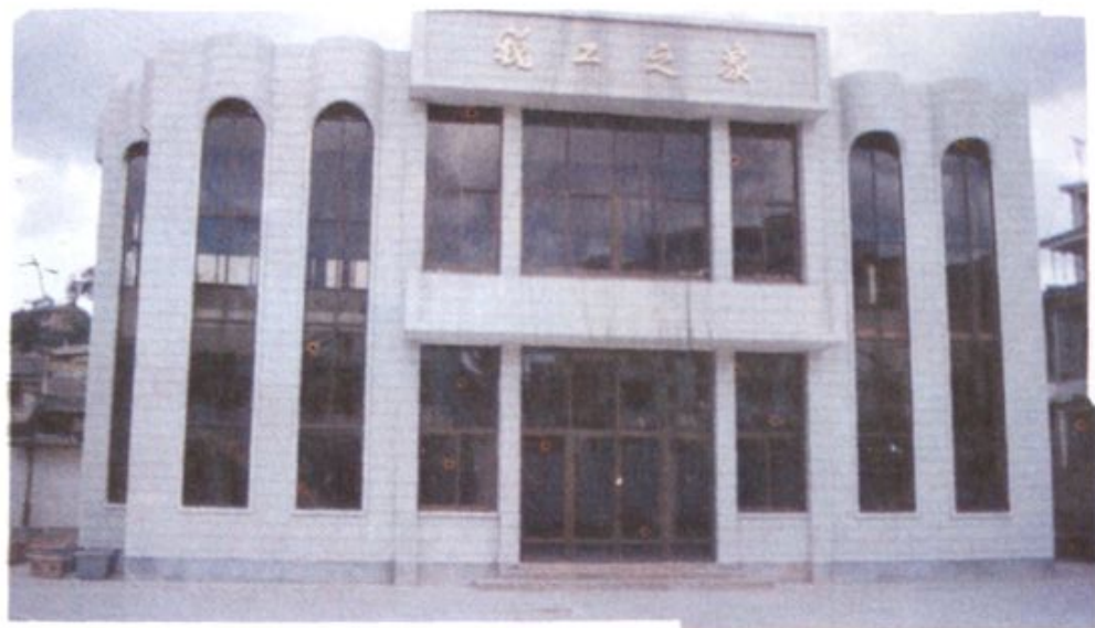
新建的职工宿舍和税工之家