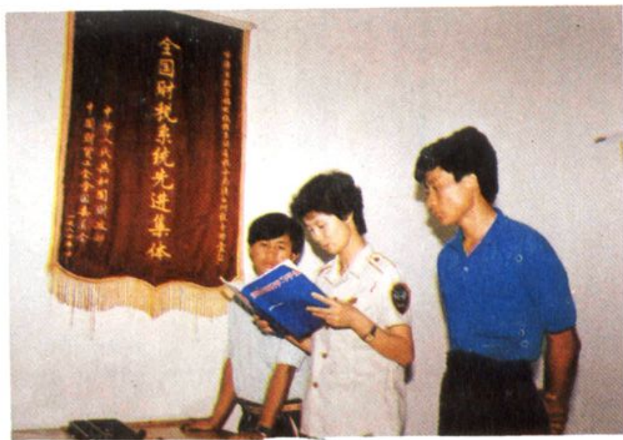
耿马清水河税务检查站