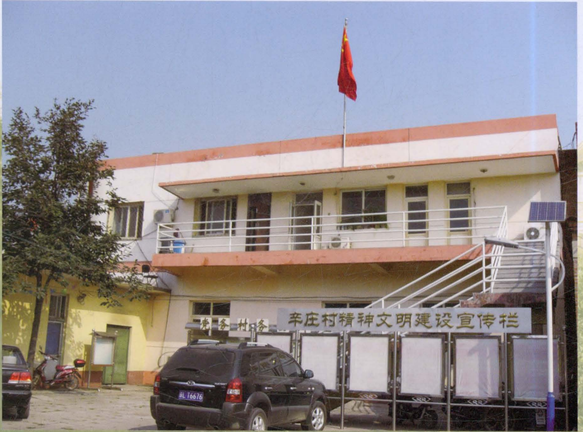
村党、政、公司办公楼