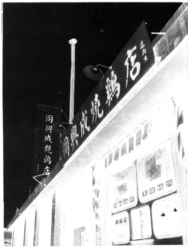
同兴成烧鸡店 柴记