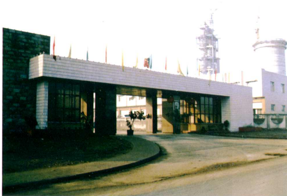
◆琉璃河水泥廠正門