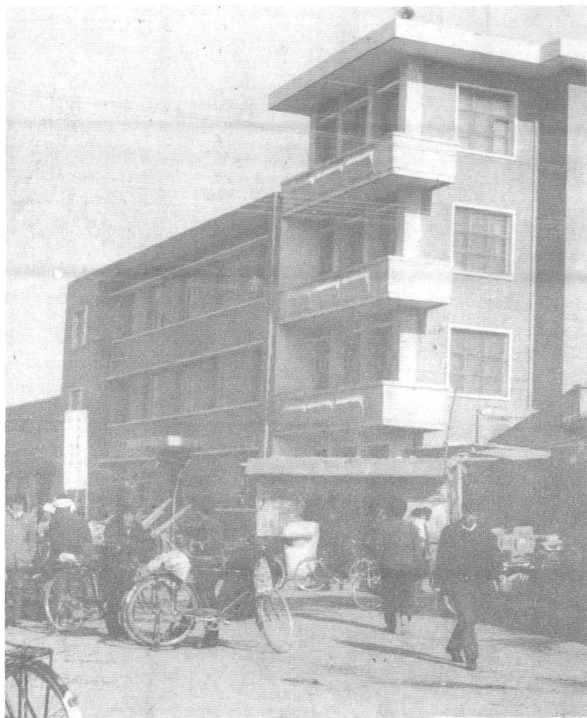
城关二所办公楼一角。