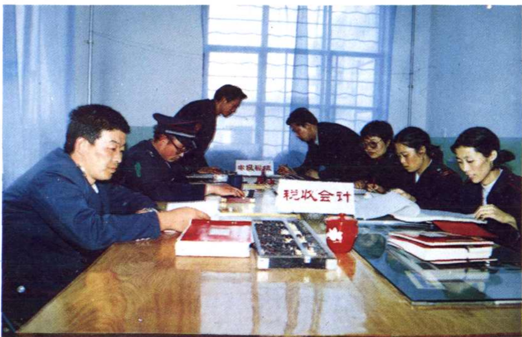
城关一所学习贯彻税收征管改革实施方案。