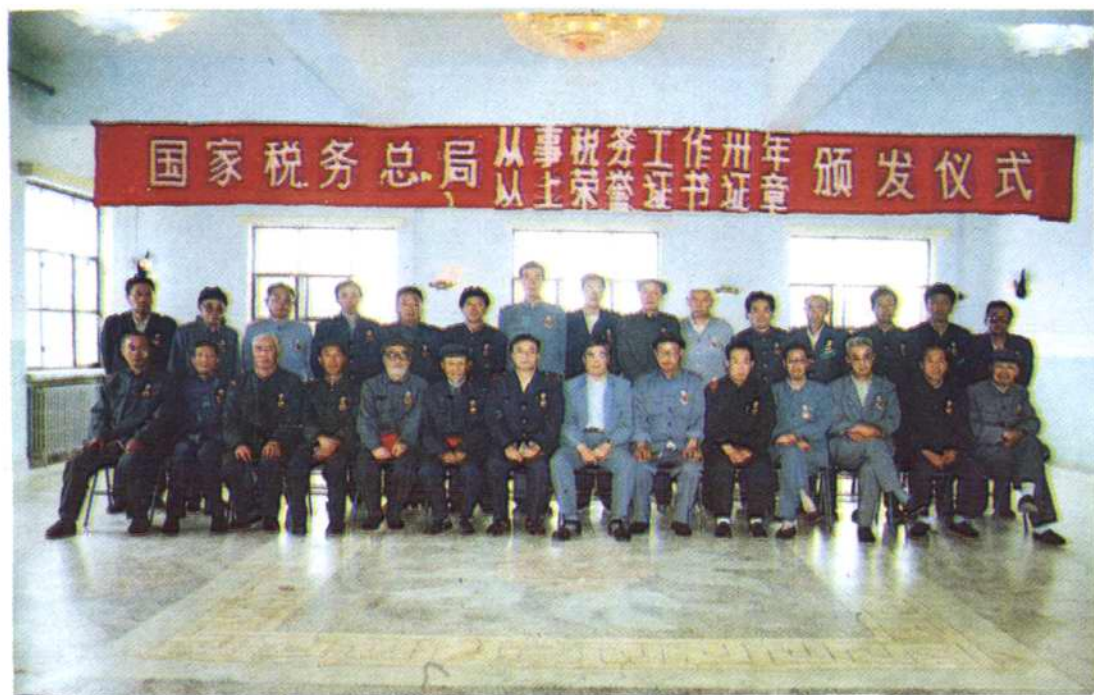
从事税务工作三十年以上并荣获证书、证章人员合影。