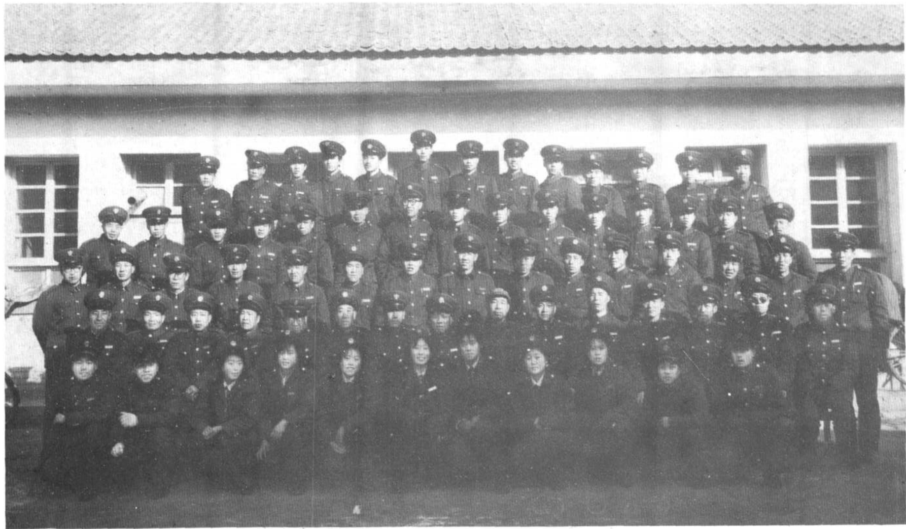
一九八四年稅务标志服着装人员合影。