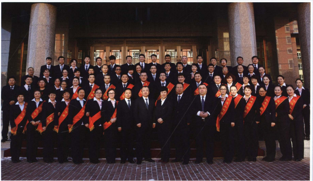
2016年1月23日，县联社全体员工合影