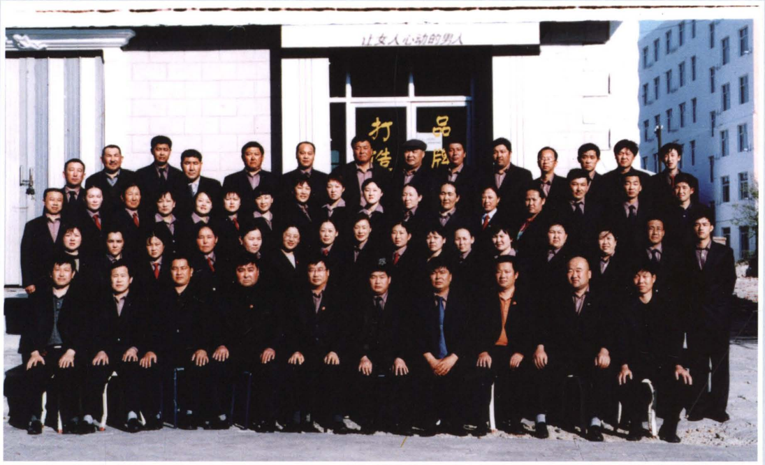
2005年5月14日，县联社全体员工合影