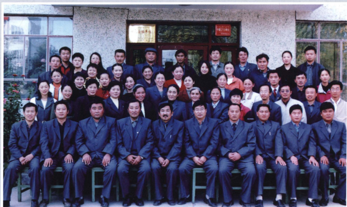
2001年9月23日，县联社全体员工合影