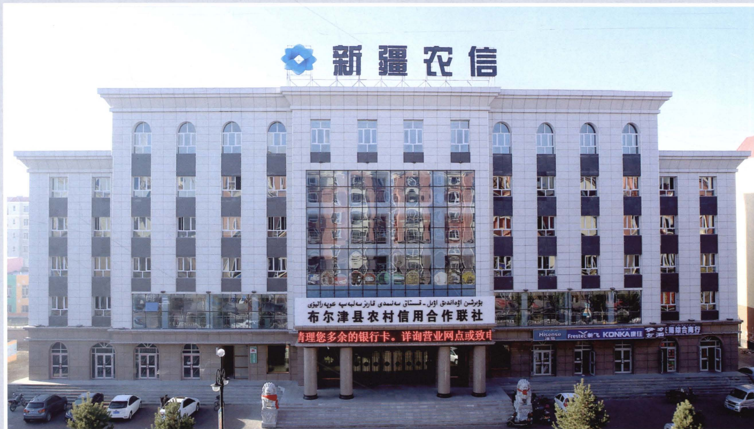
2015年建成并投入使用的布尔津县农村信用合作联社综合办公楼