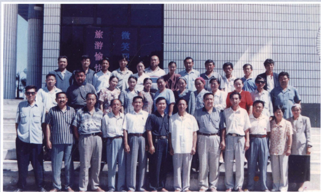
1998年7月，县联社全体员工合影