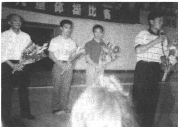
1992年李小双获奥运会自由体操冠军。图为李小双(左二)和李大双(左三)从巴塞罗那载誉归来参加市政府欢迎会时情景。左一为丁霞鹏，右一为国家体操队总教练黄玉斌

“他俩是双胞胎，就以双字取名，早出生的叫大双，小的就叫小双了。怎么样？”丁老师问。