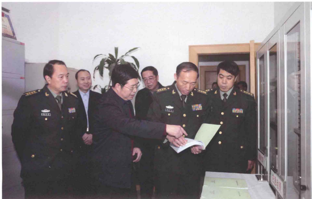
▲ 2009年12月21日，省军区副政委李忠铨（右二）到廊坊市交通运输局检查“十一五”国防交通动员建设规划落实情况，廊坊军分区政委宋革新（左一）、参谋长史仲平（右一）、市交通运输局局长王相仁（左三）陪同