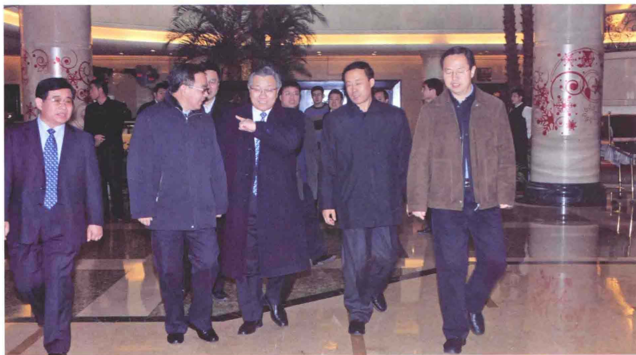
▲ 2008年12月15日，交通运输部部长李盛霖（左三）、河北省省长胡春华（左二）、副省长宋恩华（右二）、省政府副秘书长曹汝涛（左一）到廊坊就成品油价格和税费改革进行调研，市委书记赵世洪（右一）陪同