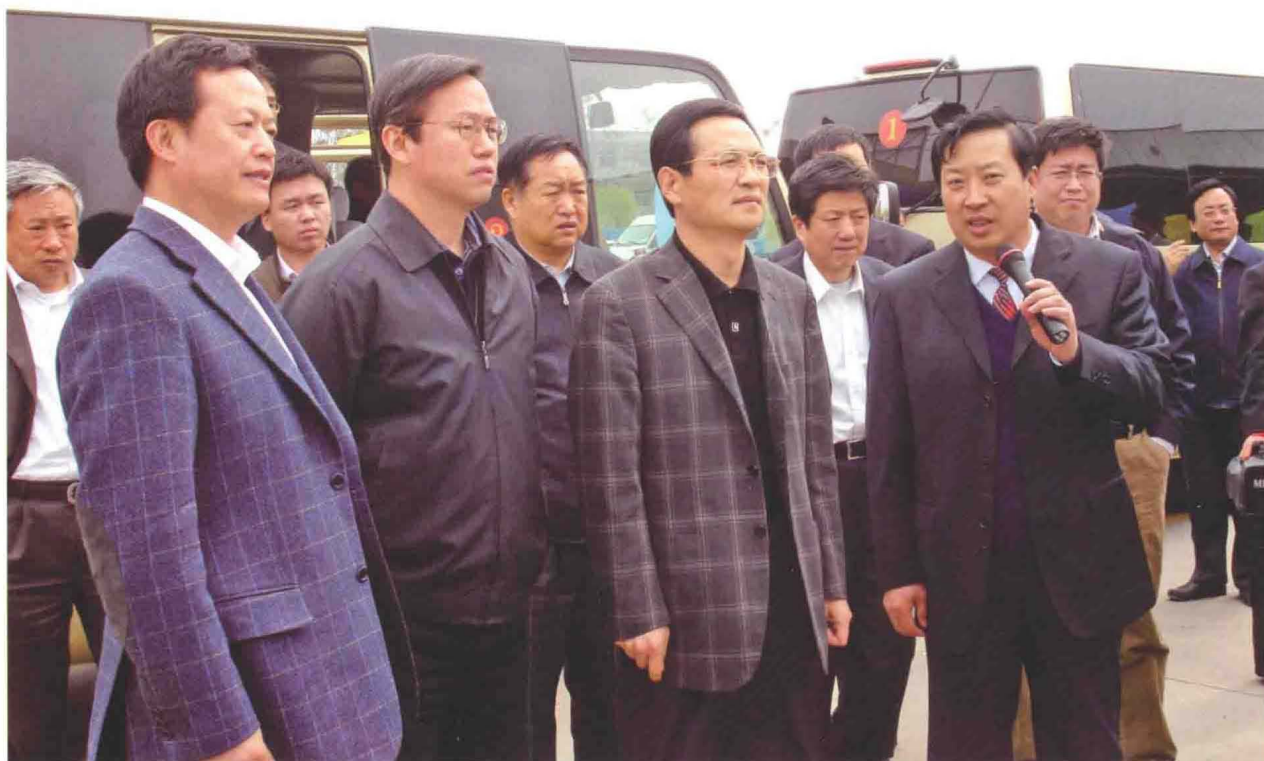
▲ 2011年9月15日，省委副书记付志方（前排左三）在市委书记赵世洪（前排左二）、市长王爱民（前排左一）、市政协主席寇德松（左七）的陪同下视察廊坊市交通运输局广宇物流公司