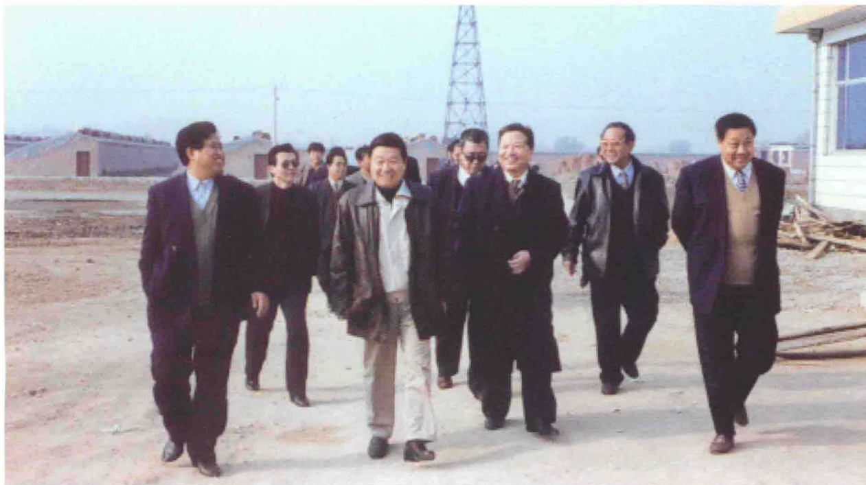
▲ 1997年11月19日，交通部副部长胡希捷（前排左二）视察106国道，省交通厅厅长路富裕（前排左一）、廊坊市交通局局长冯永平（前排左三）陪同