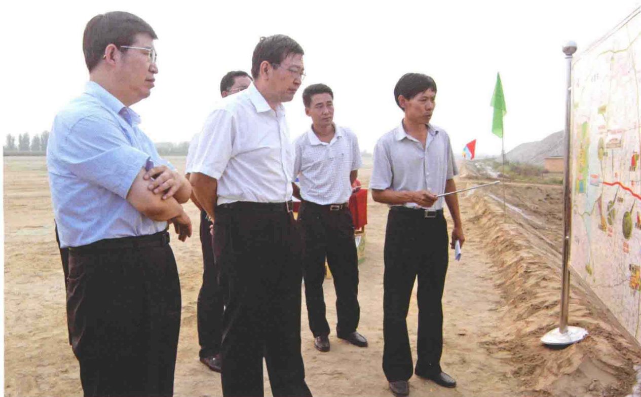
▲ 2010年9月3日，省交通运输厅党组书记、厅长焦彦龙（左二）到廊沧高速施工一线实地检查工程建设情况，廊坊市交通运输局局长王相仁（左一）陪同