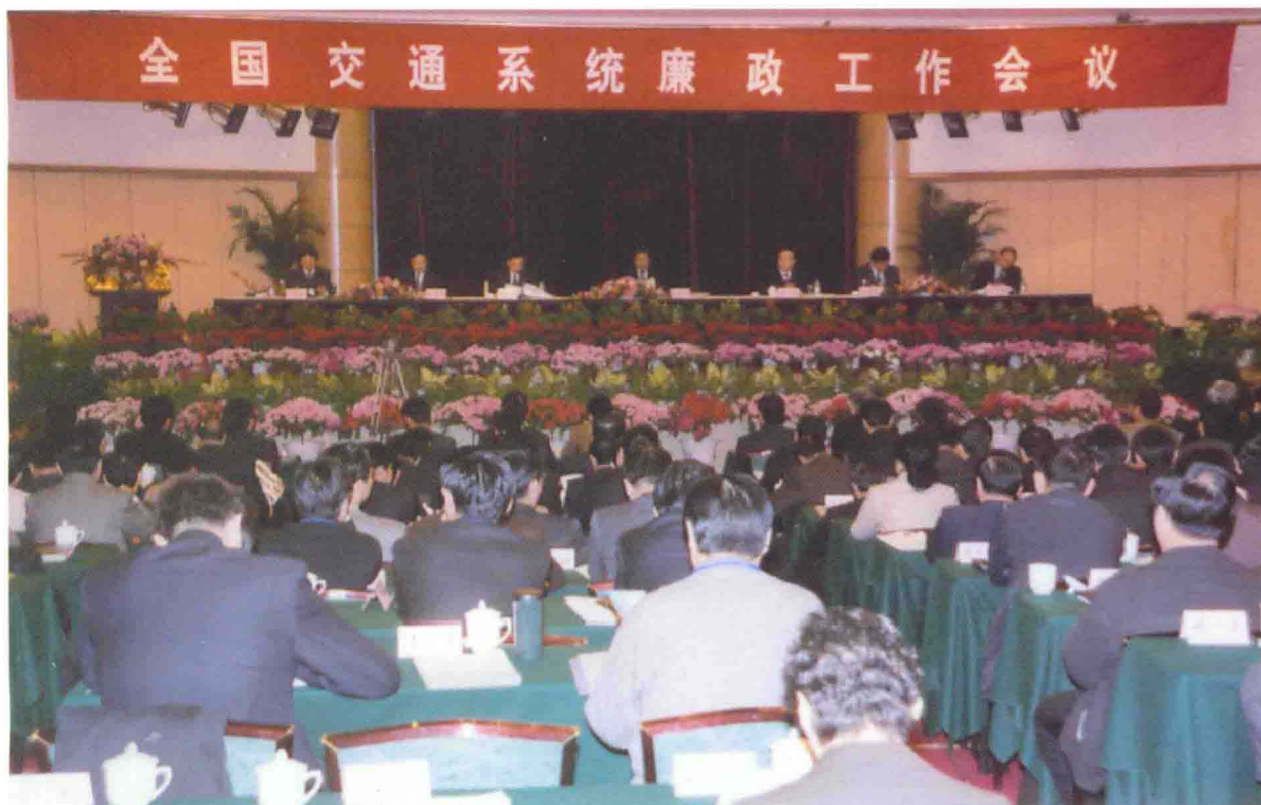
▲ 2005年1月31日，全国交通系统廉政工作会议在廊坊召开，交通部党组书记、部长张春贤，河北省常委、省委秘书长张力出席了会议