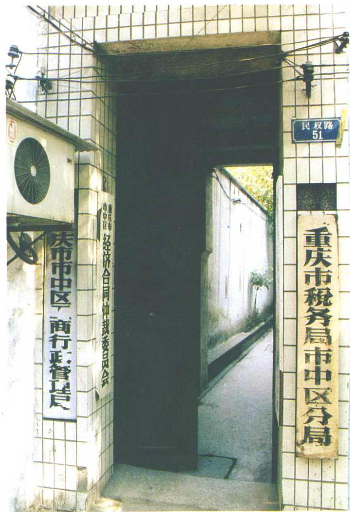
重庆市税务局市 中区分局办公楼前的巷道大门