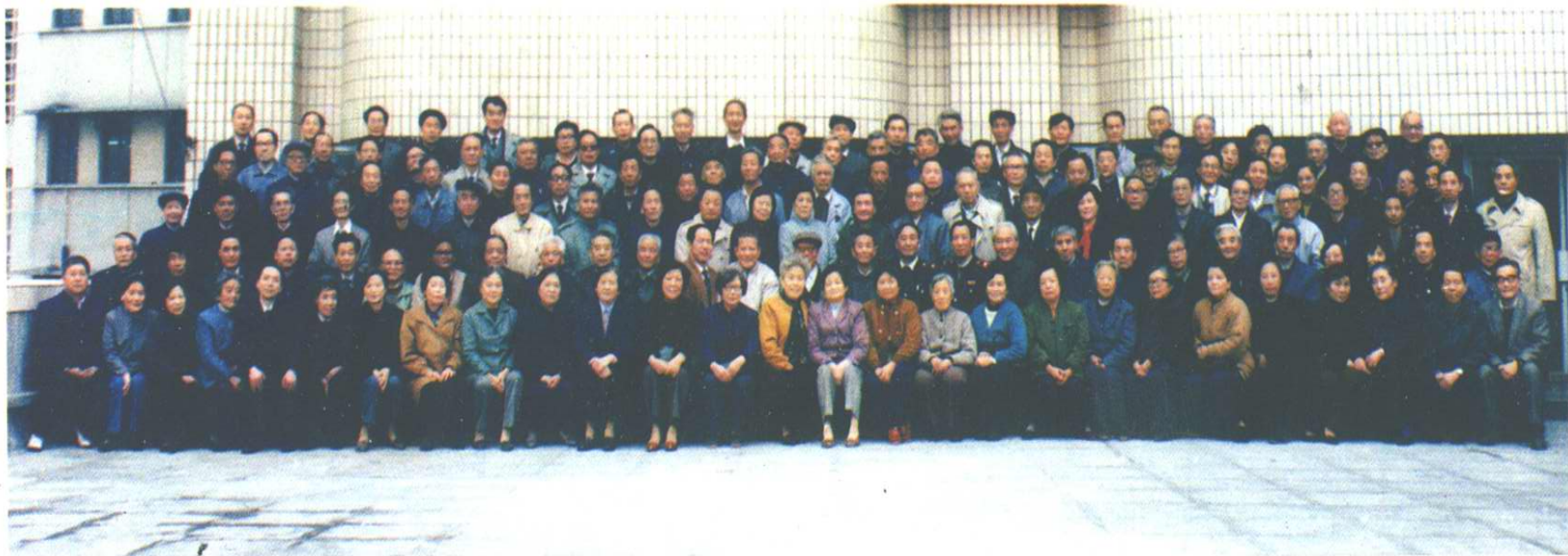
重庆市税务局市中区分局五十年代部份老同志留影