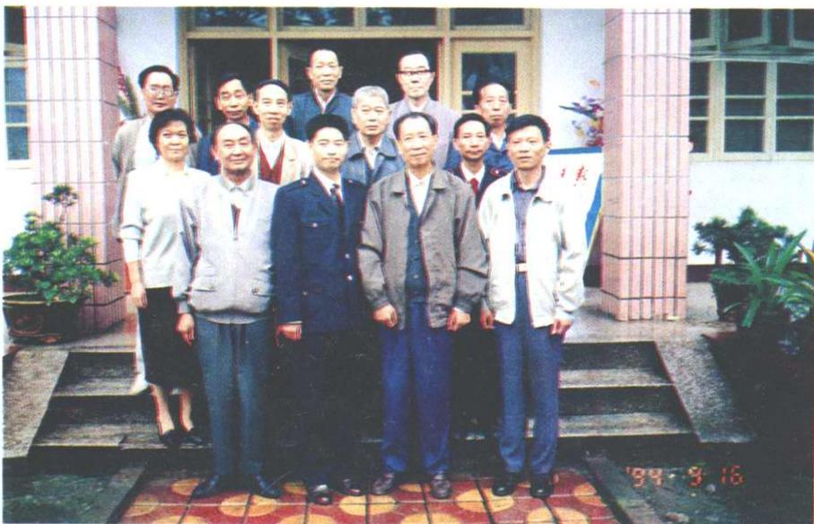
《市中区税务志》 领导小组、编委 会部分同志合影