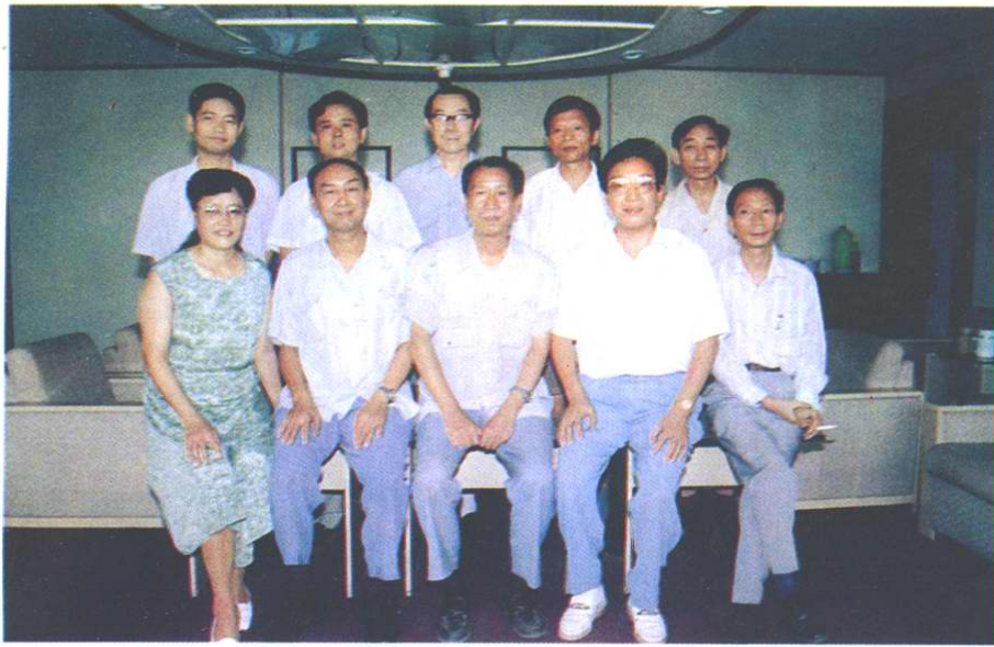
《市中区税务志》 领导小组成员合 影