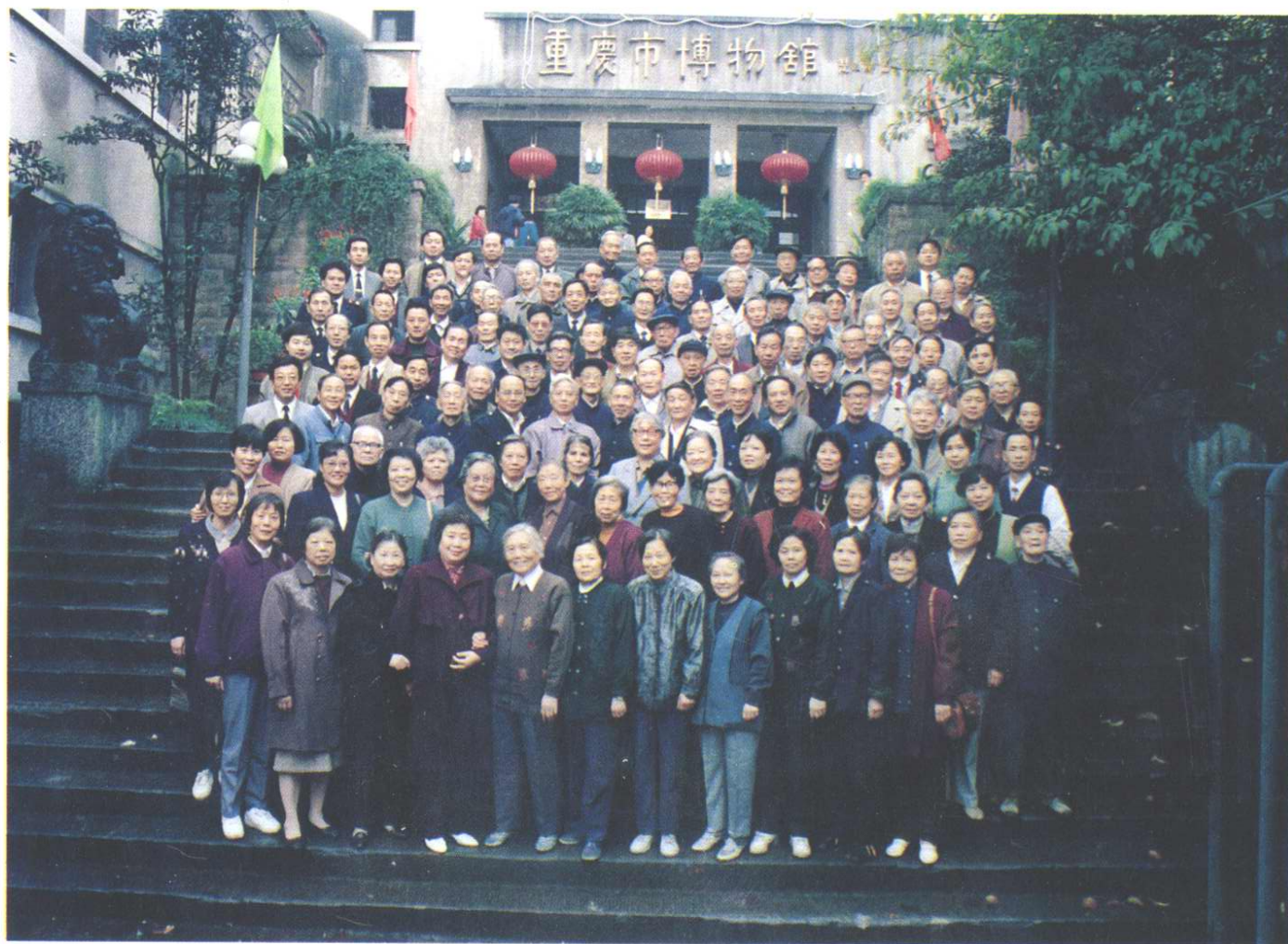
重庆市税务局市中区分局领导及部份科所长同离退休老同志合影