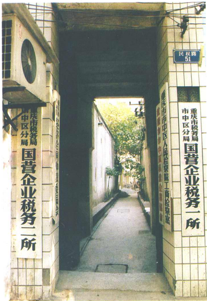
国营企业税务一所, 税务二所 (原址火药局巷)