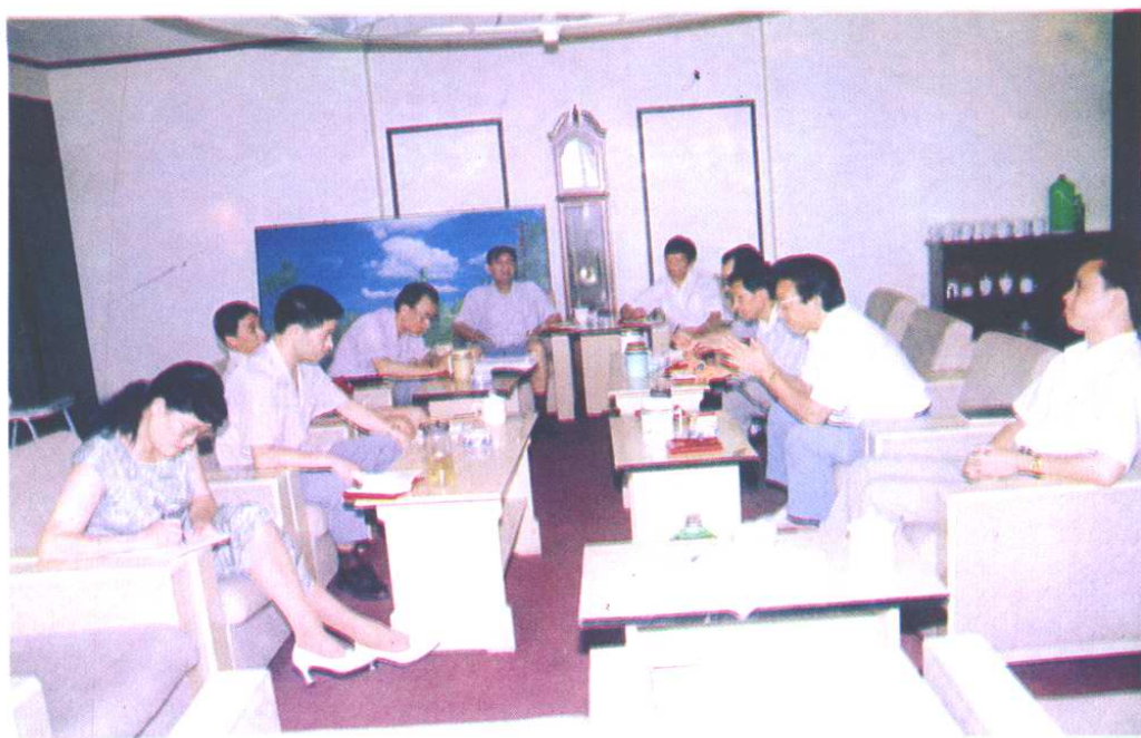
编志领导小组在听取编委会修志情况汇报