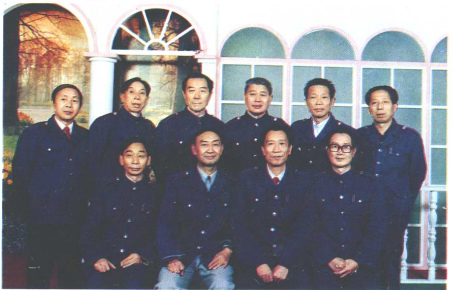
《市中区税务志》 编委会成员合影