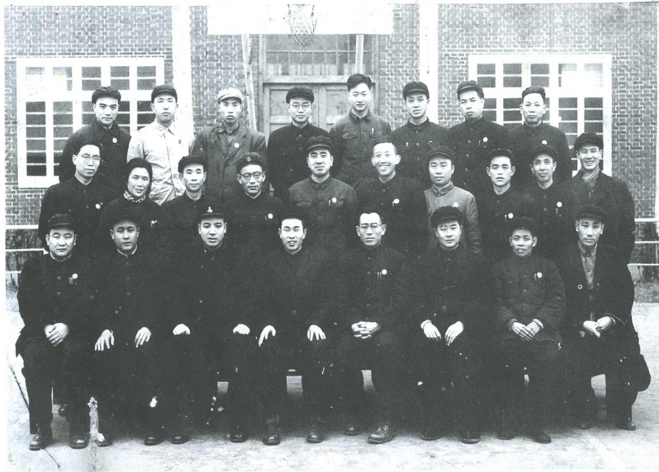
重庆市税务局、城区分局部份同志欢送王永福局长留影 1952年春