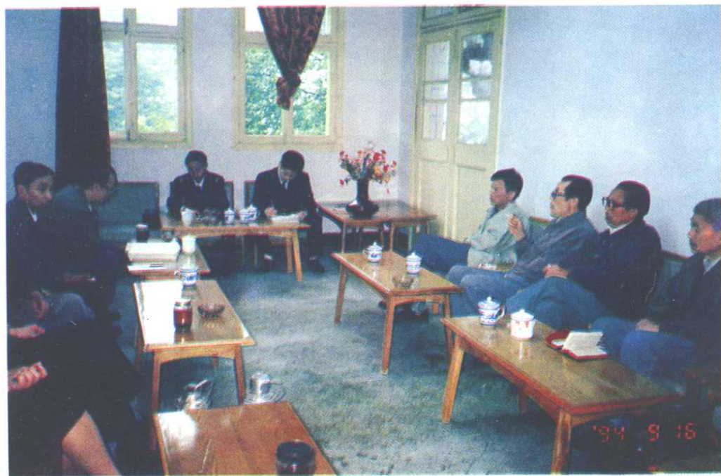
编志领导小组、编委会在审定税务志稿