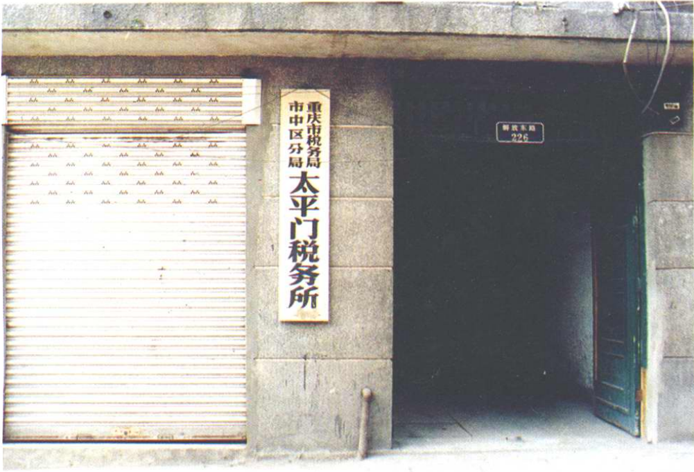
解放路(现太平门)税务所