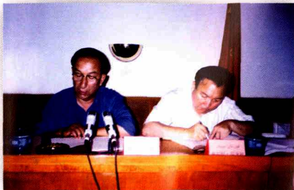
听取地区土地管理局局长述职报告