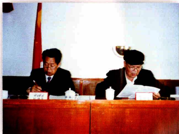
听取地区财政局财政预算报告