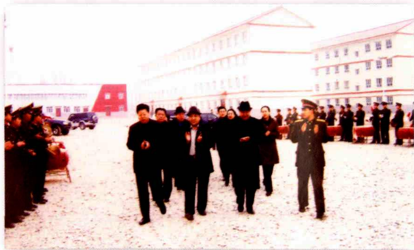
开展双拥活动，慰问部队