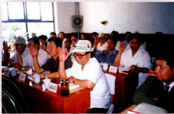
地区人大工委组成人员举手表决