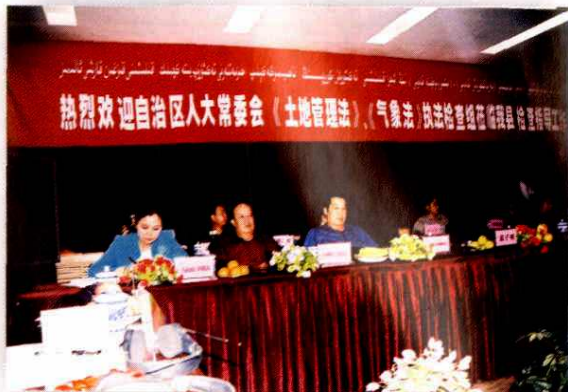
2004年5月11日,自治区人大在阿克苏地区检查《土地管理法》、《气象法》执行情况