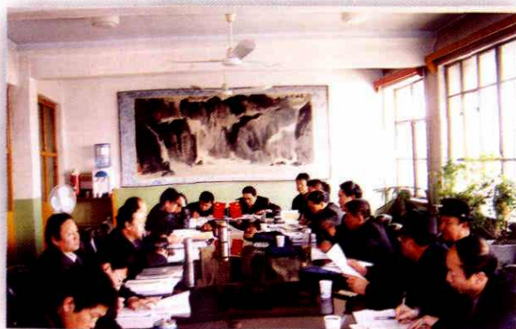
听取行署工作部门汇报，开展工作评议