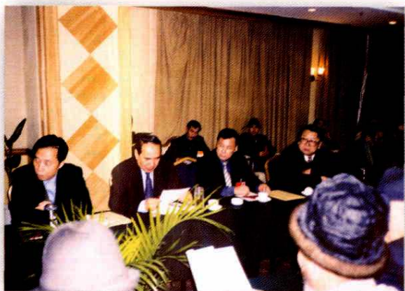
2002年1月,自治区主席阿不来提·阿不都热西提(左二)、副主席熊辉银(左一)与阿克苏代表团一起审议政府工作报告