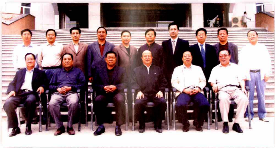
2005年工委组成人员合影