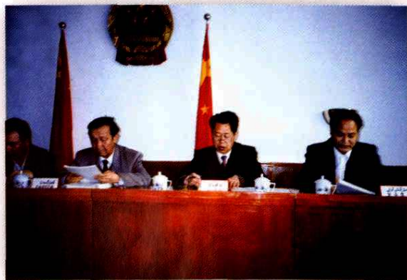
听取地区计划委员会工作报告