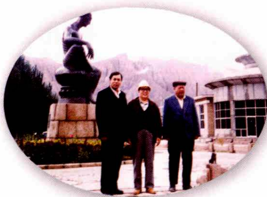
1995年9月6-7日，全国人大常委会委员、原湖南省委书记熊清泉到阿克苏调研