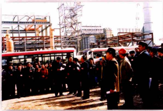
地区人大工委组织人大代表视察石油化工企业