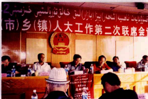
召开县市乡镇人大工作联席会议