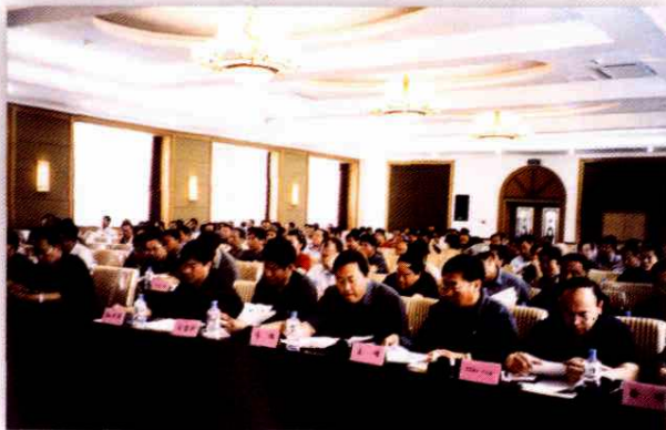
参加地委人大工作会议的县委书记、市长