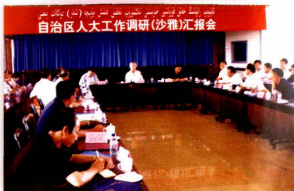
2005年6月3日,自治区人大在阿克苏地区沙雅县召开调研汇报会