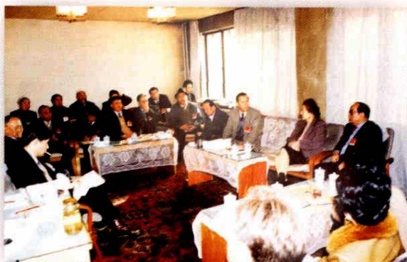
1996年1月,阿克苏代表团与自治区人大常委会领导一起审议自治区人大常委会和“一府两院”工作报告