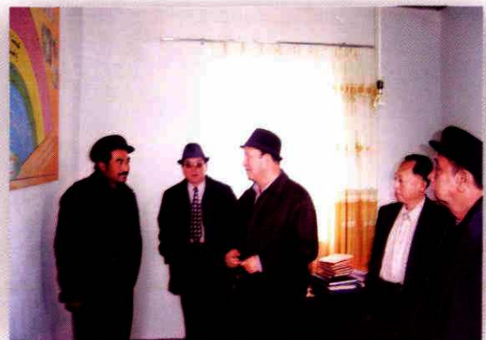
地区人大工委检查县乡人大工作