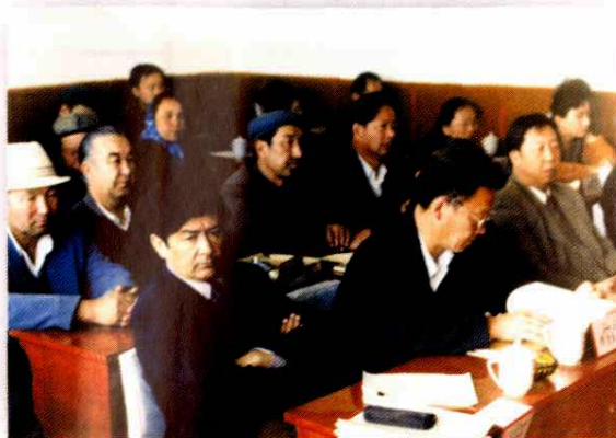
地区人大工委委员出席会议听取报告