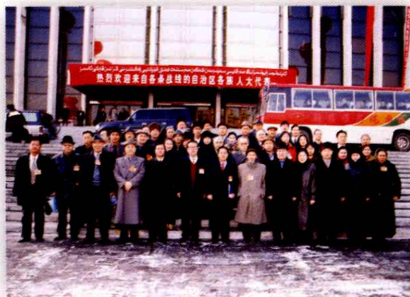
2000年1月，出席自治区九届人大会议的阿克苏代表团合影