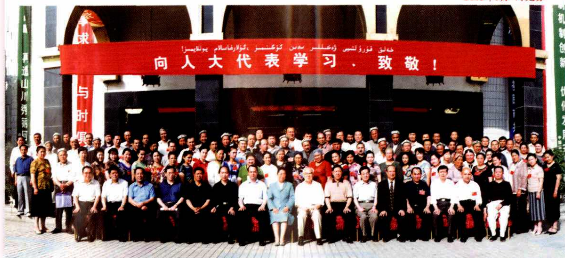
2005年5月，自治区人大常委会在阿克苏市举办培训班