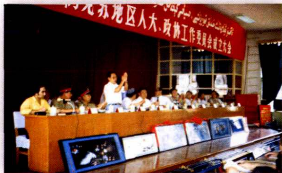
1992年8月15日，地区人大、政协工委成立，自治区人大常委会副主任夏尔西别克·司的克、自治区政协副主席迪亚尔·库马什到会祝贺