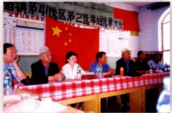
地区人大工委检查选举工作