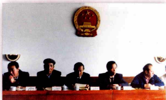
1995年，地区人大工委召开首次委员会会议，地委书记熊辉银（右二）出席会议并在主席台就座