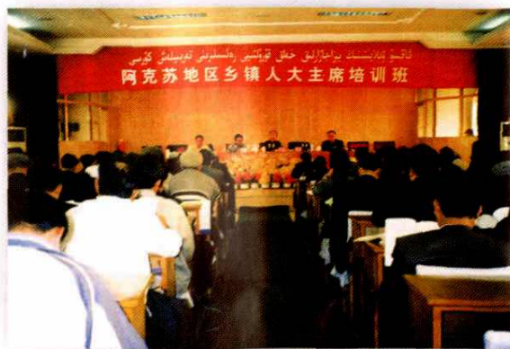
2001年，地区人大工委培训县、乡两级人大机关干部