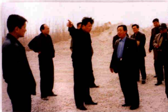
地区人大工委组织人员视察环境保护情况