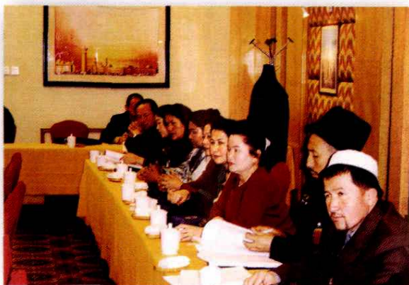
2005年1月,阿克苏代表团审议自治区十届人大三次会议工作报告