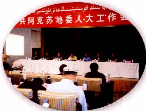
2002年5月22日，地委召开人大工作会议