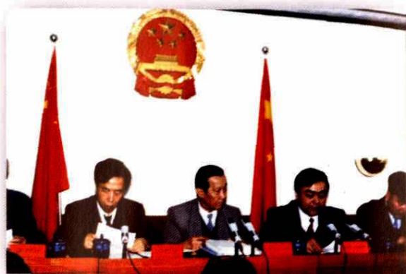
听取地区行署工作报告