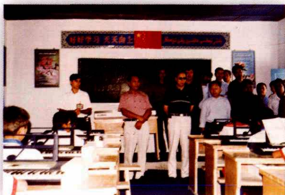
地区人大工委组成人员检查《义务教育法》实施