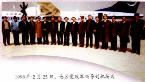
1998年2月25日，地区党政军领导到机场为出席九届全国人大会议的代表送行