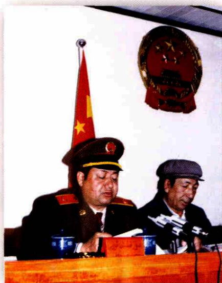
听取地区检察分院工作报告