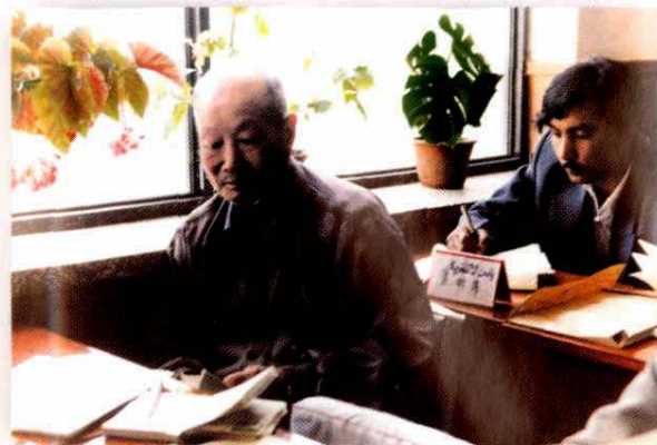
民主党派人士听取人大工委会议