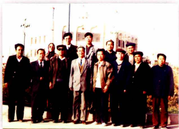
1992年12月，自治区人大常委会副主任阿不拉尤甫视察阿克苏时与新和县领导合影