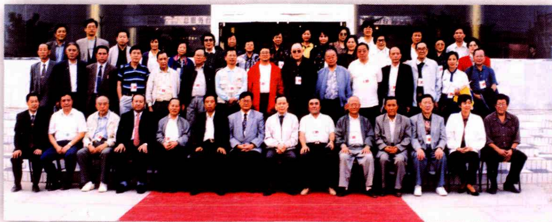
1996年9月9日，香港地区全国人大代表视察阿克苏合影留念