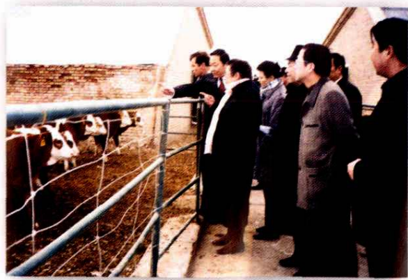
2001年3月,全国人大代表在阿克苏地区视察