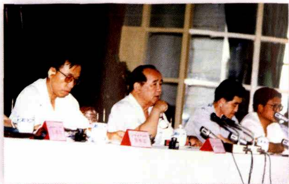
1994年9月22-25日，自治区人大常委会在阿克苏召开理论研讨会，自治区人大常委会主任阿木冬·尼牙孜（左二）在会上讲话