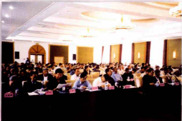
2002年5月22日，各县市人大主任、党委书记出席地委人大工作会议