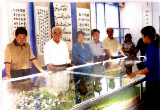
2005年5月25日-6月4日，自治区人大常委会主任阿不都热依木·阿米提（左二）一行视察阿克苏。图为视察柯柯牙绿化工程，左三为副主任海力且木·斯拉木，左一为地委书记朱昌杰