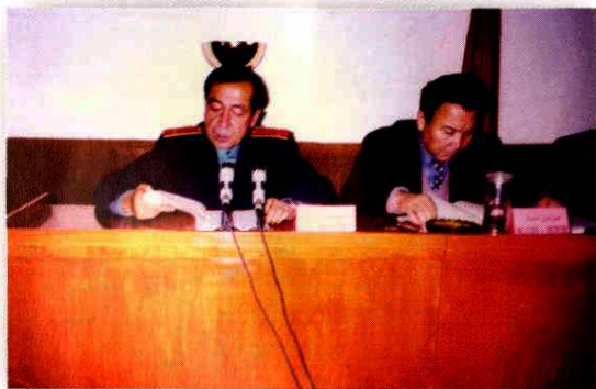
听取地区中级人民法院工作报告