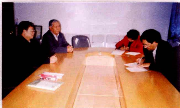
地区人大工委领导对拟任命的中级人民法院两名副院长进行法律考试