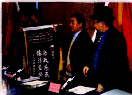
地区人大工委开展个案监督受到群众称赞