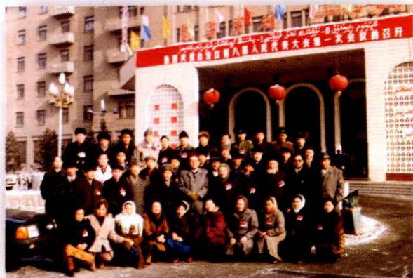
1993年1月，出席自治区八届人大会议的阿克苏代表团合影