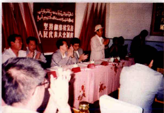
地区人大工委在温宿县召开工作经验交流会