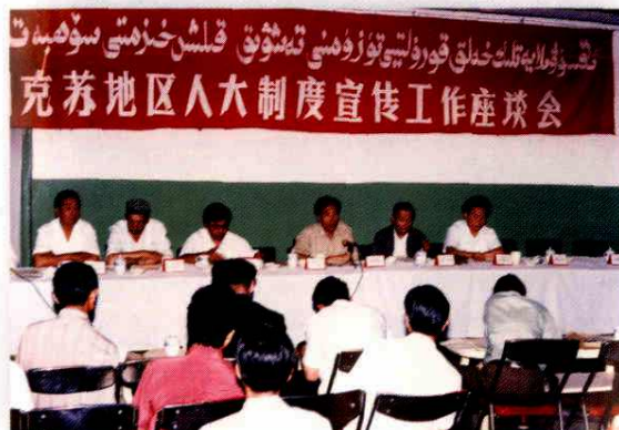
1994年5月，地区召开人大制度宣传工作座谈会