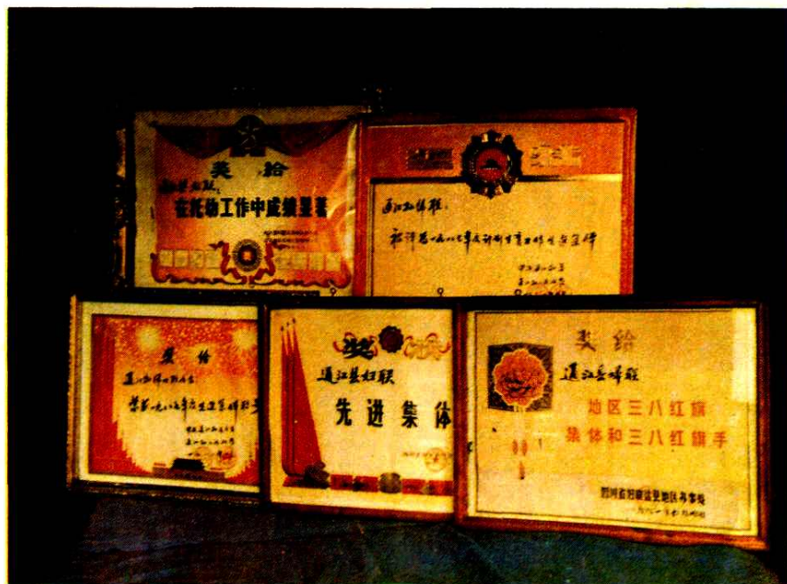
县妇联受省、地、县表彰的部分奖状。