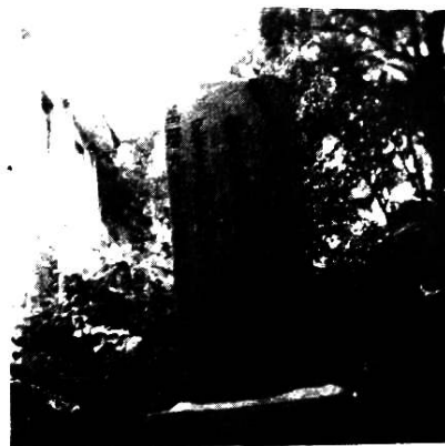
青峪乡现存的明万九年禁止早婚的石碑。碑文：都察院示谕军民人等知悉今后男婚年至十五六岁以上方许迎娶违者父兄重责枷号地方不呈官者一同枷责 万历九年十一月吉 分巡道石刻