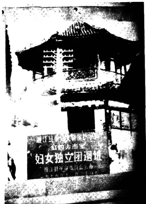
红四方面军在通江创建的妇女独立营遗址。