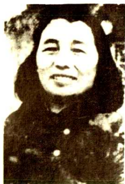
原红四方面军政治部主任 张琴秋