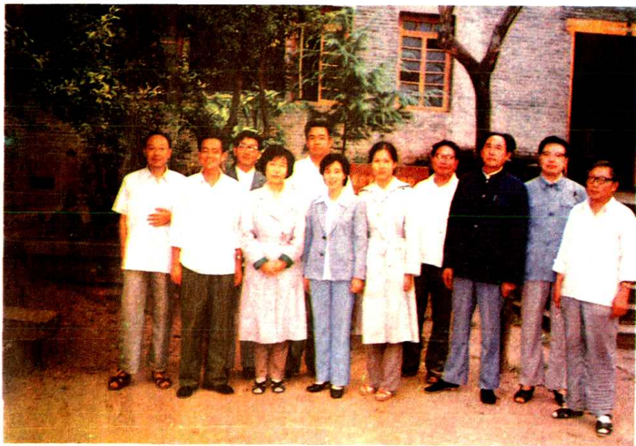
全国妇联副主席黄启琛（前排左二）在通江视察工作与县委、人大、政府等领导的合影。