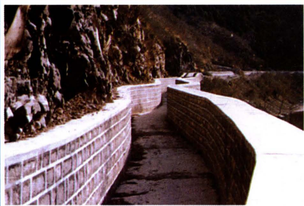
垣曲后河水库总干渠