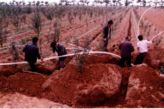
万荣渗灌工程铺设现场