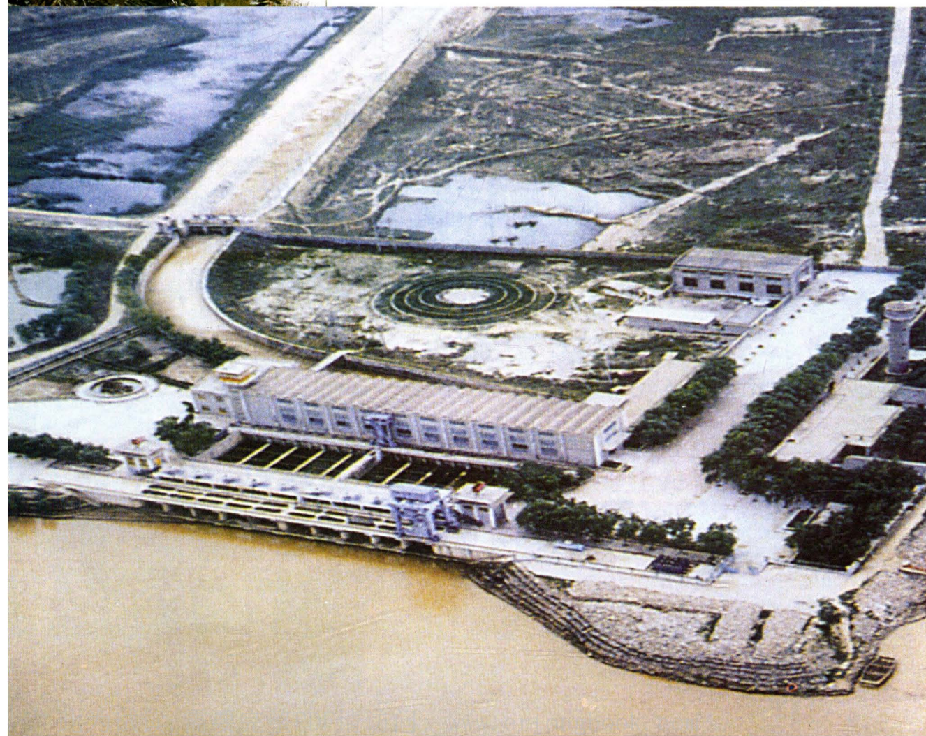
尊村引黄渠首及总干渠鸟瞰