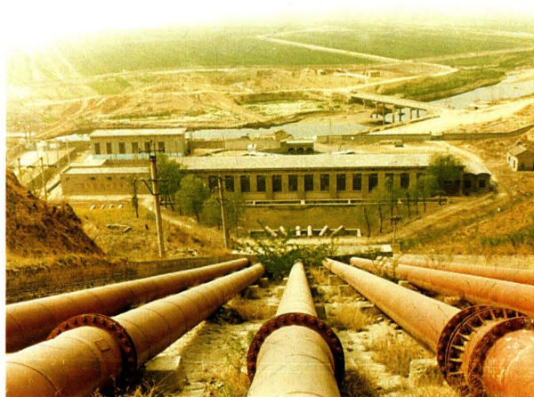
西范杨水工程一级站全貌