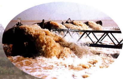
夹马口电灌站引水工程全貌