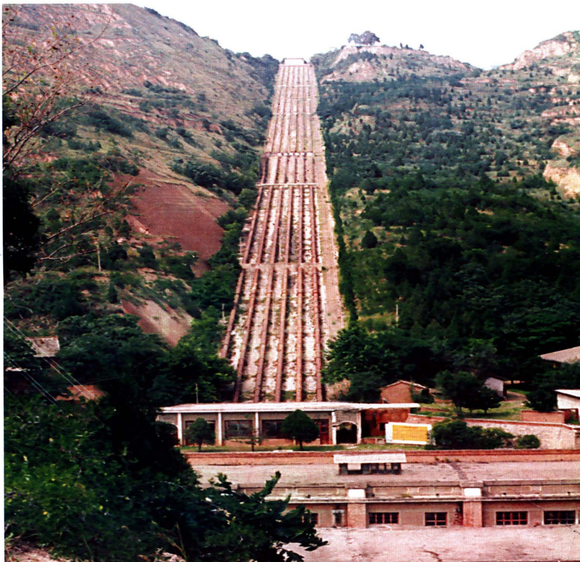
大禹渡引黄二级站管坡工程