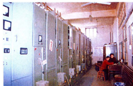
技术先进的汾南扬水工程一级站控制室