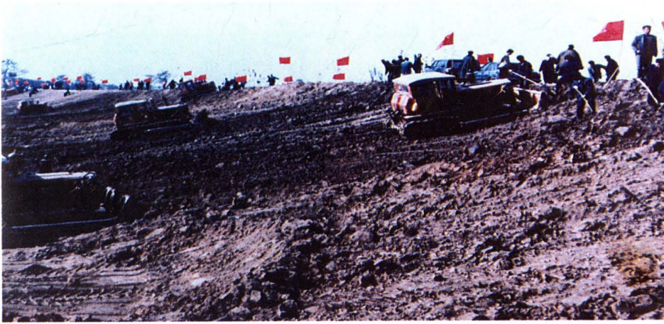
大规模治理汾河场面