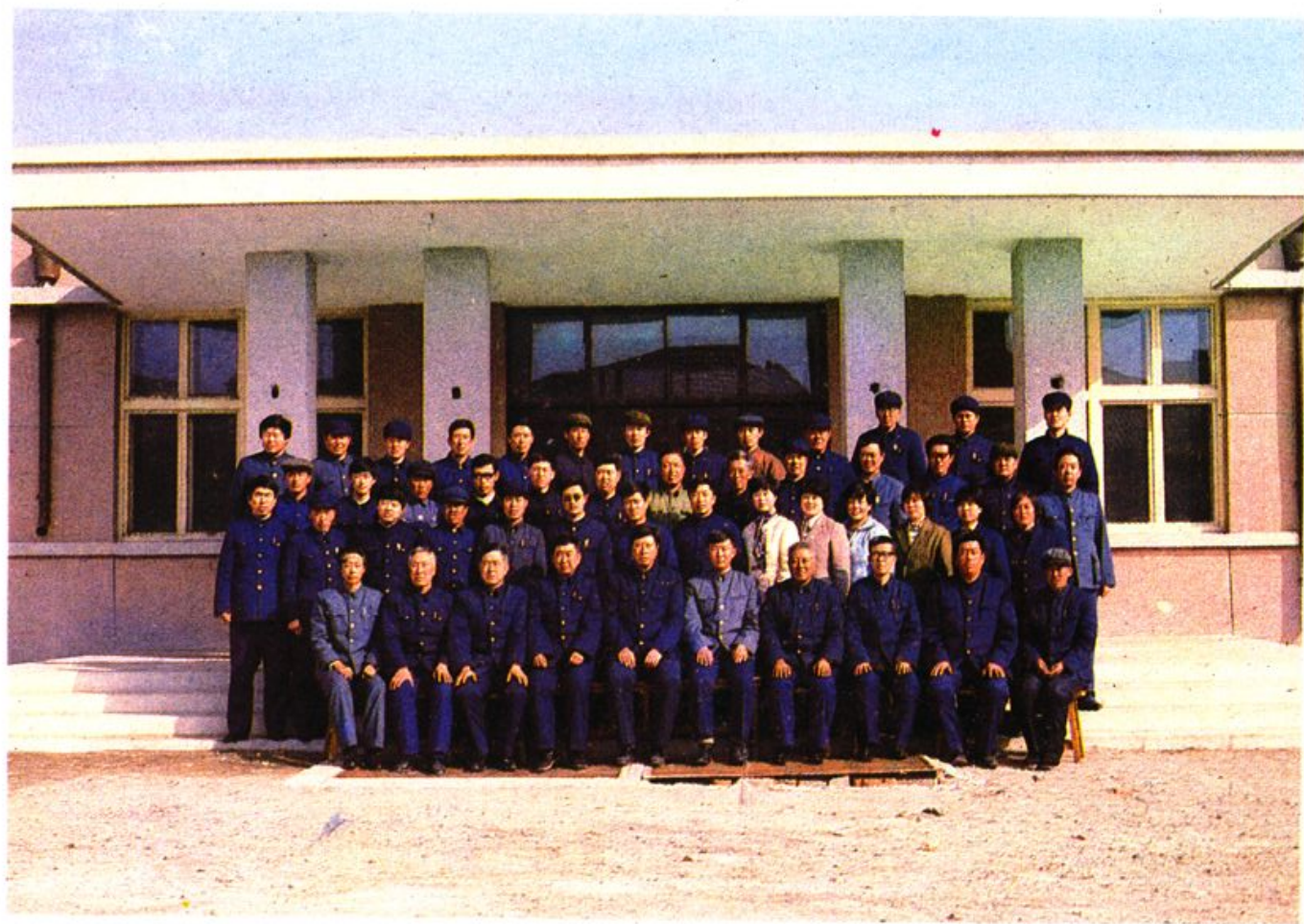
县联社机关全体职工干部