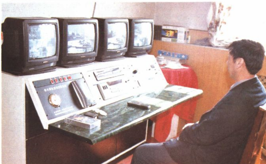
佳站货场监控系统