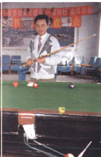
业 余 生 活