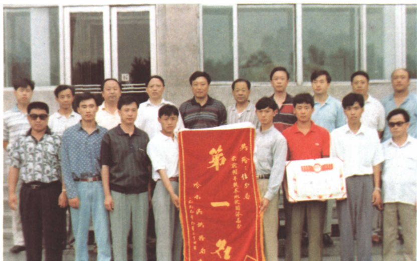
佳站领导与 调车技术能 手合影