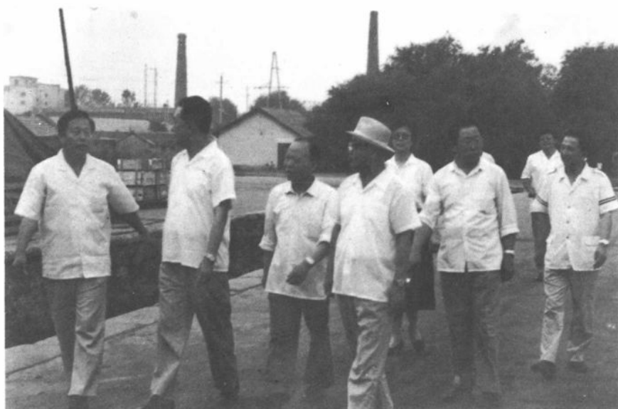
黑龙江省质协领导到佳木斯验收货场