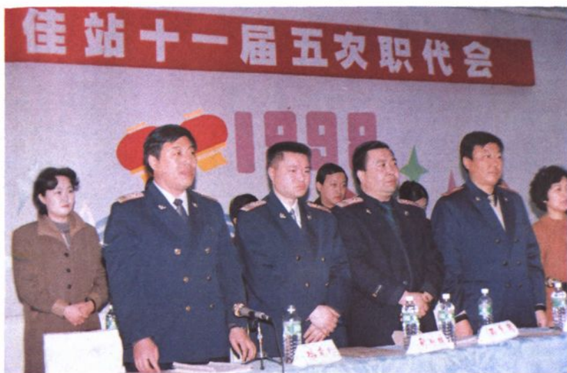
十一届职代会开幕式