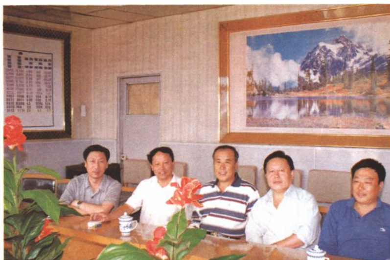
局领导到货场验收工作