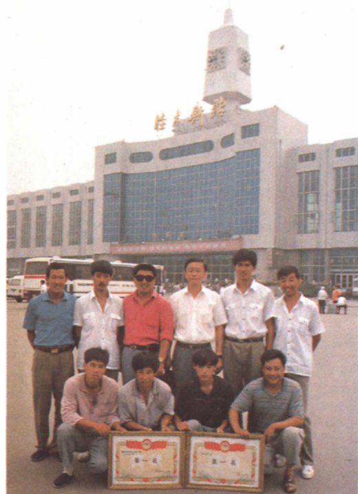
1994年夏季调车技术比武获局第一名