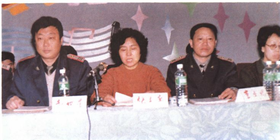
分局工会领导在站职代会上讲话