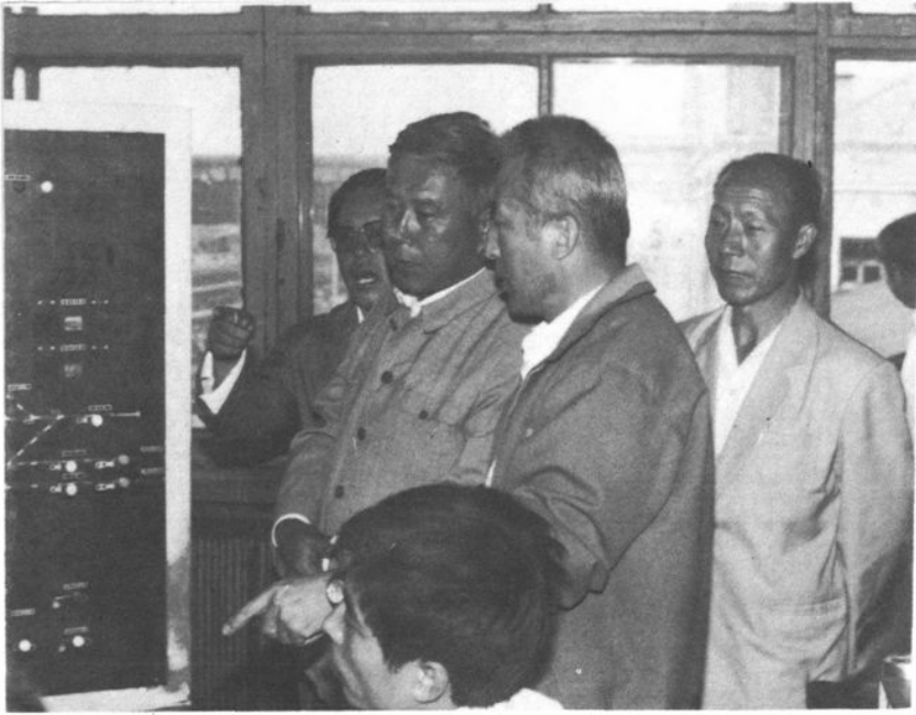
1990 年铁道部 部长李森茂到佳木斯站 视察 上图在信号楼