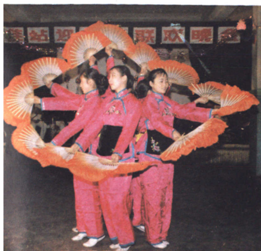
文 艺 表 演