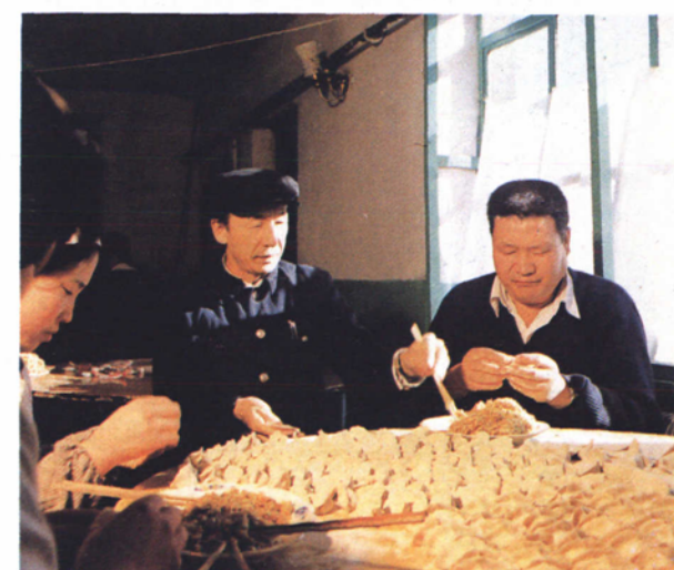
春运期间科室干部为一线职工包饺子