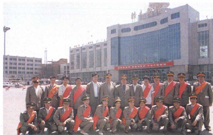
站领导与先进生产者合影