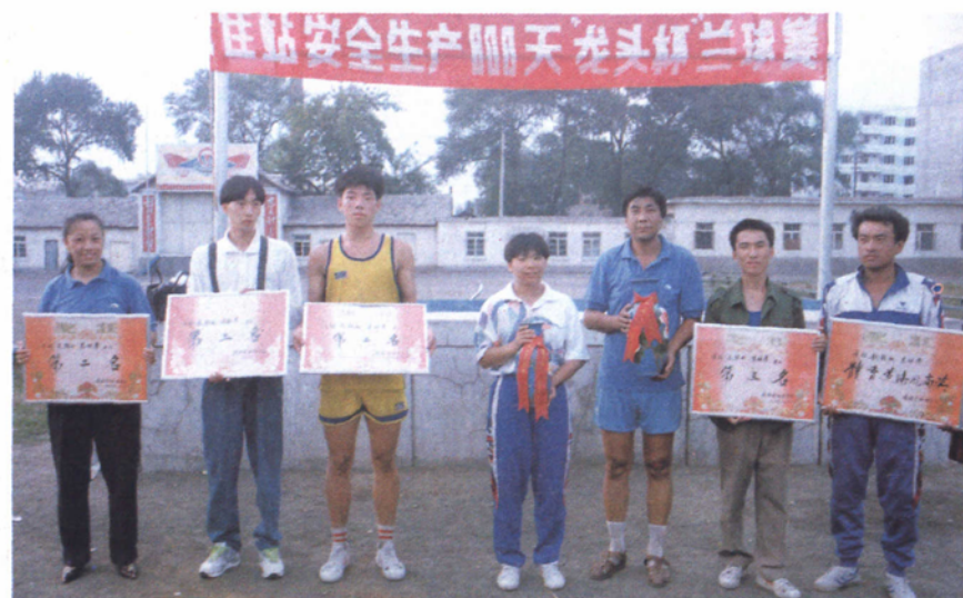
体 育 活 动