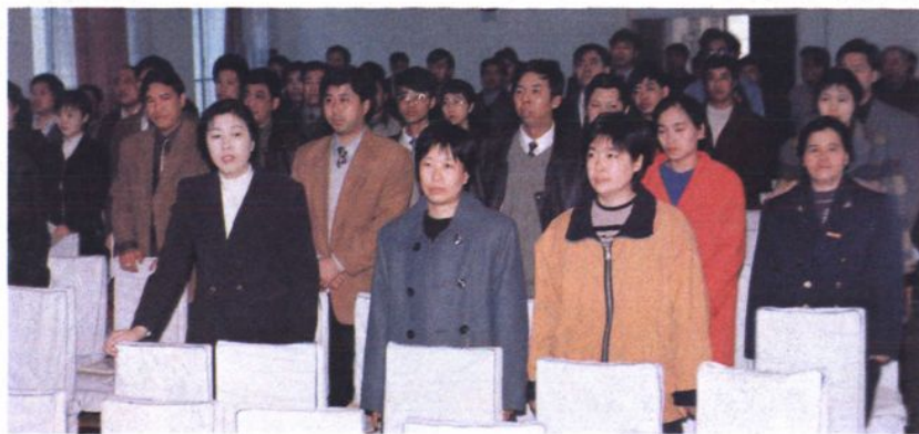
十一届职代会代表